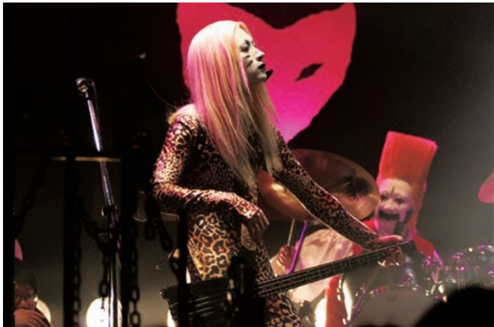
《重金搖滾雙面人》(Detroit Metal City)

座談主題：為台灣電影找活路 地點：國家文化總會一樓文化空間(台北市重慶南路二段15號) 報名網站：http://www.taiwancinema.com/ct.asp?xItem=57793&ctNode=255(台灣電影網) 時間：2009年1月9日(五)、10日(六)、11日(日)，共三場 討論議題：