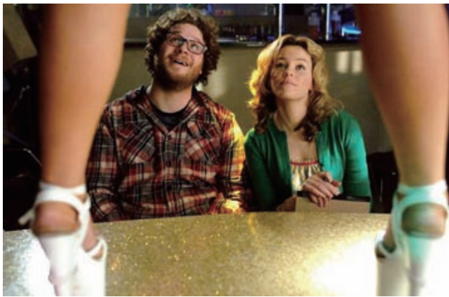
《Zack and Miri Makes a Porno》

唱會》，《孟漢娜3D演唱會》，《3D奪魂殺》，《3D地心冒險》等等。其實在很久以前，很多B級電影都是拍成3D的。這種類型再度藉著新科技復甦，也是一件值得一提的大事。其次還有一部很棒的，也很音樂有關的紀錄片《街舞開戰》，說實在，我曾經很喜歡嘻哈，但是近年來的嘻哈音樂當中那種商業化、反女性、反同性戀、男性沙文，把我搞得很煩，尤其是有些所謂台灣的嘻哈，歌詞還在講什麼把妹之類的東西，簡直……受不了。我想這部電影對於受嘻哈流行風格影響的台灣青少年，是非常有意義的，因為，這部片讓我們看到了嘻哈文化的原始精神。