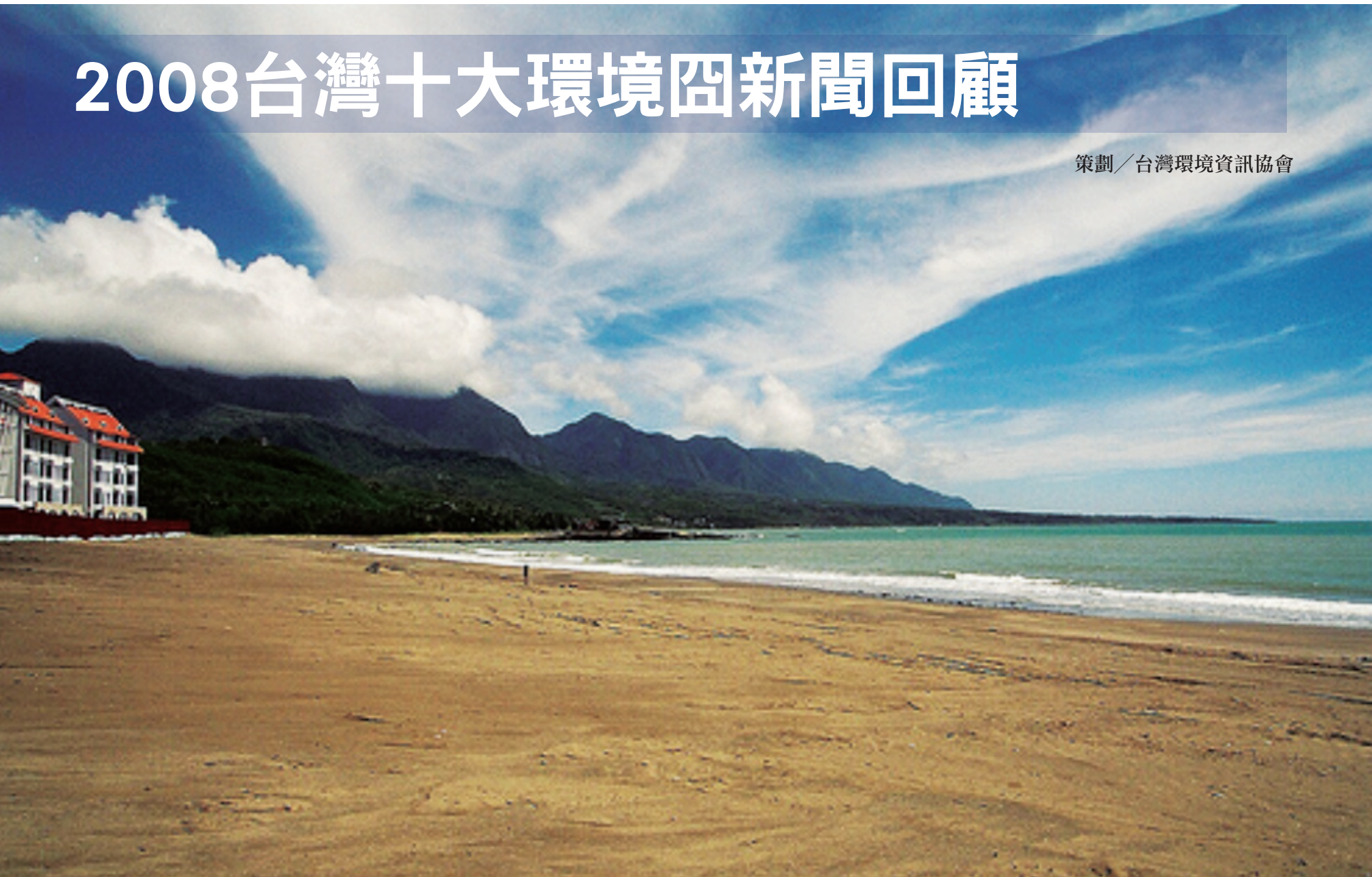
卑南鄉杉原海岸尚未通過環評，就先動工。