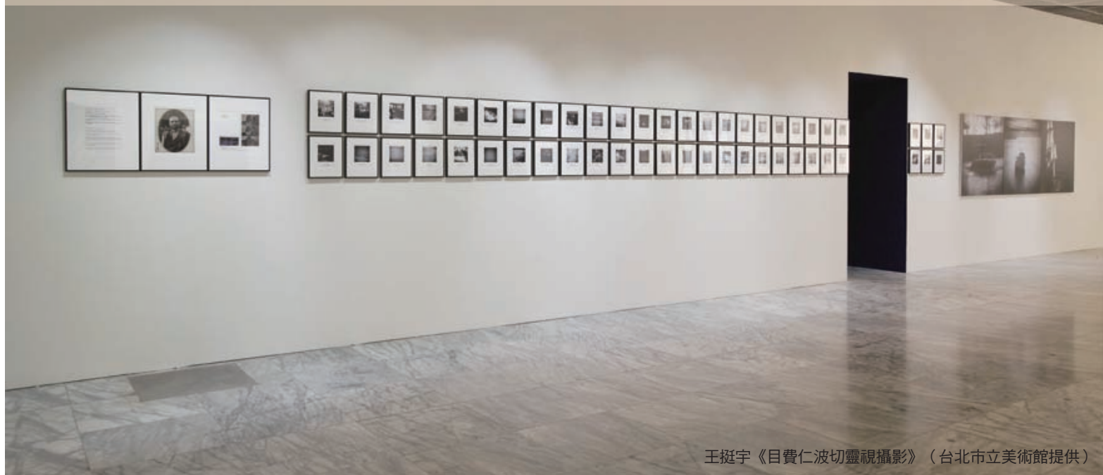
王挺宇《目費仁波切靈視攝影》