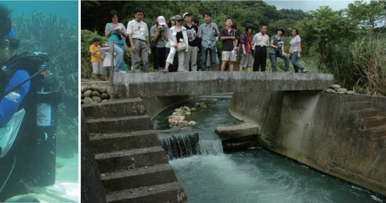
霄裡溪事件凸顯台灣對高科技產業把關過於寬鬆。

台塑集團起家的PVC事業，仁武廠長期「合法」污染下游1,600公頃的農田，估計相當於每年在後勁溪傾倒毒物約330~380公噸，王永慶曾承諾「環保標準要超越歐美」，但所排放「二氯乙烷、氯仿」濃度仍超越歐盟標準數十倍。六輕建廠前，王永慶曾誇口油價將比中油低，內銷定價卻不乏力中油高時，甚至污染留台灣、外銷賺大錢；其對地方回饋承諾幾乎跳票，卻在2006年台塑鋼鐵環評會上，全數推給雲林縣政府。