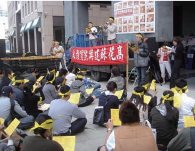
蘇花高一度更名混淆視聽，爭議不斷。

經過上千名網友票選，整體結果來看，2008台灣的环境新聞中，囧的負面意義大於正面意義，以下是2008十大環境囧新聞整理報導：