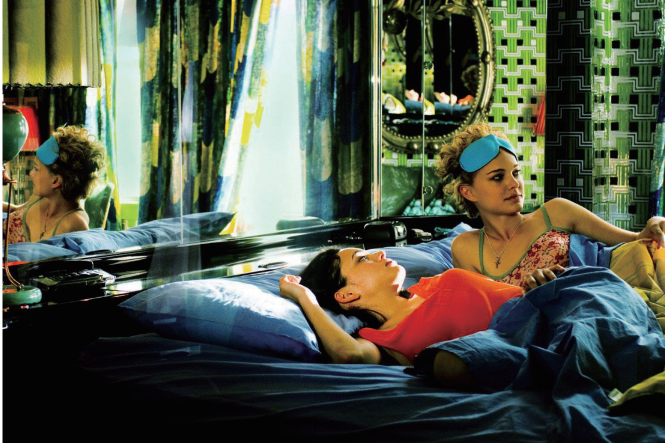
《我的藍莓夜》

嗎？而且我個人最愛的王家衛作品，剛好就是這兩部呢。另一部很勁爆的文藝電影是《戀空》，這部電影很白癡、很夢幻、很白目、對白超噁……等等。但是，一部文藝片，難道不應該就是這樣嗎？泰國電影《曼谷愛情故事》可以說是《戀空》的同性戀版本，同樣又白癡又好看。