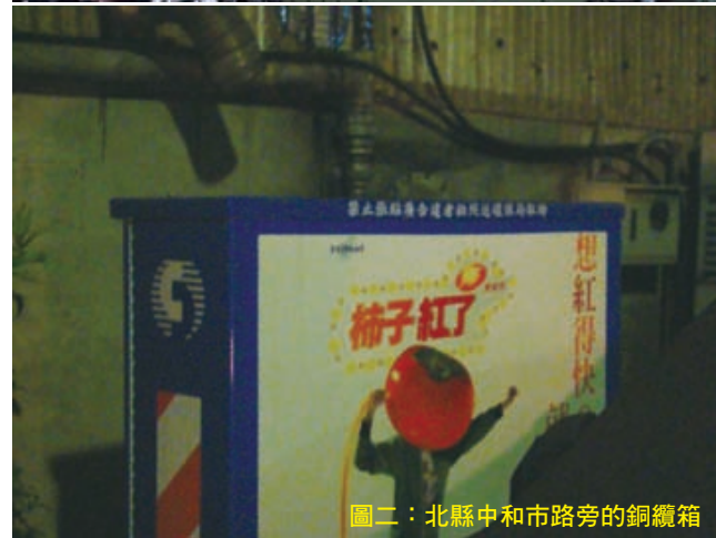
圖二：北縣中和市路旁的銅纜箱

小野花，這或許便是台北市願意斥資80億籌辦「2010台北國際花卉博覽會」的主因吧！是吧？