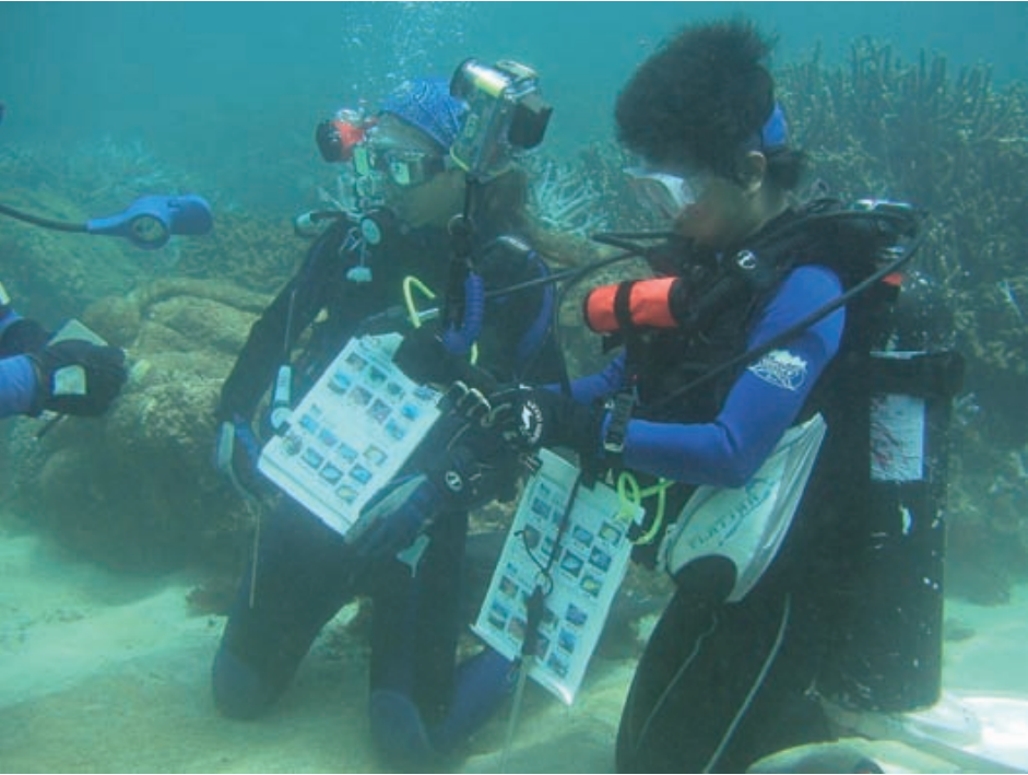
2008年十年一度的「國際珊瑚礁年」