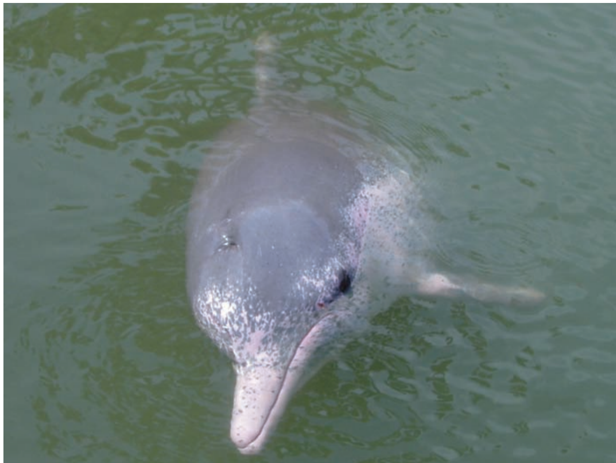
專家籲搶救中華白海豚

2008下半年，台灣近海海域發生兩起擱淺事件，先是10月8日漂流長達三個多月的印尼籍海上作業平台，載有近30台大型機具，在蘭嶼海岸擱淺後，因不堪風浪擊打，船身