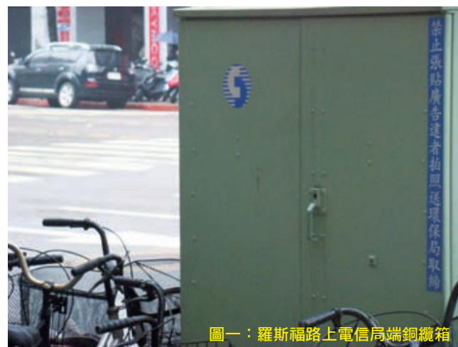
圖一：羅斯福路上電信局端銅纜箱

路邊的野花不要採，這首當年鄧麗君暗諷男性偷腥的名曲，在台灣都會區路箱與水泥人行道的遮蔽下，已漸漸不復見那朵綺麗的