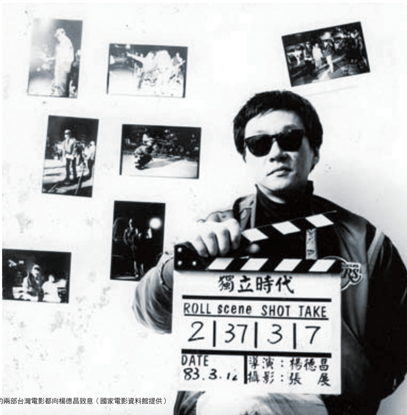
2008年最頂尖的两部台灣電影都向楊德昌致敬