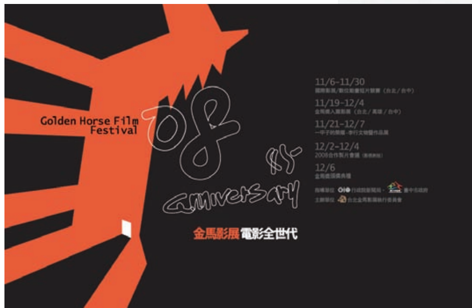
2008金馬影展主視覺