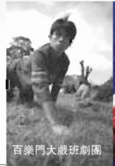
百樂門大戲班劇團

主辦單位：台北市文化局 協辦單位：中華民國專業者都市改革組織 詳見網站： www.treasurehill.org 聯絡方式： treahill@treasurehill.org 、 lara@ihpao.com