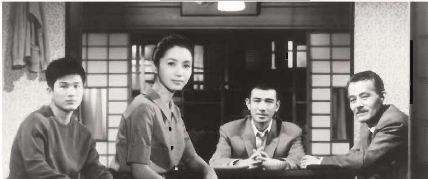
Japan's nuclear family, here in a still from An Autumn Afternoon (1962), the last film by Japanese director Yasujiro Ozu. The international critical and commercial success of this movie, made just one year before his death, led to a discovery of his work by Western critics.