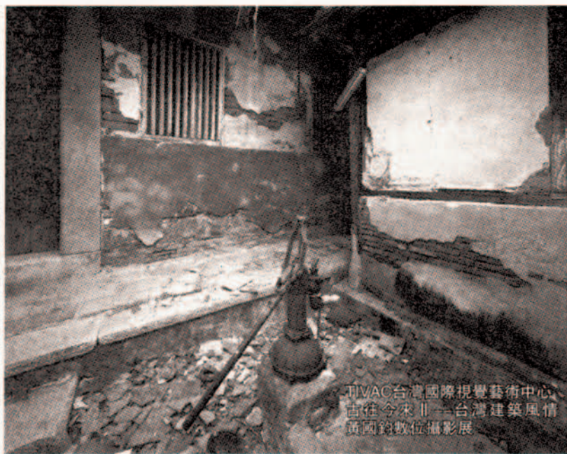
由VAC台灣國際視覺藝術中心、 古往今來——台灣建築風情 英國數位攝影展