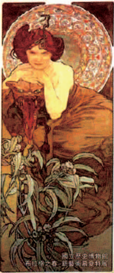
國立歷史博物館 布拉格之春-新藝術夏特展

9/28(六)痕跡/歡迎幼稚園大班至國小六年級小朋友及家長參加 報名方式:活動當日13:30-14:20現場接受報名200人,額滿為止