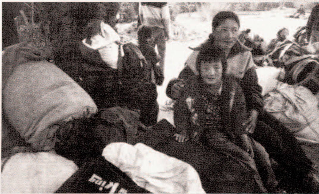
藏族人蛇在尼泊爾等候安置。