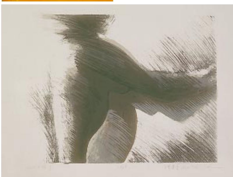
「單數 -- 複數」版畫與雕塑展 誠品書廊