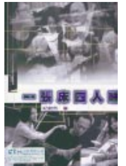
書名：一張床四人睡 作者：紀蔚然 出版：書林

這齣戲將於六月十七日至二十四日於國立台灣藝術教育館演出十場，而這個劇本在你看到真實演出之前，可以在各種曖昧情感之間找到非舞台(非可見)的秘密狂喜，或者深情喜劇。這個劇本從「吻」開始，以「吻」結束；從兩個男女的愛恨糾結，寫到他們各奔東西。作者是多部劇本的創作，包括了《愚公移山》；《死角》、《難過的一天》、《黑夜白賊》、《夜夜夜麻》、《也無風也無雨》、《絕地反擊》(電影腳本)。