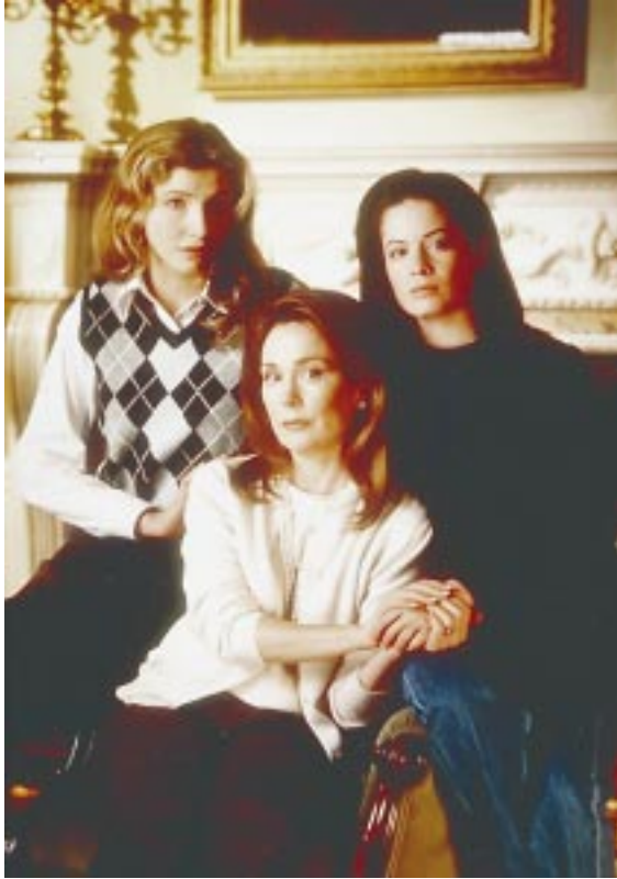
下午 1:15 CINEMAX (導演: 李察塔格 Richard Tuggle, 1986) 主演: 安東尼麥可霍, 珍妮萊特