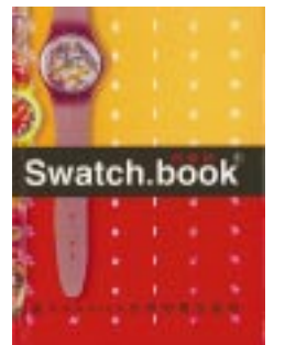
書名：Swatch.book 作者：邱莉燕 出版：貓頭鷹

這齣戲將於六月十七日至二十四日於國立台灣藝術教育館演出十場，而這個劇本在你看到真實演出之前，可以在各種曖昧情感之間找到非舞台(非可見)的秘密狂喜，或者深情喜劇。這個劇本從「吻」開始，以「吻」結束；從兩個男女的愛恨糾結，寫到他們各奔東西。作者是多部劇本的創作，包括了《愚公移山》；《死角》、《難過的一天》、《黑夜白賊》、《夜夜夜麻》、《也無風也無雨》、《絕地反擊》(電影腳本)。