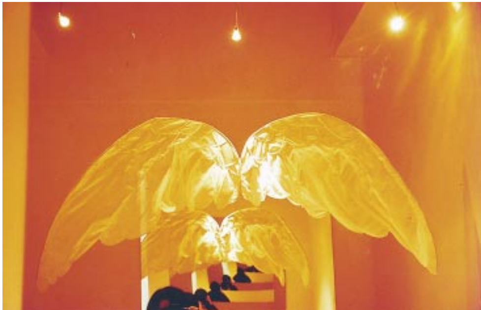
蔡汶芳「翼」 國立藝術學院美術系畢業展 郭木生文教基金會藝術中心