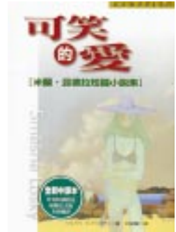
書名：可笑的愛 作者：米蘭昆德拉 邱瑞鑾譯 出版：皇冠

坊間學英文的的書多如牛毛，但是把英文當語文當然不錯，不過能把英文當文學，在學英文的同時知道其典故與歷史，就棒呆了。就像希臘悲劇詩人皮底茲說的：「翻騙每一塊石頭」，本書揭露英文最生動活潑的典故，供讀者瀏覽名山。從蘇格拉底到希臘羅馬歷史的哲學與英雄戰爭，每一個成語都引出原始文本，每一個重要作家都畫書身影。爲絕佳的英文/文學學習書籍。