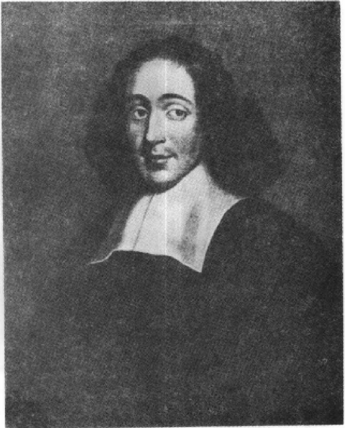
海牙国立博物馆藏斯宾诺莎像的摹本 (原画约作于1665—1666年，现藏伏尔封布特城图书馆)