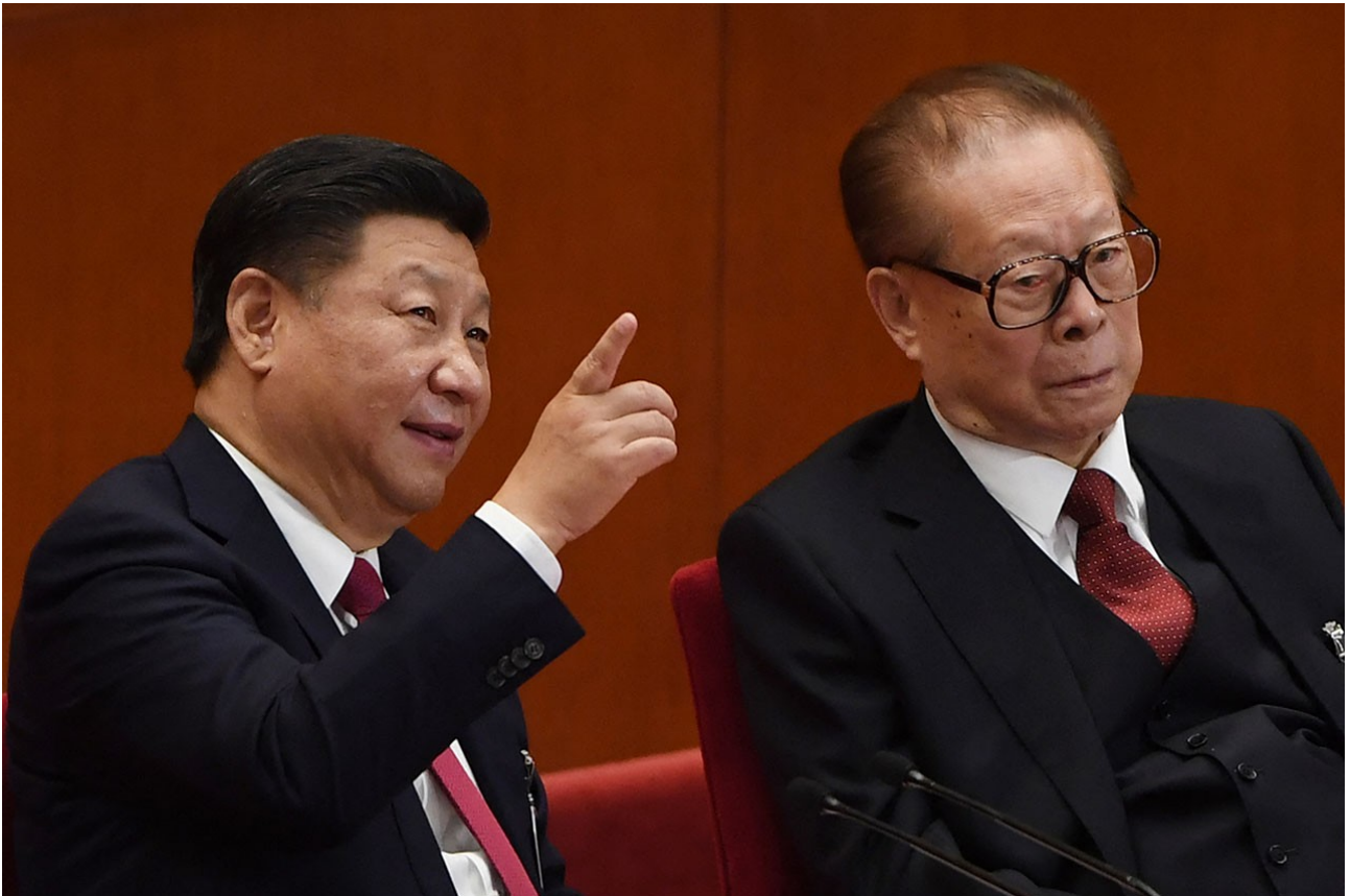
冯客的肤色接近于肉色+黄色而不是白色，深浅程度与这两位 CCP 头目非常接近，甚至猪头习手部的肤色看起来比冯客还更浅一点。来源：中国近代史专家冯客：习近平是江泽民路线的追随者： https://www.rfa.org/mandarin/yataibaodao/zhengzhi/ec-02202024074339.html