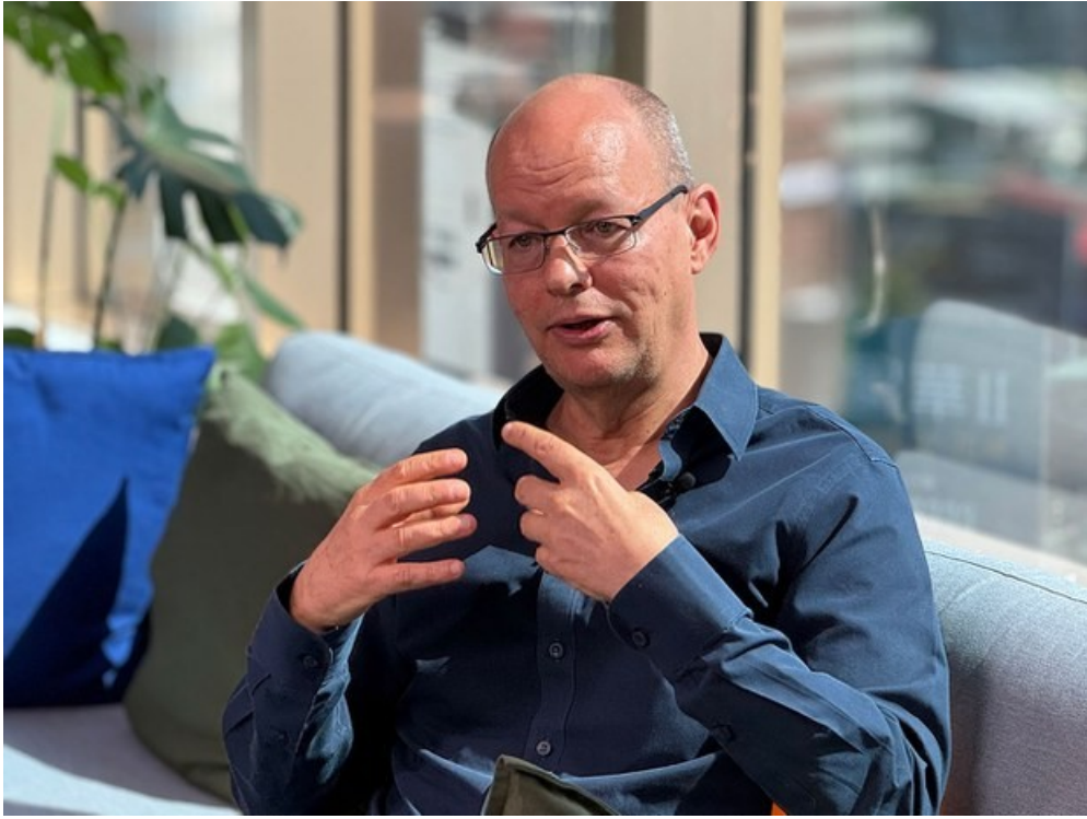
上面这位是《人民三部曲》的作者荷兰汉学家冯客，这是他接受自由亚洲电台采访时的照片，下面是猪头习和蛤蟆江的照片：