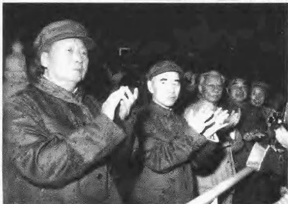
毛泽东等接见红卫兵群众。刘少奇参加了接 见活动,这时他已受到批判。(1966年8月)