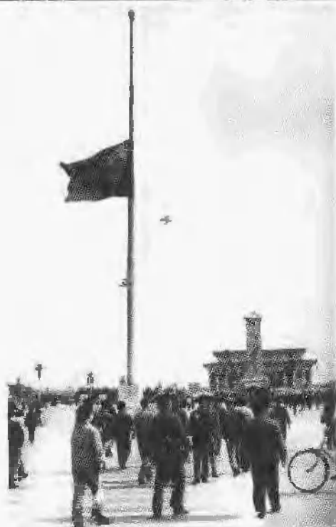
天安门广场的五星红旗在晴空中低垂，为刘少奇志哀。(1980年5月17日)