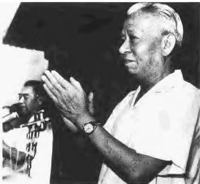
刘少奇在首都 人民支持越南 人民抗美救国 斗争大会主席 台上。(1966年 7月)