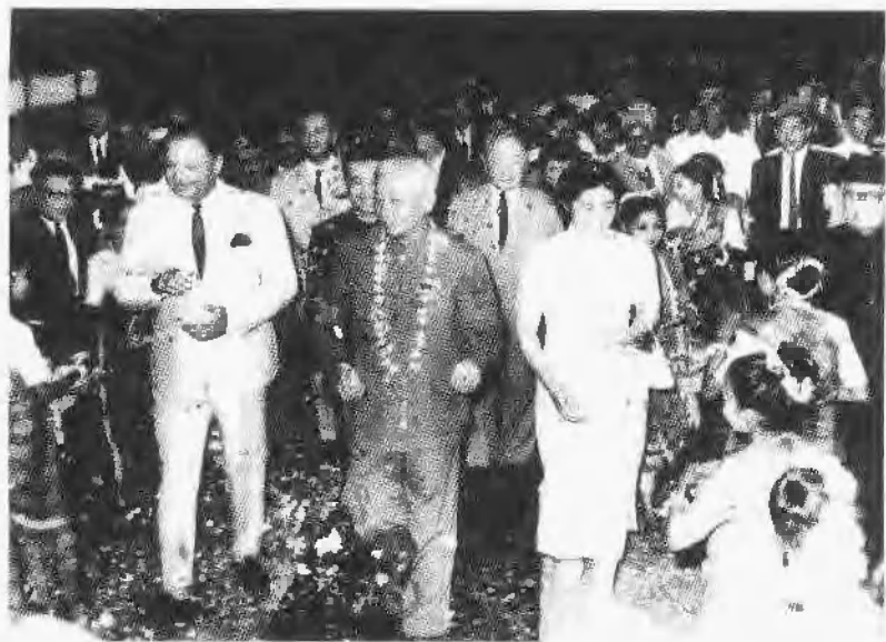
刘少奇在巴基斯坦访问。这是他最后一次出访。(1966年3月)