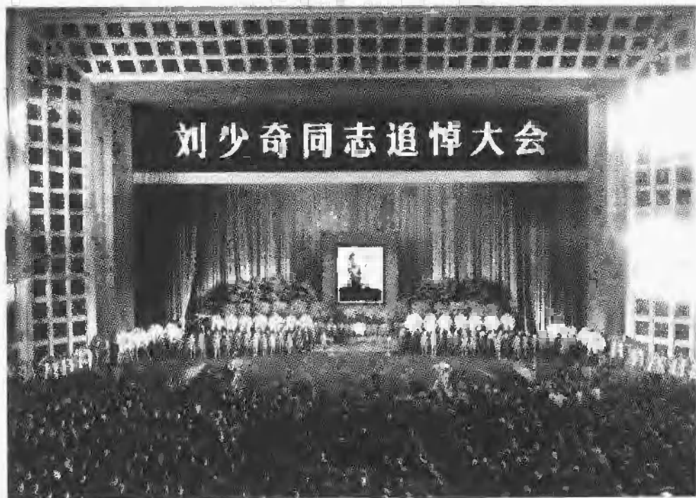
刘少奇追悼大会在人民大会堂隆重举行。(1980年5月17日)