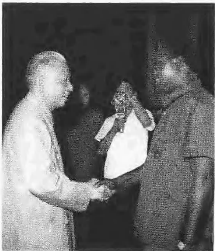
刘少奇欢迎赞比亚工商部长钦巴率领的访华友好代表团。这是他最后一次会见外宾。(1966年8月5日)