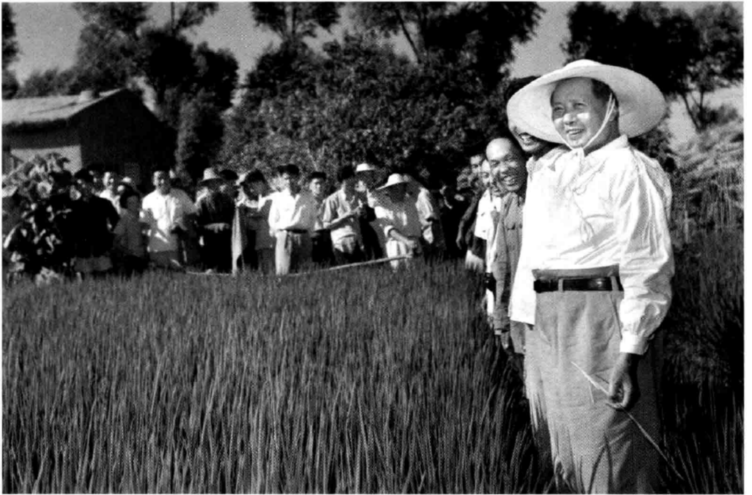
毛澤東 1958 年 8 月 13 日視察天津時，一些高等學校經營工廠的方式給他留下了印象。就在北戴河會議上，他發言讚揚這樣做法，同時他還奚落把農業大學建在城裏。