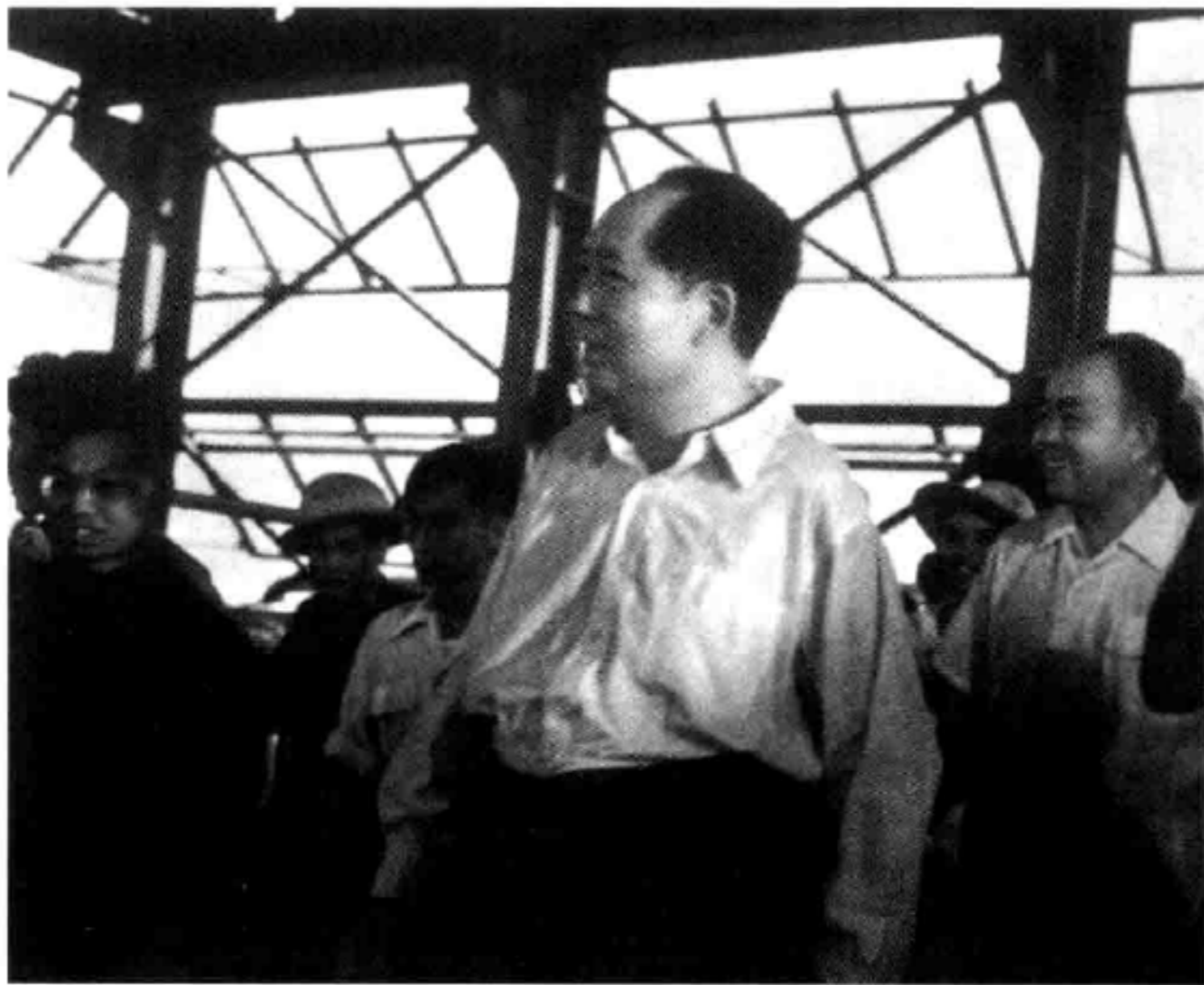
1958 年下半年毛被鋼鐵生產迷住了。之前，毛戰人，戰天，這二者都是不確定的。毫無疑問，到了 8 月，他一心投入了鋼鐵生產的戰鬥。他認為這個是確定可控的。圖為毛澤東在 9 月訪問武漢，參觀武鋼第一爐鐵水出爐。