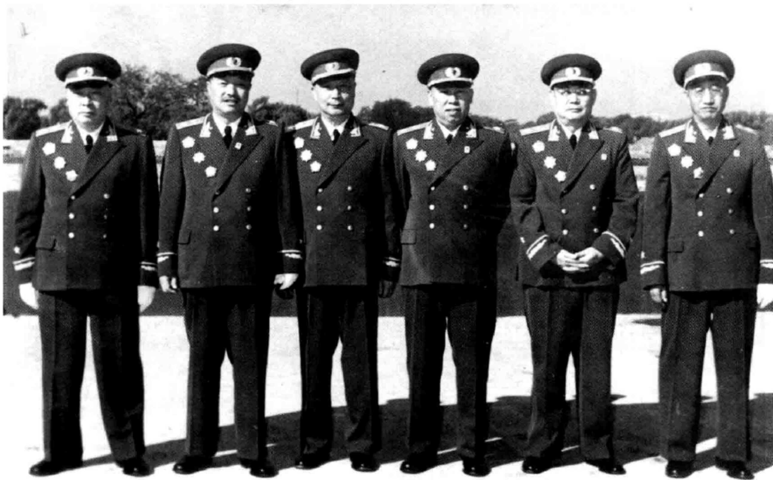
1959年，陳毅、賀龍、聶榮臻、羅榮桓、葉劍英和徐向前。