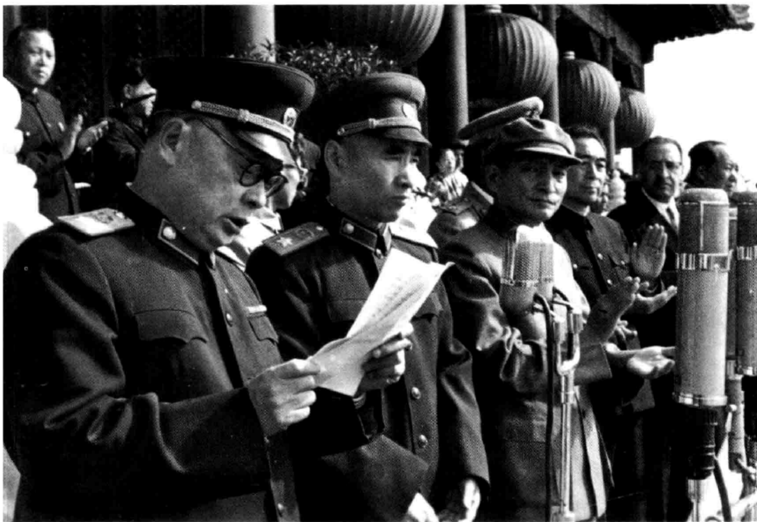
1960年10月1日，陳毅、林彪和陳雲在天安門。