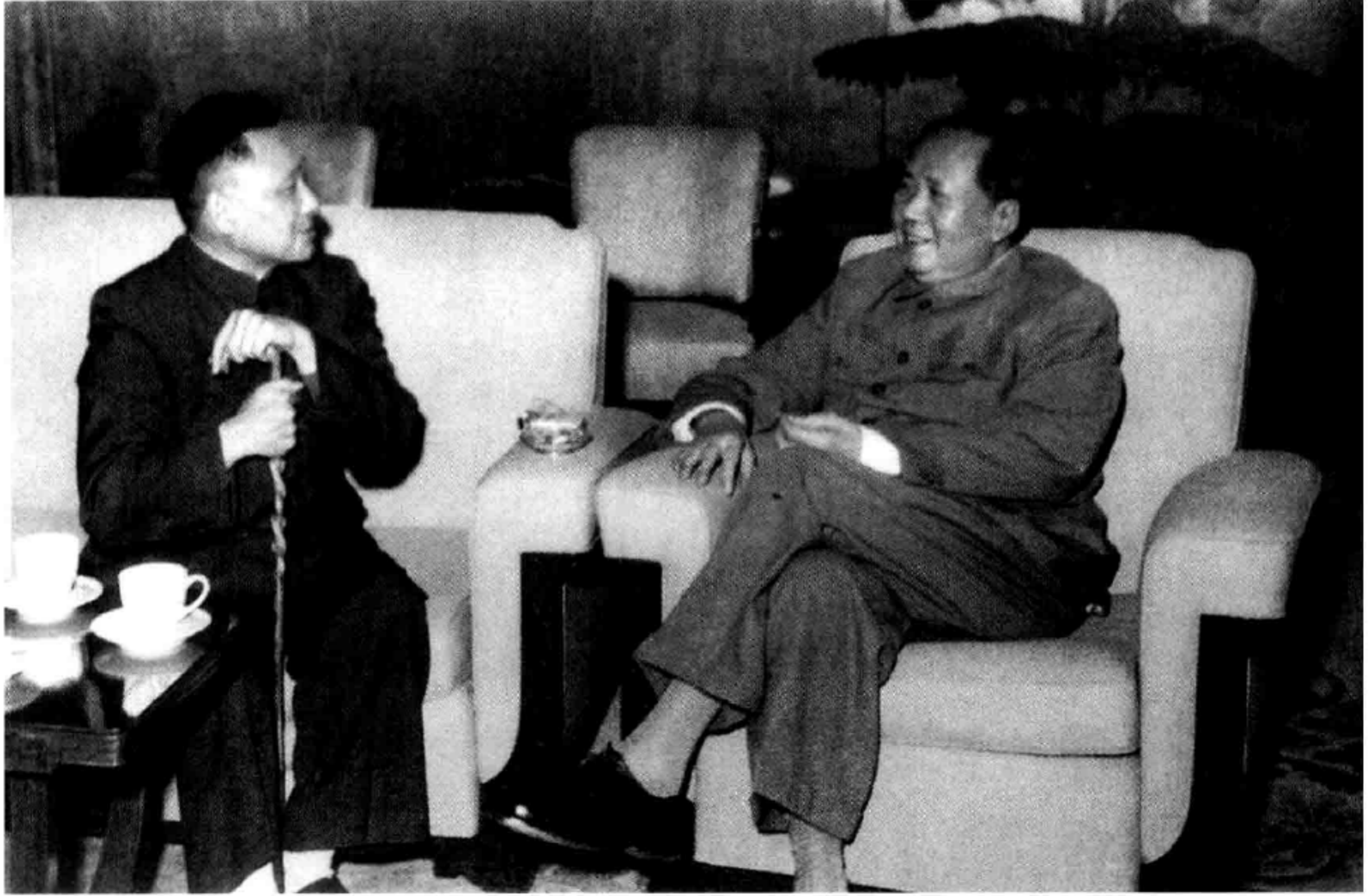
鑒於與劉少奇的一系列分歧，毛可能在內心深處認為林彪和鄧小平是更合適的繼承人候選人。圖為 1960 年。