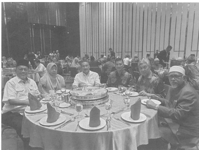
Rakaman suasana majlis makan malam di Hotel Sheraton.

Antara presiden-presiden parti yang turut hadir ke Hotel Sheraton adalah Zahid Hamidi (Bagan Datoh – Presiden Umno), Abdul Hadi Awang (Marang – Presiden Pas), Azmin Ali (Gombak – PKR), dan Presiden MIC yang juga Presiden Dewan Negara, S.A. Vigneswaran. Muhyidin Yassin (Pagoh – Presiden Bersatu) tiba sekitar pukul 8.30 malam, kemudian disusuli oleh Syed Saddiq Syed Abdul Rahman (Muar), Mustapa Mohamed (Jeli) dan Faizal Azumu (Tambun).