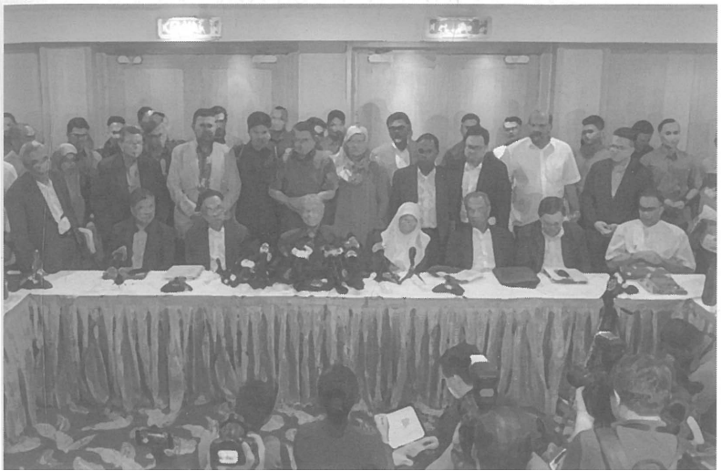
MESYUARAT TERAKHIR 21 Februari 2020