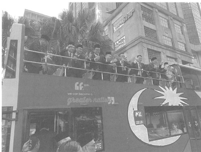
Bas yang membawa rombongan ahli-ahli Parlimen PKR ke Istana Negara.

Laporan yang berlegar selepas itu mengatakan bahawa Anwar mendapat sokongan daripada lebih 92 ahli Parlimen dari PKR (39 undi), Amanah (11 undi) dan DAP (42 undi). Difahamkan bahawa beliau juga memperoleh sokongan daripada beberapa ahli Parlimen dari luar PH dengan jumlah keseluruhan sekitar 107 undi. Sokongan kepada Tun Mahathir merosot kepada sekitar 60 ahli Parlimen sahaja, berkemungkinan terdiri daripada wakil dari Bersatu (25 undi), kumpulan Azmin (11 undi), GPS (19 undi), dan Warisan (9 undi). Beliau kehilangan sokongan daripada Pas dan Umno kerana BN dan MN dikatakan tidak menamakan calon Perdana Menteri, sebaliknya memohon agar Dewan Rakyat dibubarkan. Seperti yang kita semua kenal, Tun Mahathir sekali lagi menyalahkan Anwar di atas keputusan yang kucar-kacir ini dan menghina Anwar sebagai “gila-gila mahu menjadi Perdana