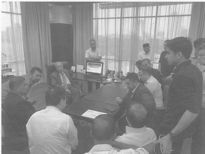
Pertemuan pemimpin-pemimpin PH bersama Tun Mahathir pada 29 Februari 2020 di pejabat Yayasan Albukhary.

PH sehingga komunikasi antara dua pihak telah terputus, Tun Mahathir kekal dengan prinsip beliau untuk tidak menerima pemimpin yang terpalit dengan kes jenayah, dan paling penting adalah propaganda bahawa Anwar terlalu ghairah untuk menjadi Perdana Menteri adalah meleset sama sekali. Sebaliknya beliau sekali lagi mendahulukan agenda reformasi negara berbanding perebutan kuasa dengan memberi laluan kepada Tun Mahathir untuk mengembalikan semula mandat rakyat yang diberikan kepada PH dalam PRU-14, perkara yang sama dilakukan dalam mesyuarat Majlis Presiden PH pada malam 21 Februari 2020 yang lalu. Keutamaan pada waktu itu bukan lagi tentang peralihan kuasa Mahathir-Anwar, sebaliknya seluruh kekuatan PH perlu ditumpukan pada mempertahankan mandat rakyat dan menafikan rampasan kuasa PN.