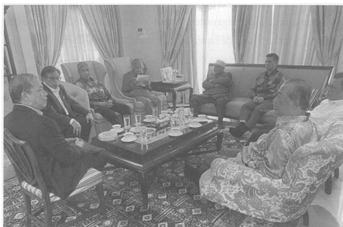
Ketua-ketua parti pembangkang berhimpun di kediaman Tun Mahathir pada 23 Februari 2020.

Hasil daripada mesyuarat ini, secara dasarnya Bersatu telah memutuskan untuk keluar daripada Pakatan Harapan, selepas hampir 2 tahun 11 bulan menyertai gabungan ini sejak 14 Mac 2017. 45