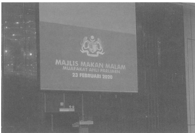
Latar belakang majlis makan malam di Hotel Sheraton.

momentum percaturan politik dan mengikat persetujuan ahli-ahli Parlimen tertentu sebelum berlaku counter offer dari pihak lain 51 .