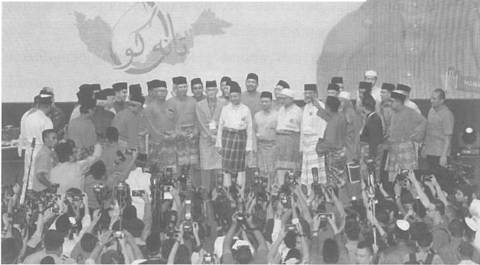
Tun Mahathir dikelilingi oleh pemimpin-pemimpin pembangkang di atas pentas.

dan menyelit di atas pentas bersama wakil-wakil Umno dan Pas, sehingga mengundang kritikan ahli-ahlinya sendiri kerana tidak selari dengan naratif anti-perkauman yang sering disyarahkan oleh beliau sejak sekian lama. Anwar sebagai Presiden PKR tidak hadir kerana menurutnya, jemputan diberikan pada saat-saat terakhir dan beliau sedang berada di kawasan Parlimennya di Port Dickson. Malangnya, dengan lambakan cadangan dan tuntutan yang diisytiharkan sebagai resolusi kongres, penganjuran kongres ini telah memberi gambaran negatif bahawa kerajaan PH telah mengabaikan nasib orang Melayu. Resolusi-resolusi ini dilihat memerangkap kerajaan PH sendiri, kerana sebahagiannya dari segi politik agak sukar untuk dipenuhi. Antaranya ialah memansuhkan sekolah vernakular, penjawatan Menteri Kanan (seperti Kewangan, Pendidikan, Pertahanan, Dalam Negeri) dari kalangan orang Islam termasuk Peguam Negara, Ketua Hakim Negara, Ketua Setiausaha