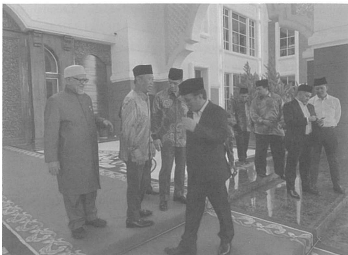
Ketua parti-parti politik tiba di Istana Negara pada 29 Februari 2020 untuk menghadap Seri Paduka Baginda Yang di-Pertuan Agong.

Keputusan yang ditunggu-tunggu dari Istana Negara akhirnya diumumkan sekitar pukul 4.00 petang, di mana YDP Agong masih belum dapat memutuskan mana-mana Ahli Parlimen yang mempunyai sokongan majoriti untuk dilantik sebagai Perdana Menteri. Justeru, kaedah kedua telah dilaksanakan iaitu Seri Paduka Baginda memanggil semua ketua parti-parti politik menghadap ke Istana Negara pada 29 Februari 2020 untuk mengemukakan nama calon Perdana Menteri yang telah dipersetujui oleh parti masing-masing 87 . Persefahaman yang dicapai antara Bersatu, BN dan MN pada petang itu telah memberi gambaran bahawa kemelut politik negara mungkin akan berakhir dalam masa terdekat.