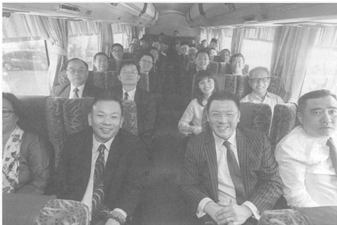
Bas yang membawa rombongan ahli-ahli Parlimen DAP ke Istana Negara.

Mahathir memberi isyarat bahawa kerajaan yang mahu dibentuk oleh beliau perlu melibatkan semua pihak termasuk DAP, mereka telah menarik semula sokongan kepada Tun Mahathir dan menegaskan bahawa Dewan Rakyat perlu dibubarkan segera bagi mendapatkan mandat baru daripada rakyat. Turut hadir dalam sidang media tersebut ialah wakil dari parti MCA, MIC dan PBRS, justeru pendirian ini dianggap sebagai pendirian rasmi BN dan Muafakat Nasional (MN). Dipercayai bahawa pendirian yang sama telah dipersembahkan kepada YDP Agong semasa sesi temu duga secara perseorangan di Istana Negara. Keputusan ini memperlihatkan tahap keyakinan BN dan MN terhadap formula 'penyatuan ummah' mereka yang telah disusun sejak beberapa bulan lalu.