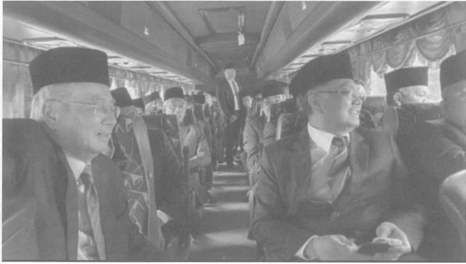
Bas yang membawa rombongan ahli-ahli Parlimen Umno ke Istana Negara.