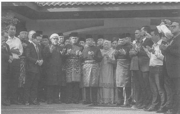
Ahli Parlimen Pas, Umno, Bersatu, GPS dan lain-lain berkumpul di kediaman Muhyiddin sebelum bergerak ke Istana Negara.

Meskipun terdapat pelbagai pendapat yang mengatakan bahawa kerajaan ini tidak sah, tidak mendapat mandat dari rakyat, dan tidak mendapat sokongan majoriti Ahli Parlimen, namun harus diakui bahawa pelantikan ini sah dari sisi perlembagaan. Ini kerana pelantikan Muhyiddin dibuat berdasarkan budi bicara YDP Agong yang selari dengan Perkara 40(2)(a) dan Perkara 43(2)(a) Perlembagaan Persekutuan. Proses pemilihan Muhyiddin dianggap sama dengan proses pemilihan yang berlaku setiap kali selesai pilihan raya umum, di mana hanya ketua parti yang mempunyai wakil dalam Dewan Rakyat dan menikmati sokongan majoriti akan dipanggil mengadap ke Istana Negara untuk proses pengesahan dan pencalonan Perdana Menteri.