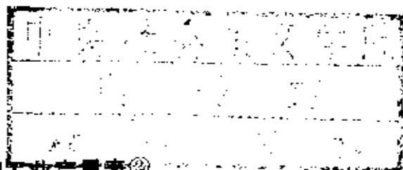
表一 1939~1943 年美国基础工业产量表 ②