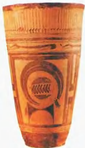
苏萨文化 I 的彩陶瓶