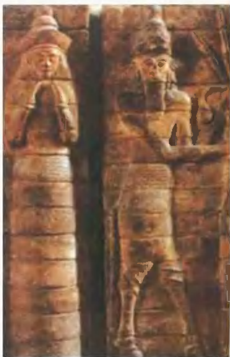
中埃兰苏萨城 邦的保护神印舒希 纳克