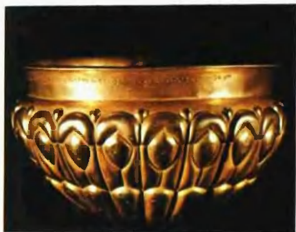
刻有薛西斯名字的金碗