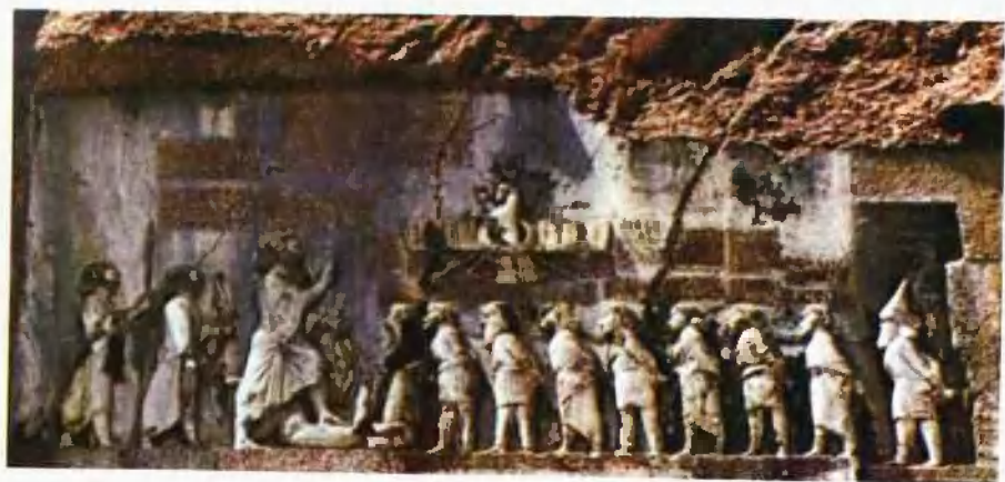
大流士一世的贝希斯敦浮雕图