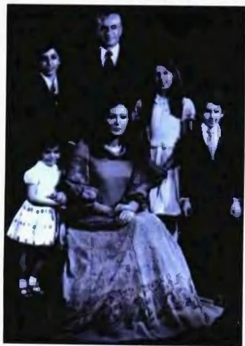
1979年流亡之 前的巴列维全家