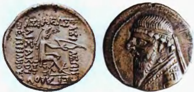
安息帝国密特里达特斯二世时期的银币