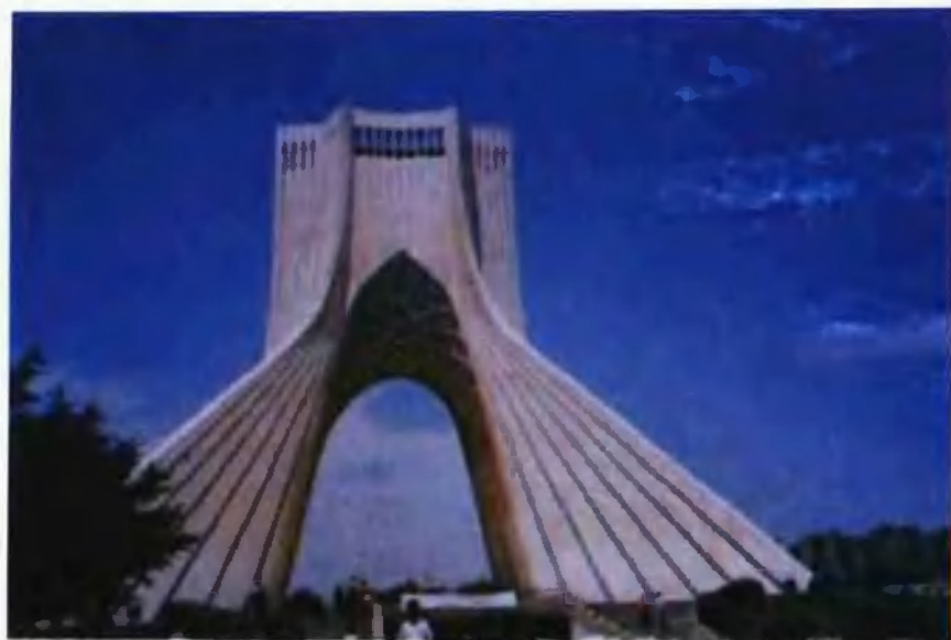
伊朗首都德黑兰的自由纪念塔