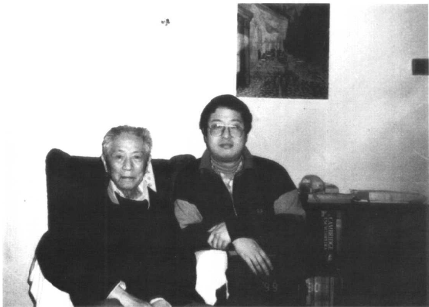
1999年1月与外孙丰丰在里兹寓所