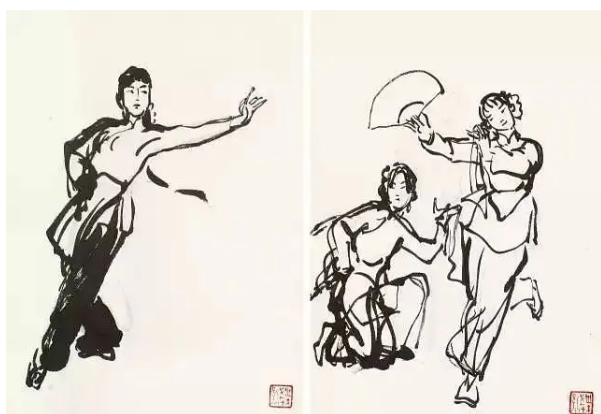
叶浅予《汉族舞蹈两帧》