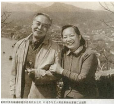
叶浅予与王人美于1956

叶浅予（1907年3月31日－1995年5月8日），原名叶纶绮，笔名初萌、性天等，性别：男，1907年3月31日出生于浙江省桐庐县。中国现代漫画家，画家。配偶：罗彩云，戴爱莲，王人美。1995年5月8日逝世于中华人民共和国北京市，享年88岁。曾任中央美术学院教授、中国美术家协会会员、副主席。