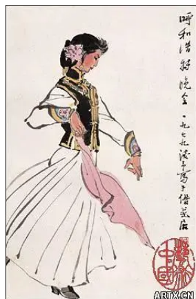
叶浅予《呼和浩特晚会》