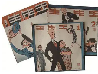
叶浅予漫画作品《王先生》