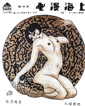
第9期封面《蛇与妇人》