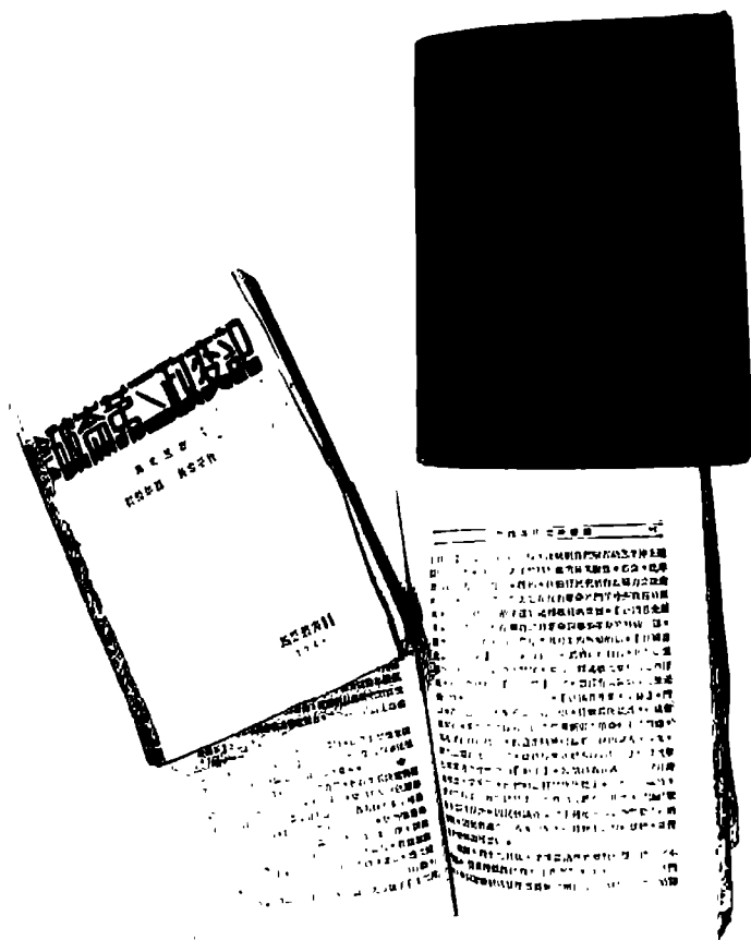
1930年上海江南书店和1940年延安解放社出版的 《路易·波拿巴的雾月十八日》中译本