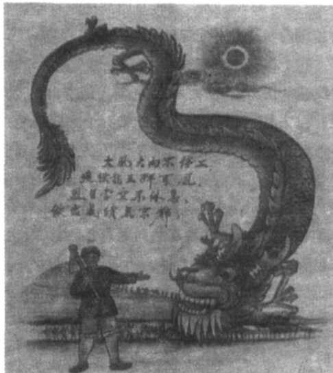
▲「大跃进」时期的农民画——定使龙王拜下风