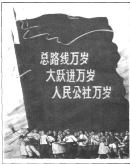
「大跃进」时期的宣传画

在八大二次会议上，当时上海的党政一把手柯庆施作了一个关于文化“大跃进”的发言，其中在讲到15年后的中国的文艺时说：到那时，新的文化艺术生活，将成为工人、农民生活中的家常便饭，不但有了更好地为工农兵服务的文学艺术，而且工农兵自己也能更普遍、更高明地动手创造文学艺术，每个厂矿、农村都有图书馆、画报，都有自己的李白、鲁迅和聂耳，自己的梅兰芳和郭兰英。人们不但可以经常看到电影，而且可以从电视里学科学、学先进经验，同先