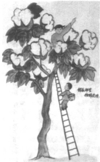
▲「大跃进」时期的农民画——摘棉花

有壁画1-5幅。”“编者按”称赞道：“邳县的农民壁画运动是群众美术活动中的一颗‘卫星’。”“这是党的总路线的伟大作用在美术工作中的具体体现，是我国革命