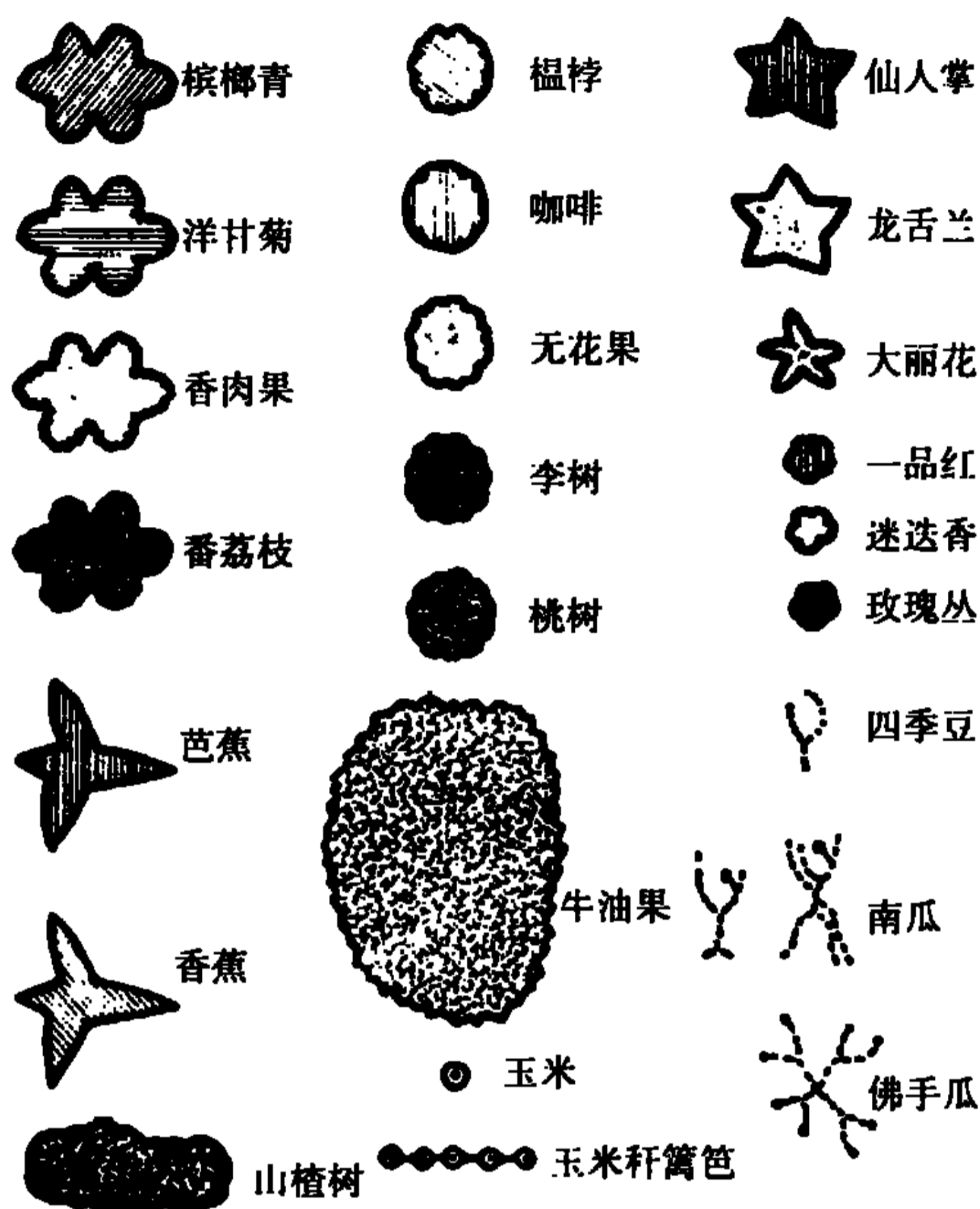
(b) 植物类别的具体图示