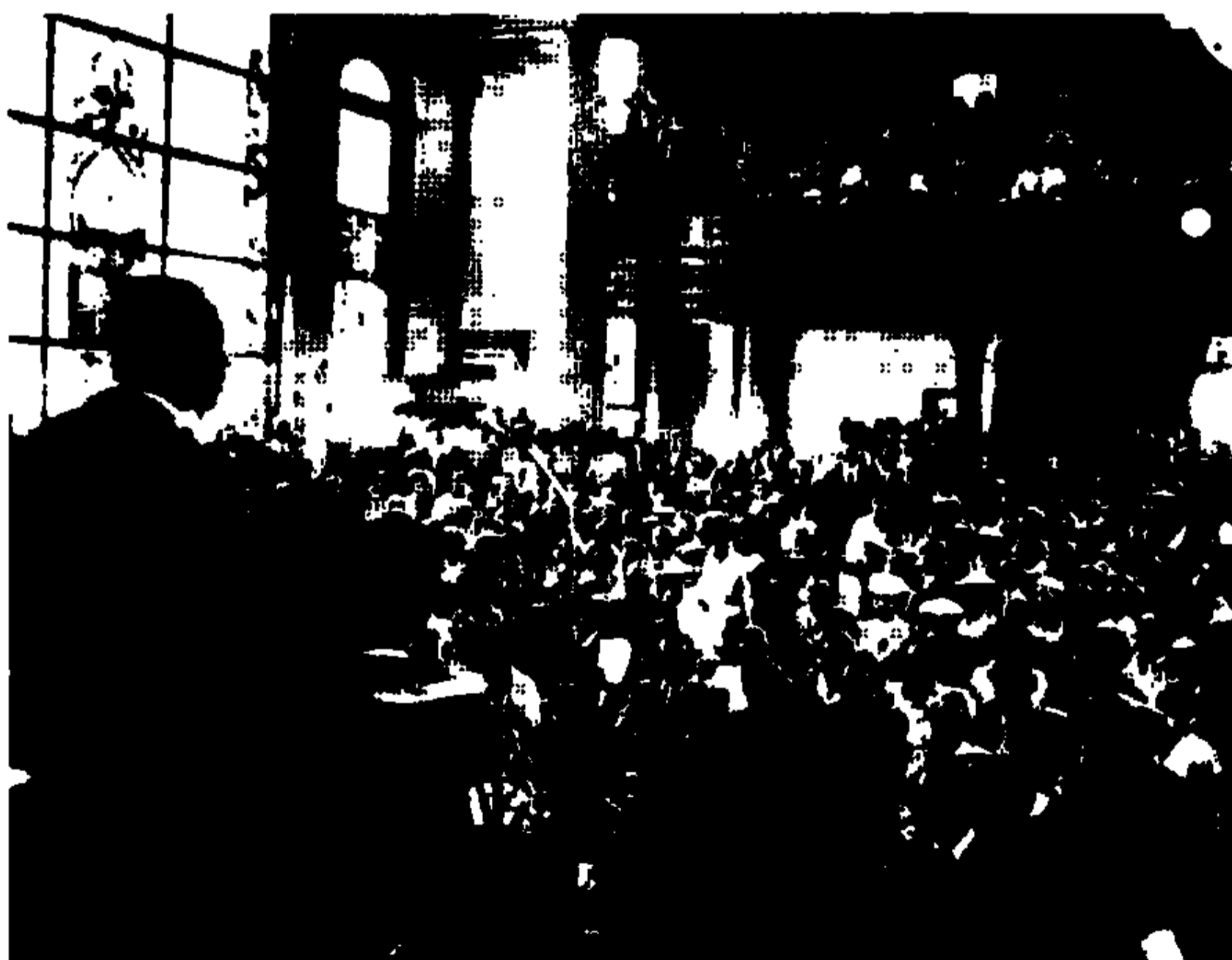
图1 马丁·路德·金的最后一次布道 (1968年4月3日摄于田纳西州孟菲斯)

个时代，我的朋友们，人们不能忍受被抛进耻辱的深渊，经历无尽、绝望的冰冷，”他宣告，“在这个时代，人民不能忍受从七月艳阳般的生活中被拖走，然后被弃置于隆冬的阿尔卑斯山的刺骨寒风里。在这个——”金想再讲一层，但是听众的呼喊已经淹没了她。这吼声，也不知是因被他触碰神经而爆发的回响，还是对演讲人的滔滔雄论的赞许。“我们会集在此——我们来，是因为我们已经不能忍受。”金重复道。 2