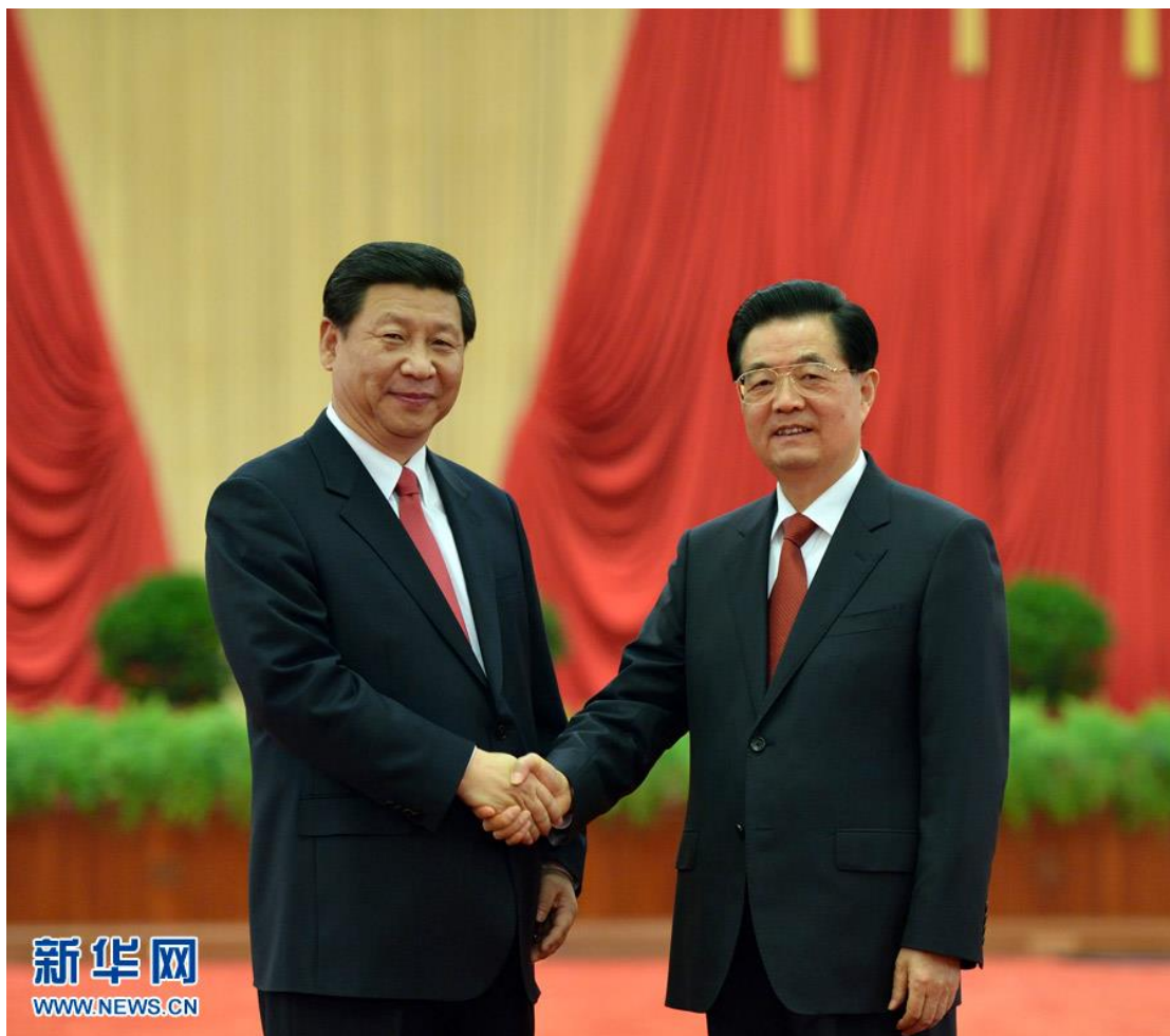
2012年11月15日，国家主席胡锦涛和新当选的中共中央总书记、中共中央军委主席习近平握手。