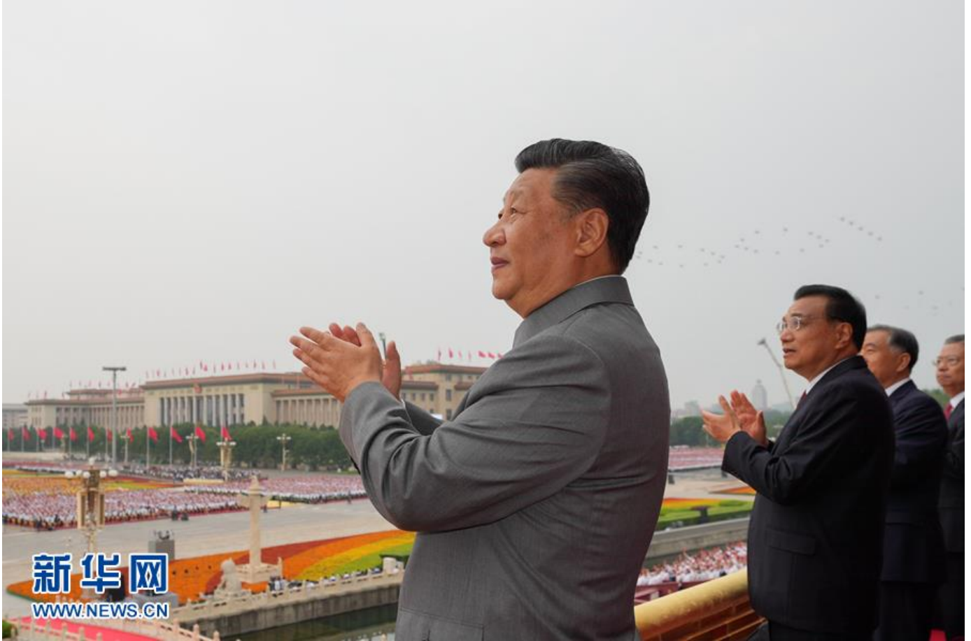
7月1日上午，庆祝中国共产党成立100周年大会在北京天安门广场隆重举行，这是习近平在天安门城楼上。