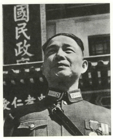
1943年偽國民政府「還都」三周年紀念日 慶典結束後,身着陸軍正裝出現在大禮堂 前的汪精衛。