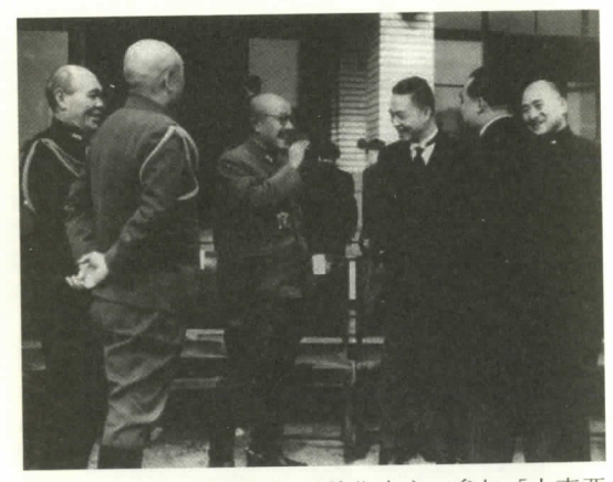
1942年12月,汪精衛(右三)前往東京,參加「大東亞 戰爭一周年紀念會」,會見日本內閣總理大臣東條英 機(左三)