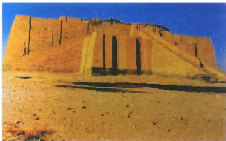
乌尔第三王朝时兴建、伊拉克保存最为完好的塔庙(该庙在 新巴比伦王国时曾扩建)