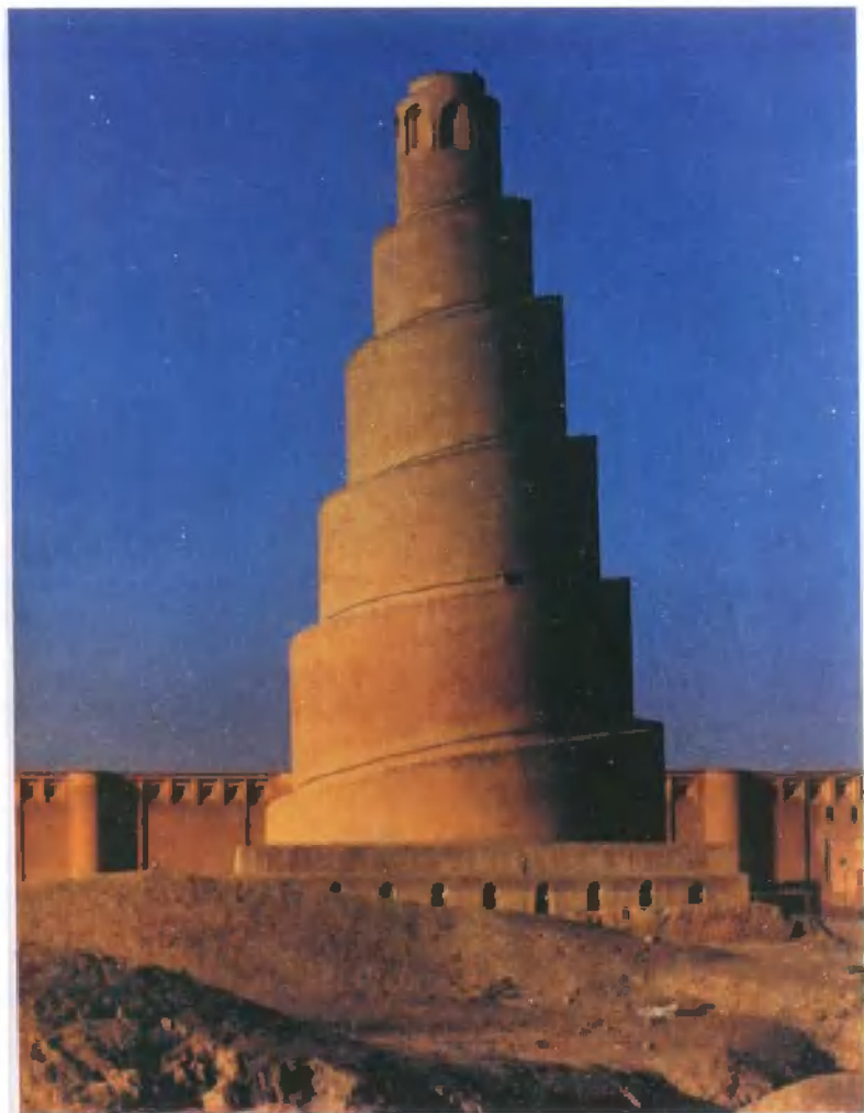
阿拔斯王朝时兴建于萨马拉的转塔(旋转型宣礼塔)