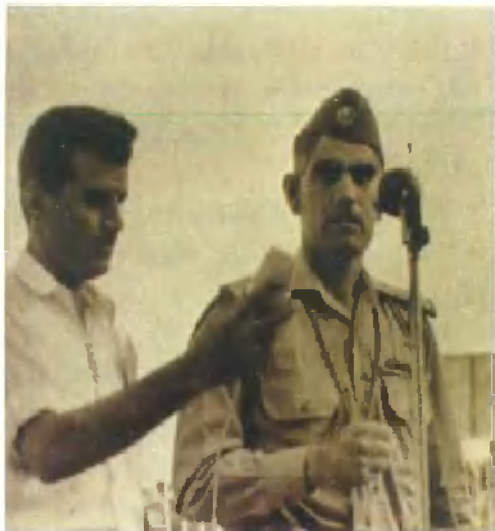
1958年自由军官 组织反君主革命的领袖 卡塞姆将军(右)