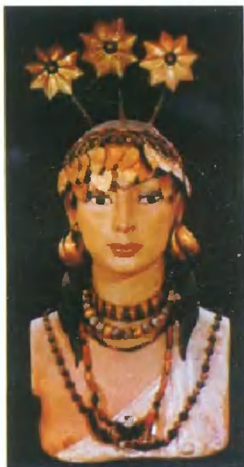
早王朝时期乌尔王陵 中出土后修复的妇女头像 (头像戴有黄金、青金石 和光玉髓饰物)