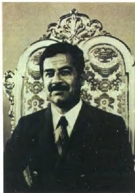
伊拉克总统萨达 姆·侯赛因(1964年)