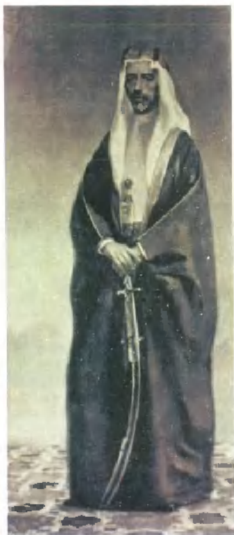
伊拉克王国的开 国君主费萨尔一世