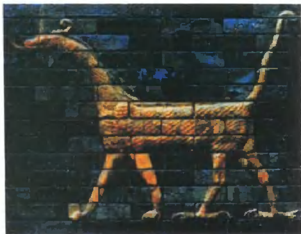
新巴比伦王国时期巴比伦城伊什塔尔门旁边的彩釉巴比伦龙