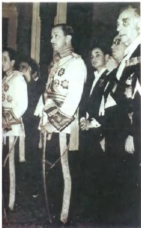
伊拉克王国的末代三 雄：国王费萨尔二世、王储 阿卜德 伊拉亲王和努里 赛义德(前排 自左至右)