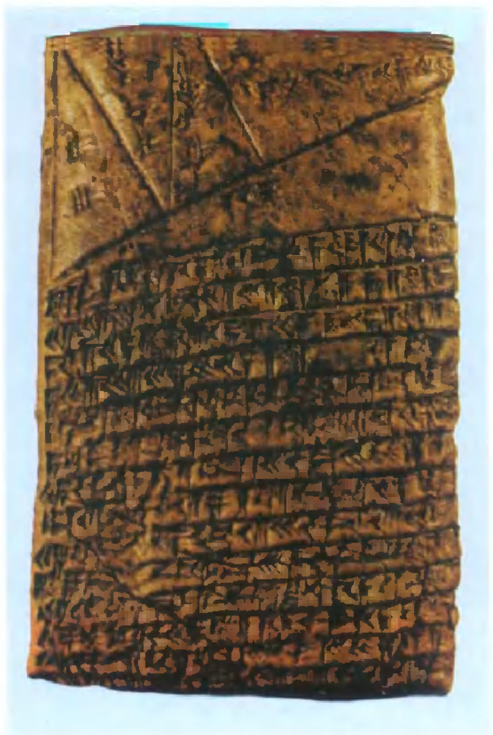
世界上最早的文字——两河流域的楔形文字泥板