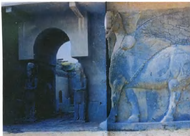
亚述帝国首都尼姆卢德皇宫守门的带翼石狮