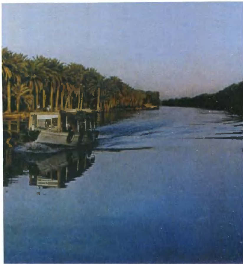
伊拉克南方大片的椰枣林