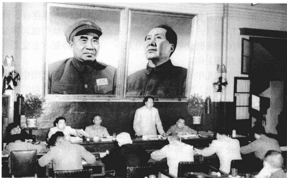
1950年6月毛泽东在中共七届三中全会上作报告