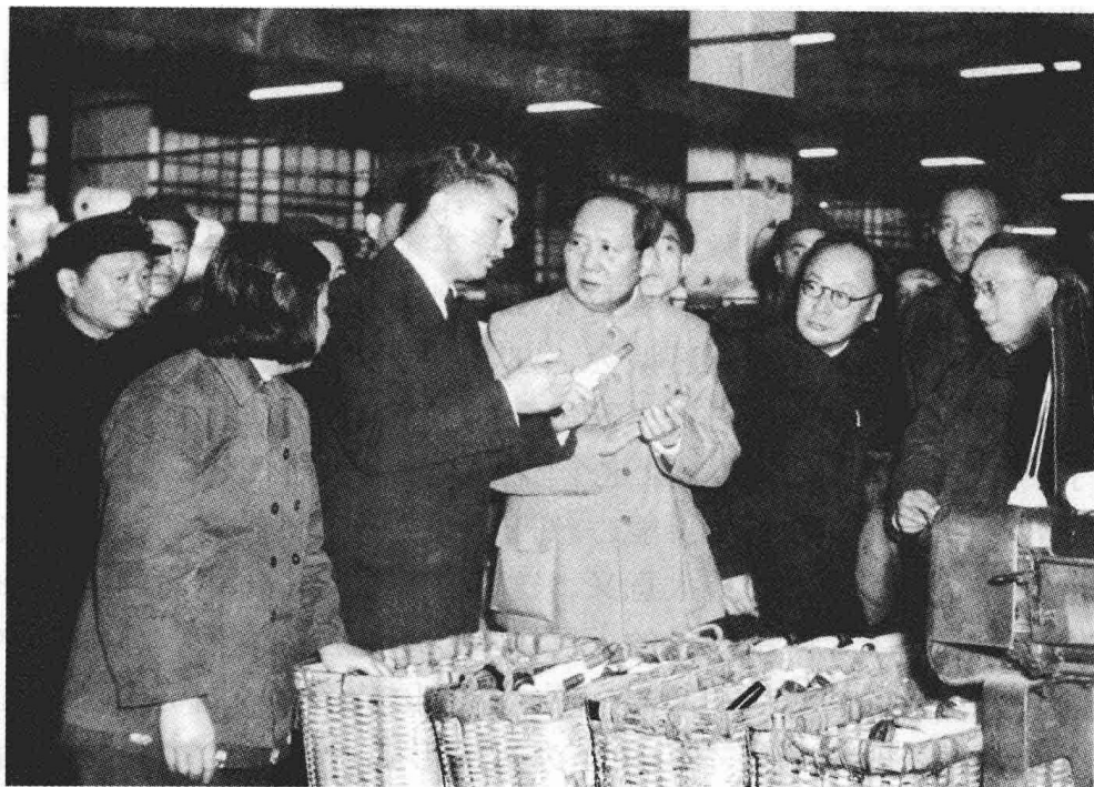
1956年1月毛泽东在陈毅、荣毅仁陪同下视察上海申新九厂