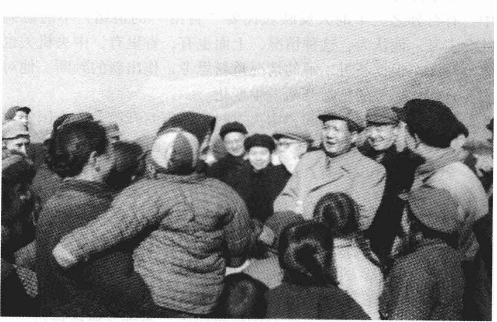
1955年毛泽东在南京郊区十月农业生产合作社视察