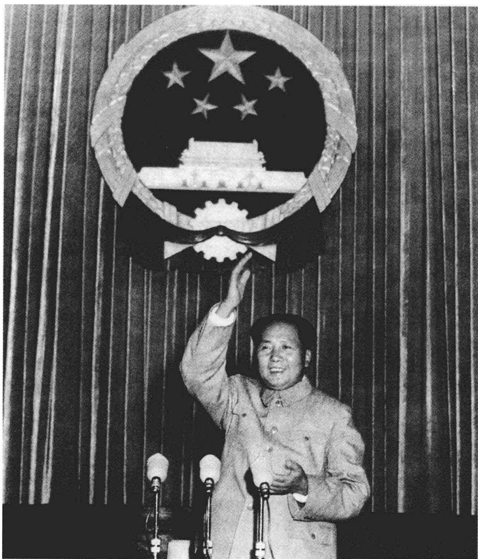
1954年9月15日毛泽东在一届全国人大一次会议开幕会上