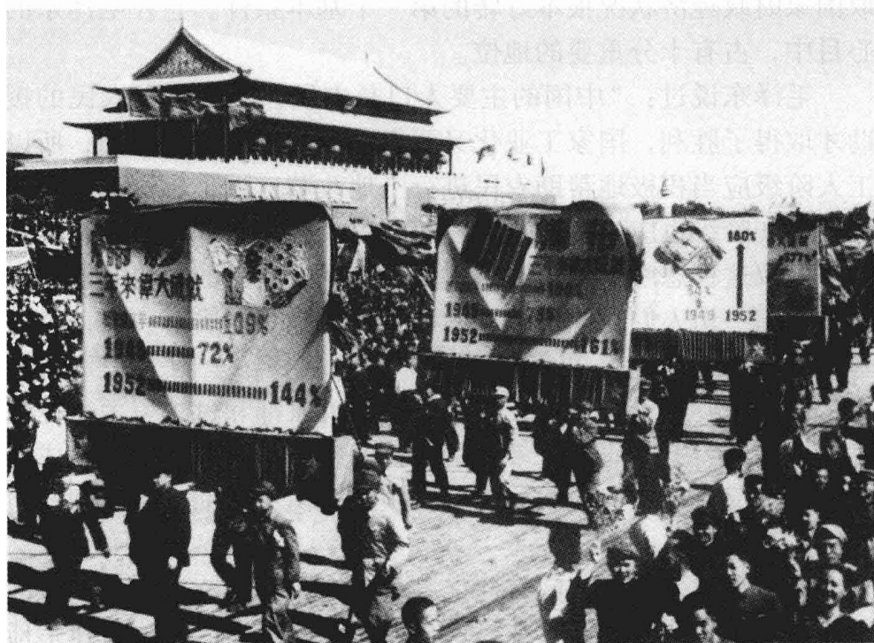
1952年首都各界群众庆祝国民经济恢复任务胜利完成