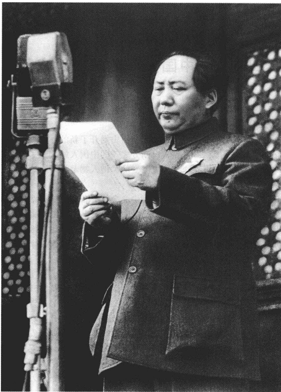
1949年10月1日毛泽东在开国大典上