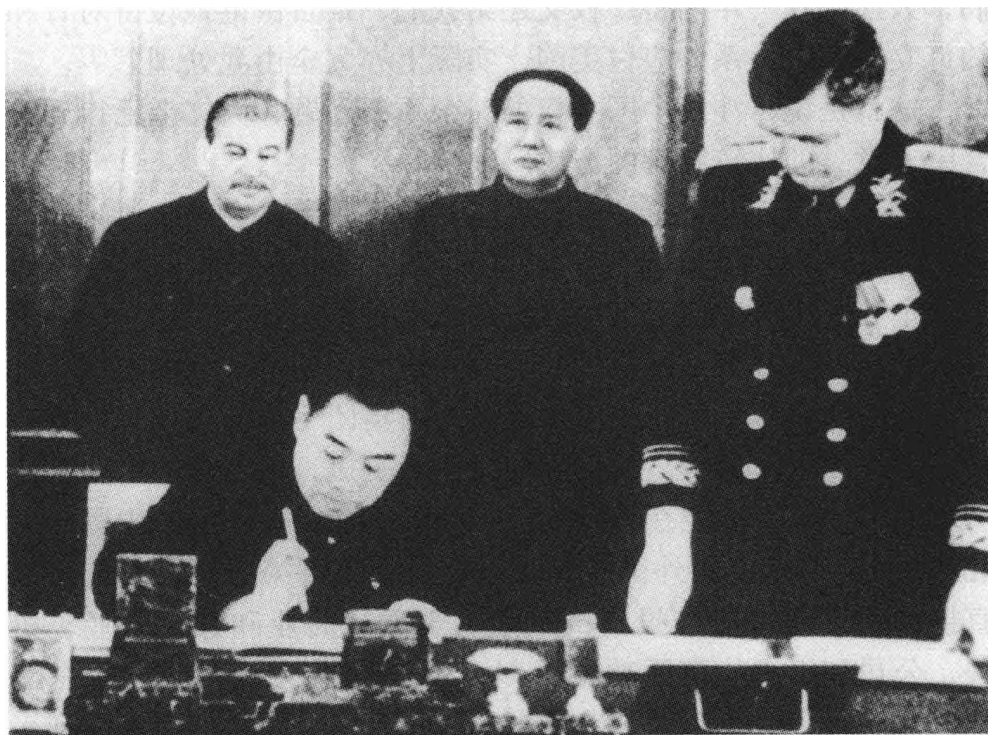
1950年2月14日毛泽东和斯大林在《中苏友好同盟互助条约》签字仪式上