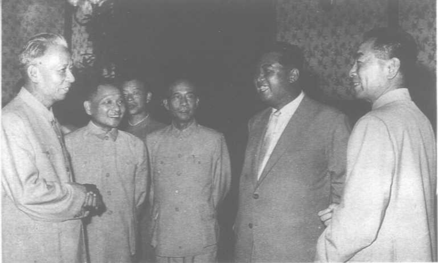
1961年7月11日中朝友好合作互助条约在北京签字后与刘少奇、邓小平、李富春等同金日成首相在一起。