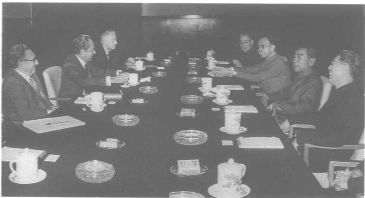
1972年2月28日在上海锦江饭店同美国总统尼克松举行第五次限制性会谈。会谈后双方签署了联合公报，即中美上海公报。