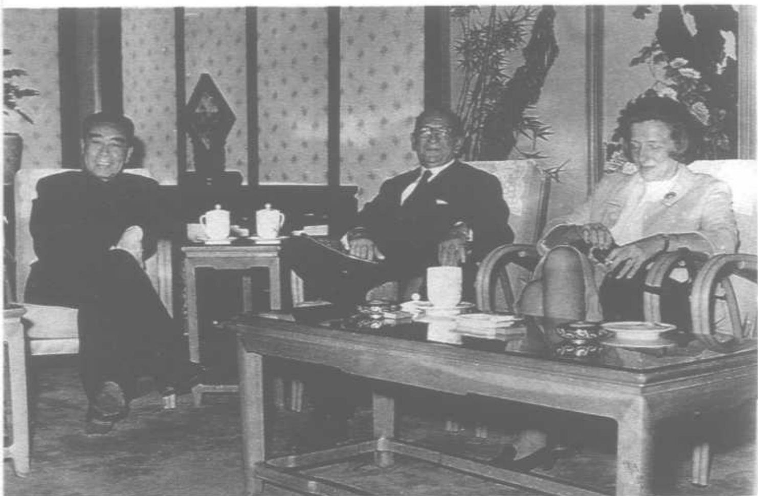
1963年10月在中南海西花厅会见戴高乐将军的代表、法国前总理埃德加·富尔，商谈两国建交问题。