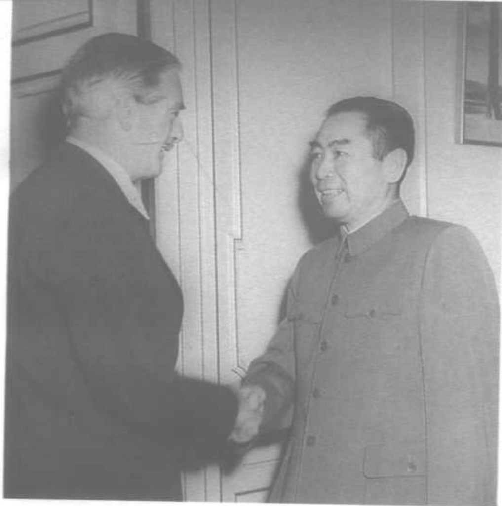
1954年5月27日在日内瓦住所接见英国外交大臣艾登。不久双方达成互设代办处的协议。