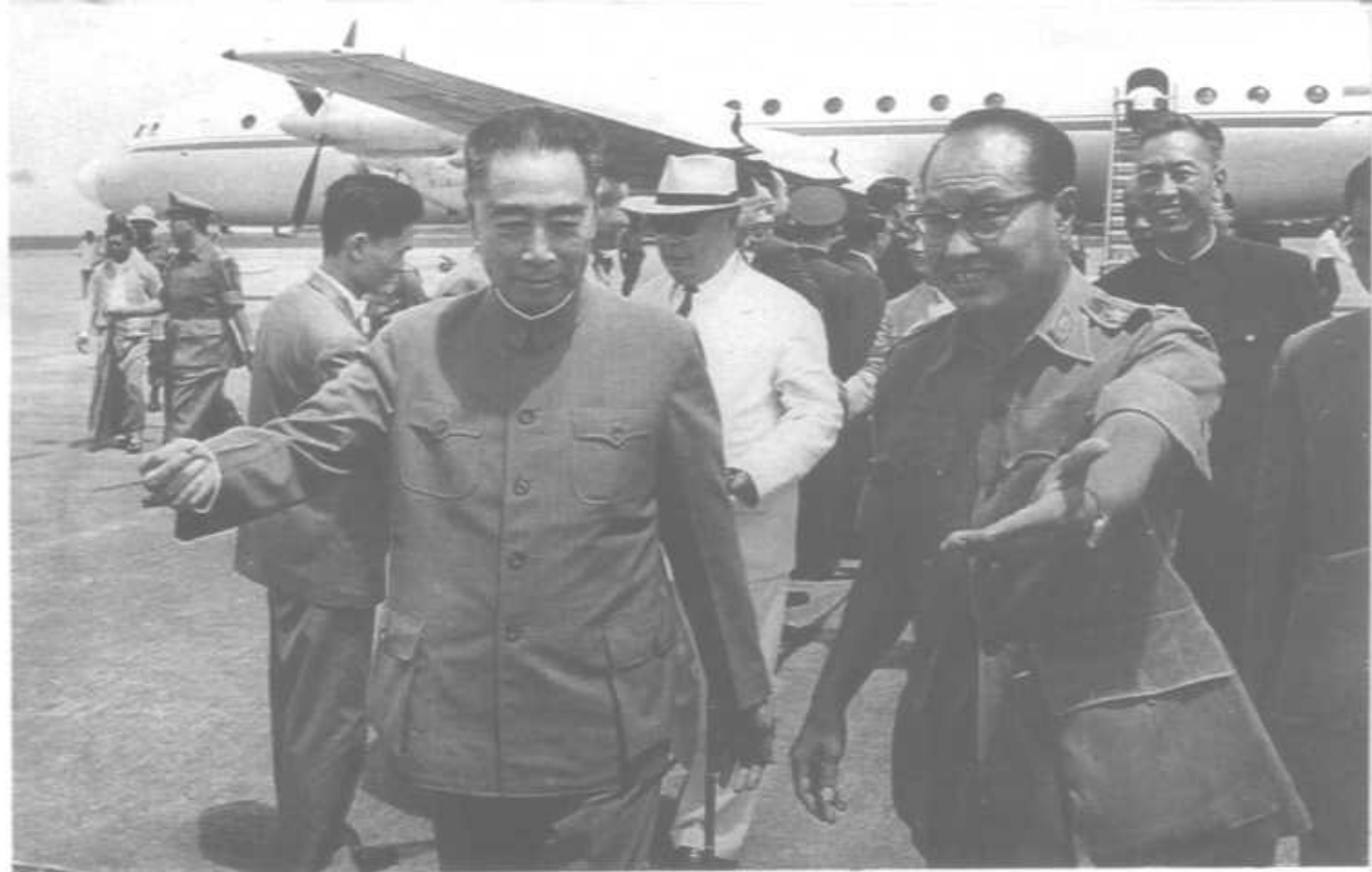
1964年7月10—11日和陈毅副总理访问缅甸受到缅甸联邦革命委员会主席奈温将军的欢迎。