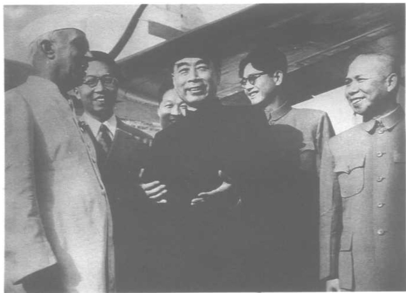
1954年6月25日访问印度在新德里机场受到尼赫鲁总理的欢迎。这次访问发表的联合声明重申了指导两国关系的五项原则，并倡议将这些原则作为国际关系的准则。