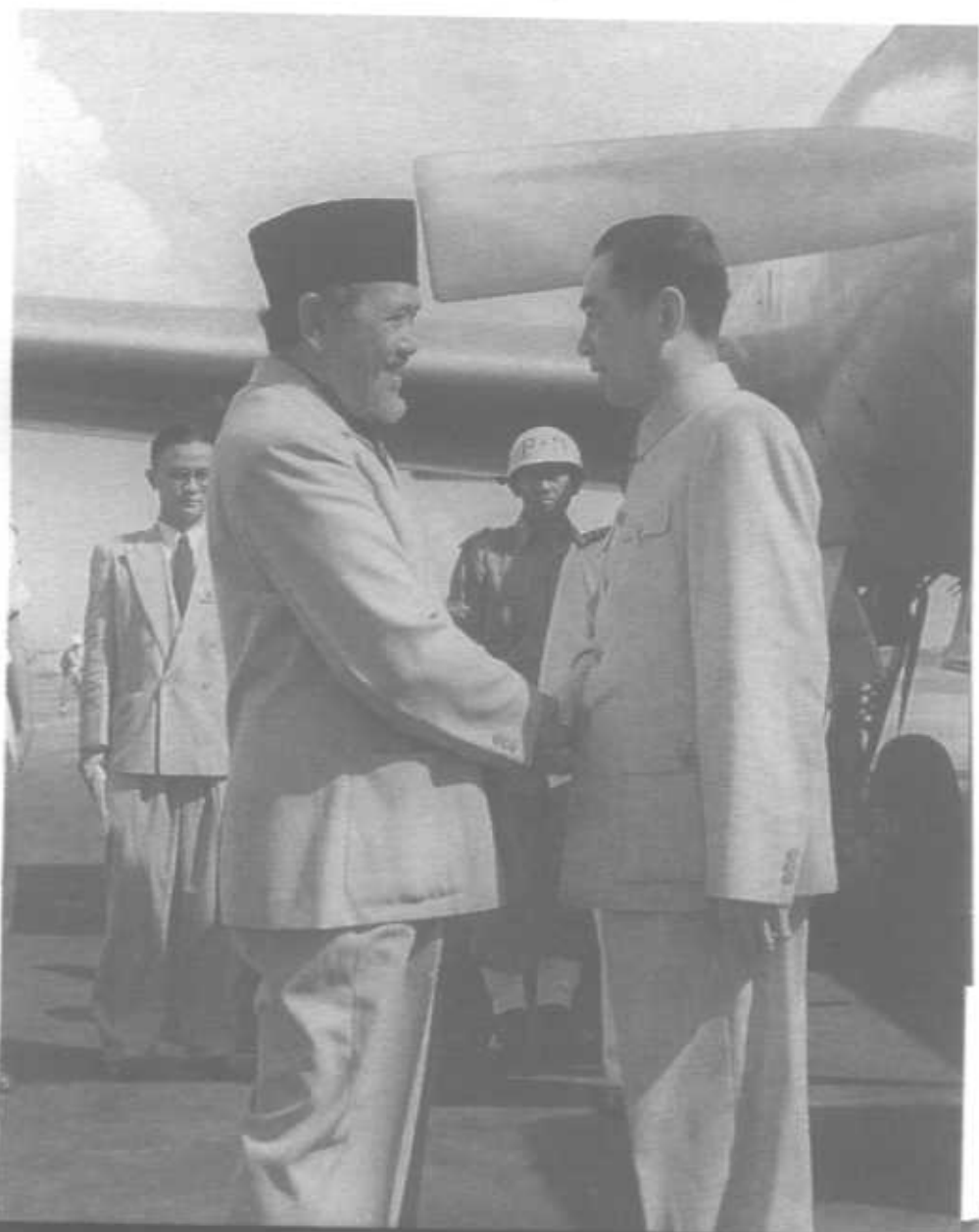
1955年4月26日访问印度尼西亚在雅加达机场受到印尼总理沙斯特罗阿米佐约的欢迎。