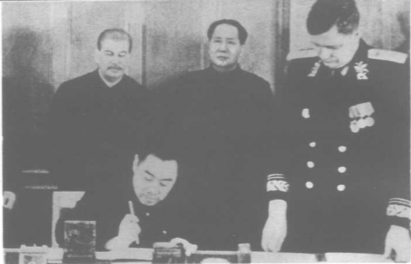
1950年2月14日在中苏友好同盟互助条约上签字。