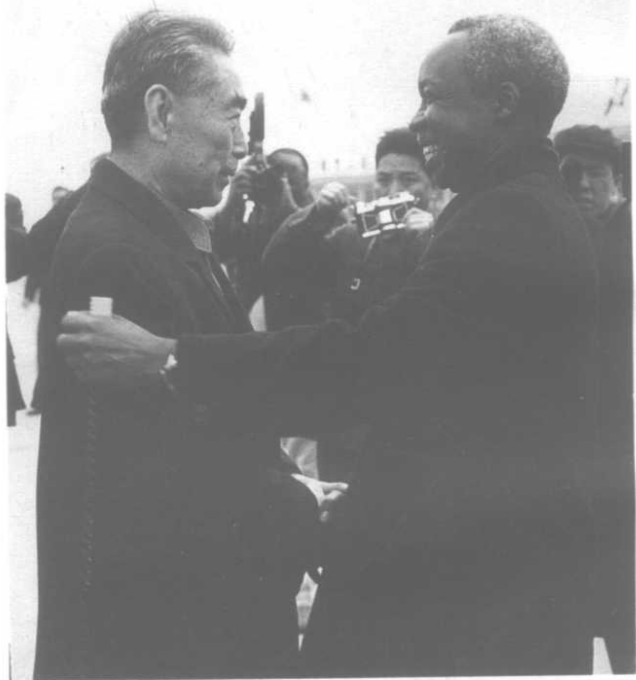
1974年3月24日在机场欢迎坦桑尼亚总统 尼雷尔来我国进行国事访问。