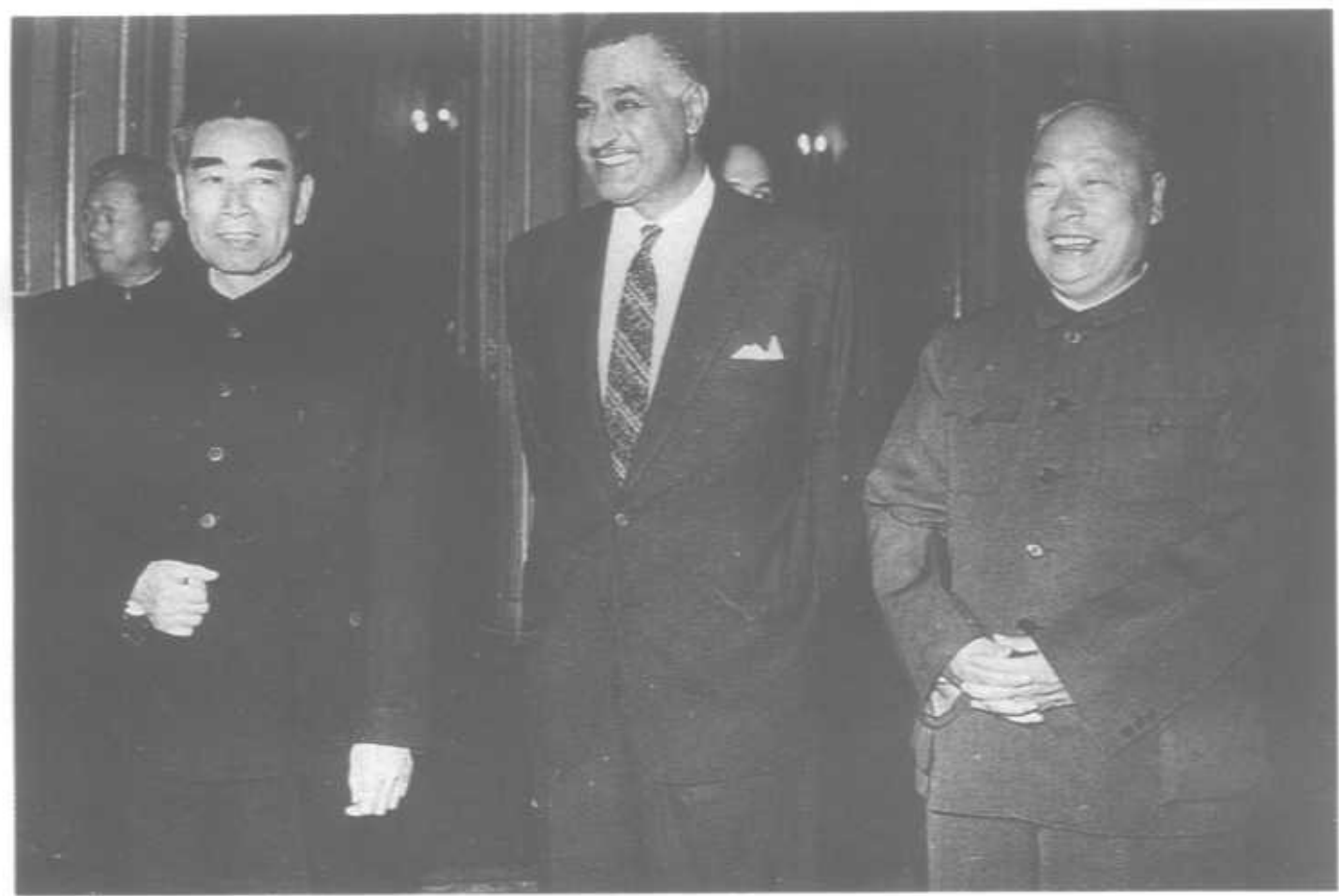
1963年12月14日和陈毅副总理访问阿联时出席纳赛尔总统举行的招待会。