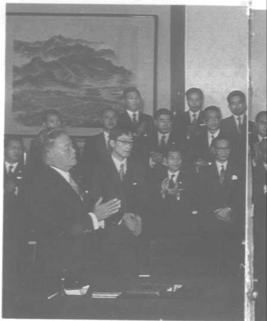
1972年9月29日和 田中角荣总理大臣在北京 签署中日建立外交关系 的联合声明。