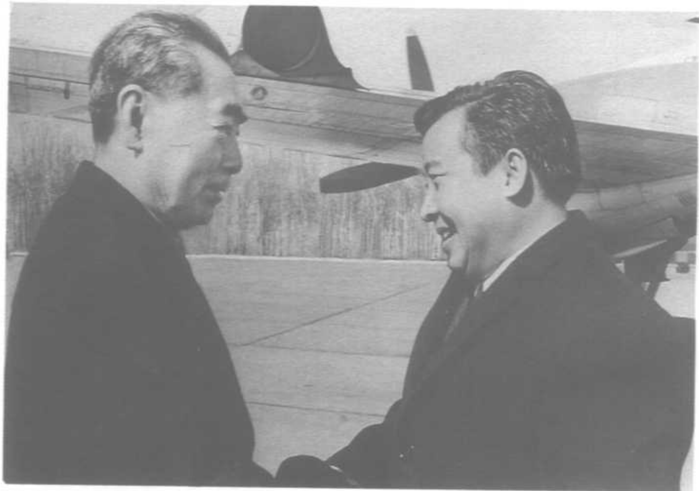
1970年3月19日在首都机场欢迎柬埔寨国家元首西哈努克亲王。