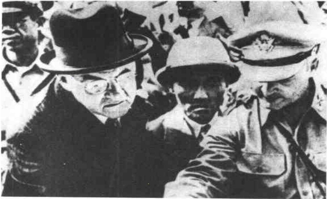
戰爭爆發前夕，杜勒斯（右三）與南韓國防部長申性模（右二）、美軍顧問團團長羅伯茨准將（右一）前往三八線視察。