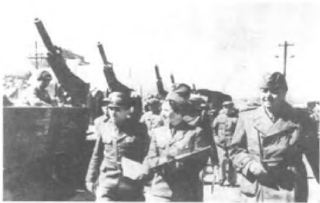
蘇軍代表向中國人民志願軍移交軍事援助裝備。