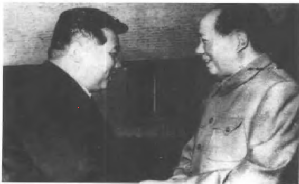
1951年6月初金日成訪問北京，與毛澤東就朝鮮戰爭問題進行商談。