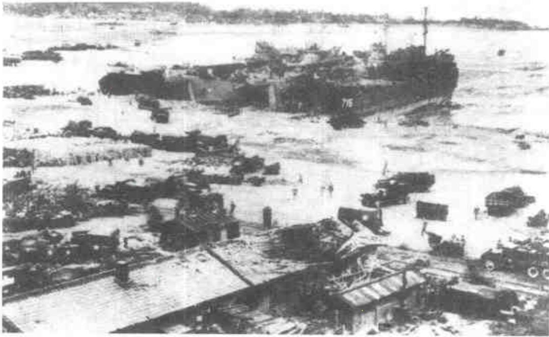
仁川登陸後，美國軍艦密蘇里號炮擊距西伯利亞邊境29英里的清津。