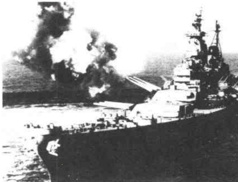
1950年9月15日·美國海軍陸戰隊第一師在仁川登陸一舉成功。