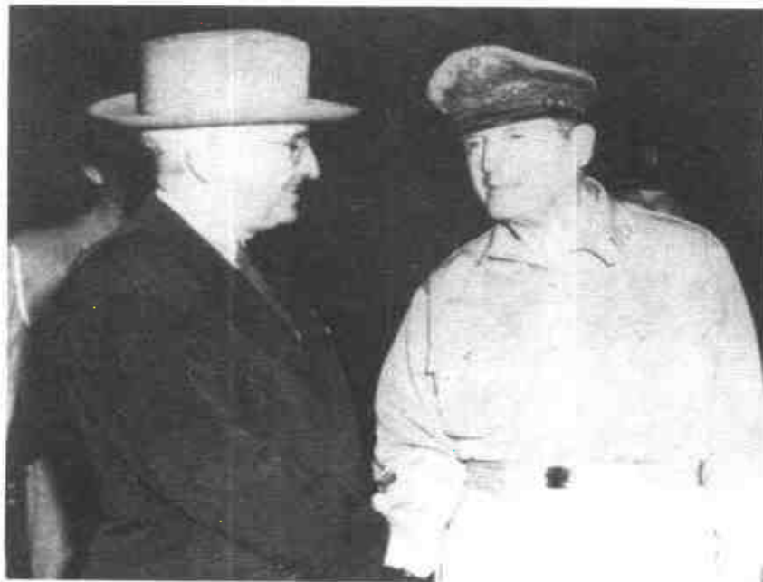
美軍越過三八線後，杜魯門在威克島會晤麥克阿瑟，商討下一步行動。