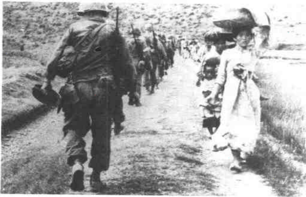
美國捲入戰爭後，先遣部隊迎著南逃的韓國婦女和兒童北進。