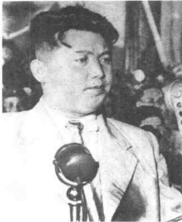
1950年7月8日·金日成發表廣播演說，號召朝鮮人民展開民族解放運動。