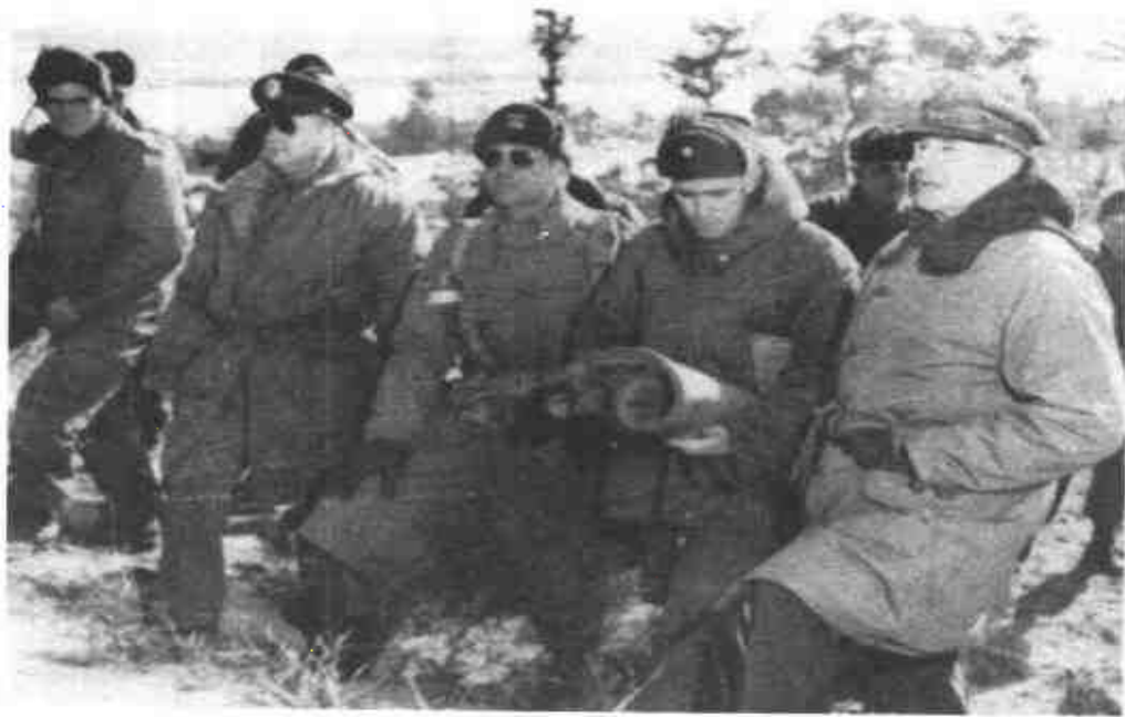
麥克阿瑟（右一）、李奇微（右三）和惠特尼（右四）等美軍高級將領視察前線。