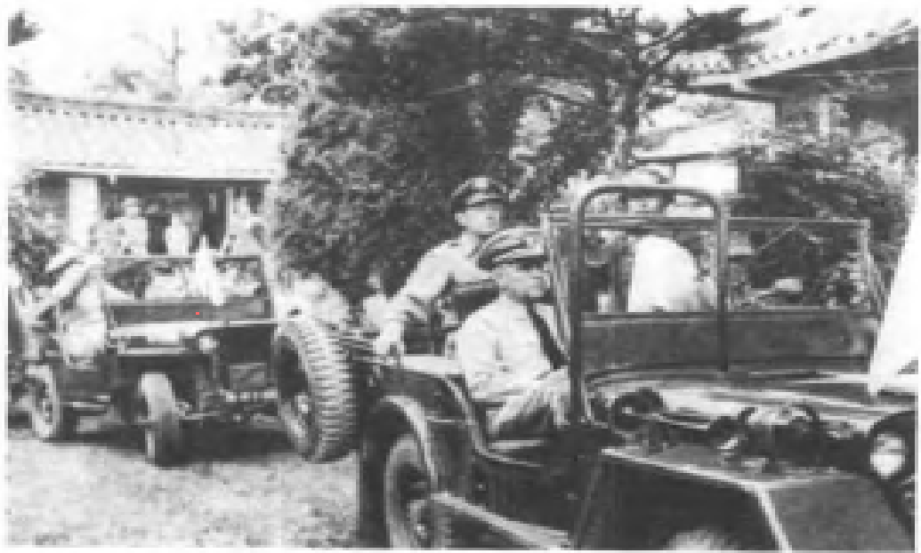
參加停戰談判的美軍代表。