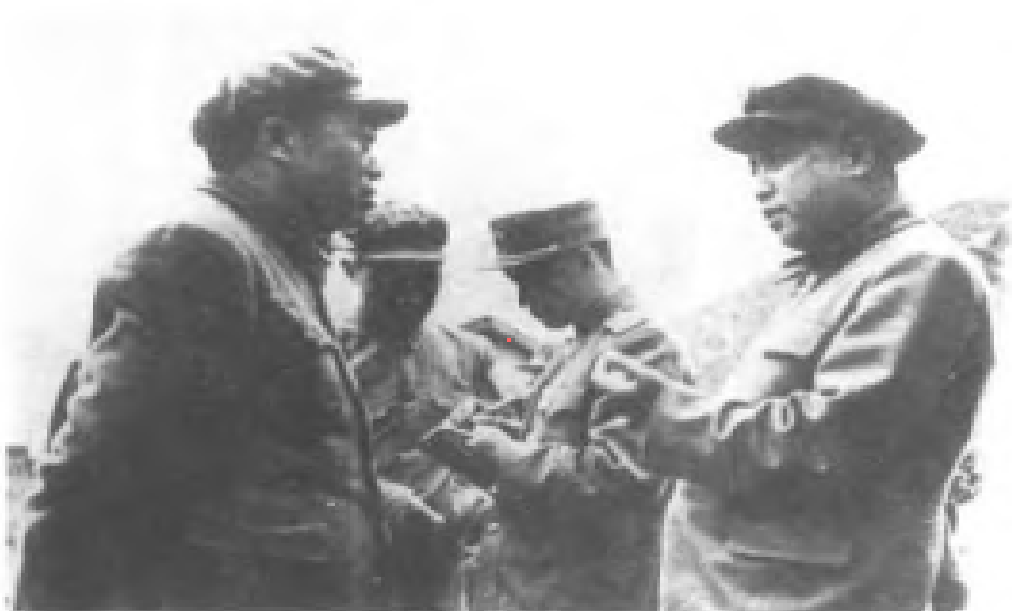
中國人民志願軍赴朝作戰，彭德懷與金日成在朝鮮戰場。