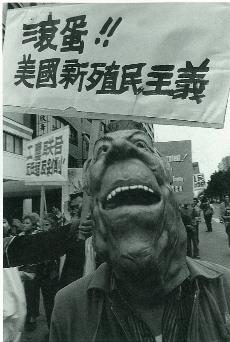
「台灣不是美國殖民地」是抗議活動的主題之一。

大關係。70年代末，美國轉而承認中共，台灣為了取得美國農業州參議員的支持，長年大量做政治性農產物輸入。最近又以平衡貿易為由，大量對台強硬輸入美國水果和肉類，並限制台灣稻米輸出。這一切，直接而尖銳地打擊了台灣農業和農民的生計。