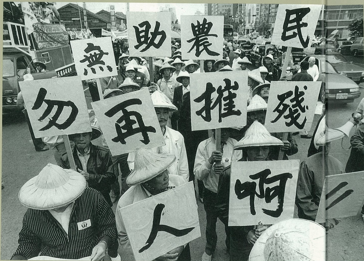
不當的農業政策，使得農民成為被推殘的對象

為了把台灣改造成一個和美國具有高度政治同質性的反共堡壘台灣，1950年韓戰爆發之後，美國對台灣給予自有它的目的和條件的「援助」。在農復會支援下進行的土地改革，和平地消滅了台灣的地主階級，解放了佃農，使台灣農村土地關係一夕間成為無數小資產階級獨立小農所有制。土地資本流向工業。第七艦隊封鎖海峽。內戰中國的民族分離因美國的介入而「國際化」，固定