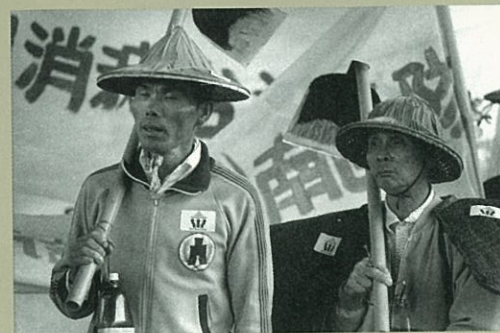
是誰逼使陷入困境的農民，走上街頭？