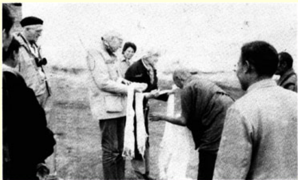
喇嘛向作者 夫妇献哈达