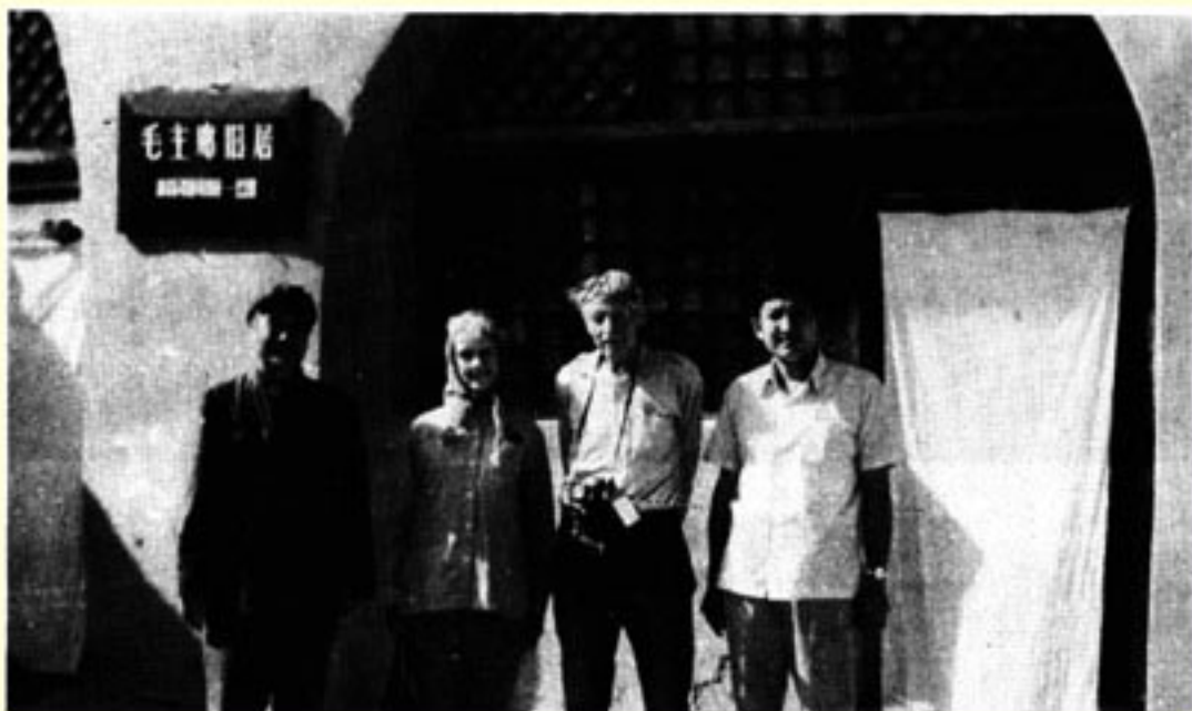
到达陕北，在毛主席旧居前合影。