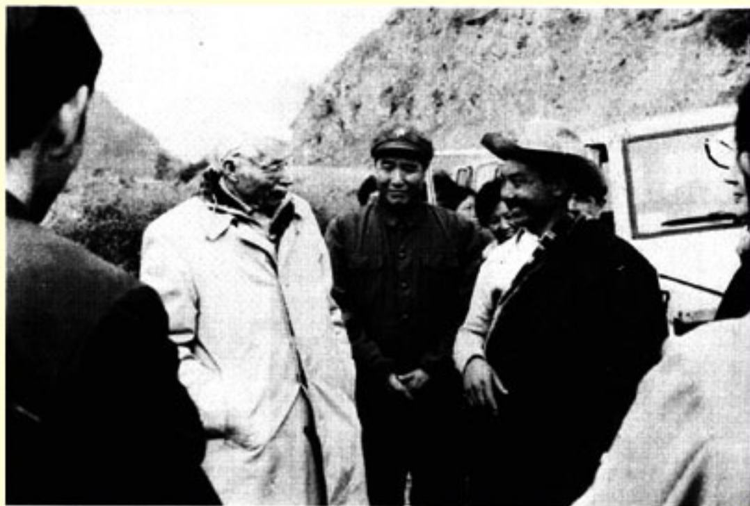
在若尔盖与藏族县长交谈。