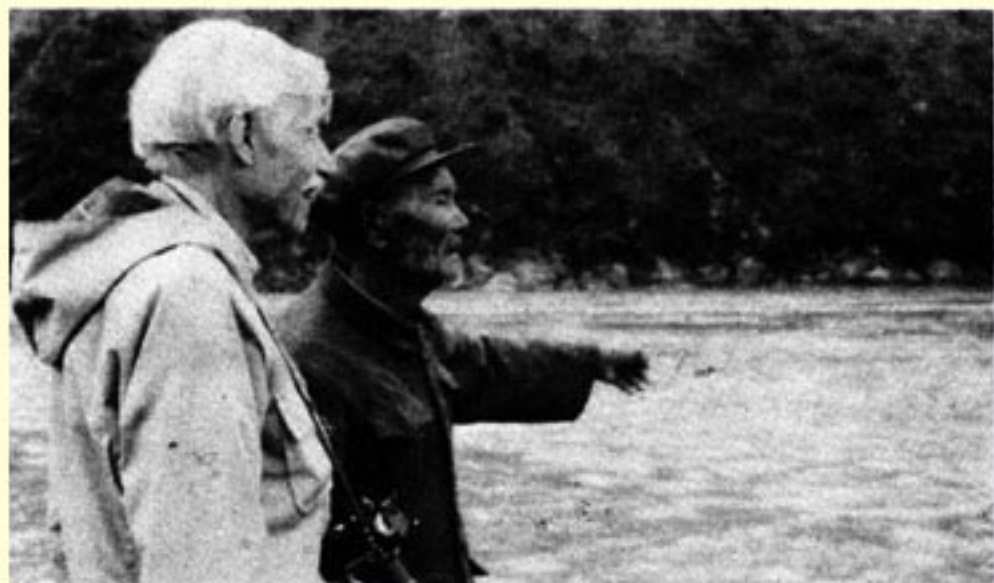
在安顺场同 老船工交谈。