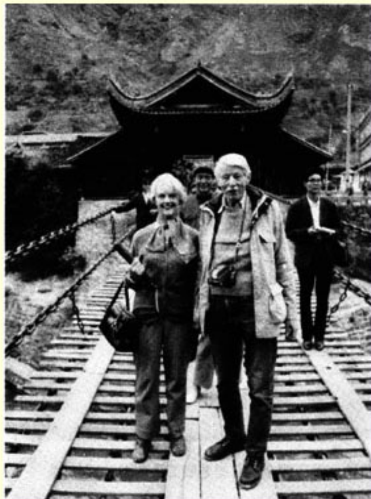
作者夫妇在 泸定桥上合影。