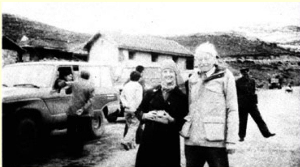
刚翻过白雪皑皑的折多山