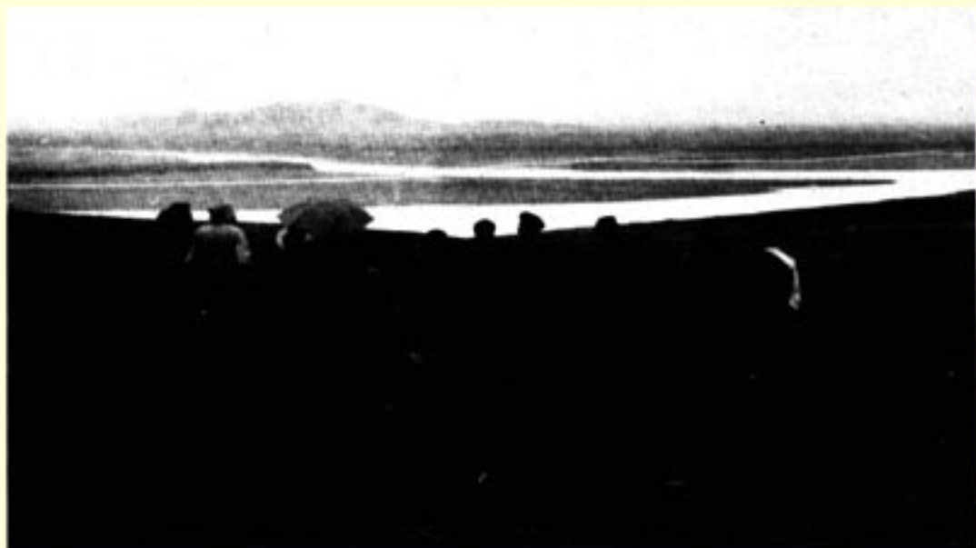
作者夫妇一行来到红军当年经过的黄河源头支流边。