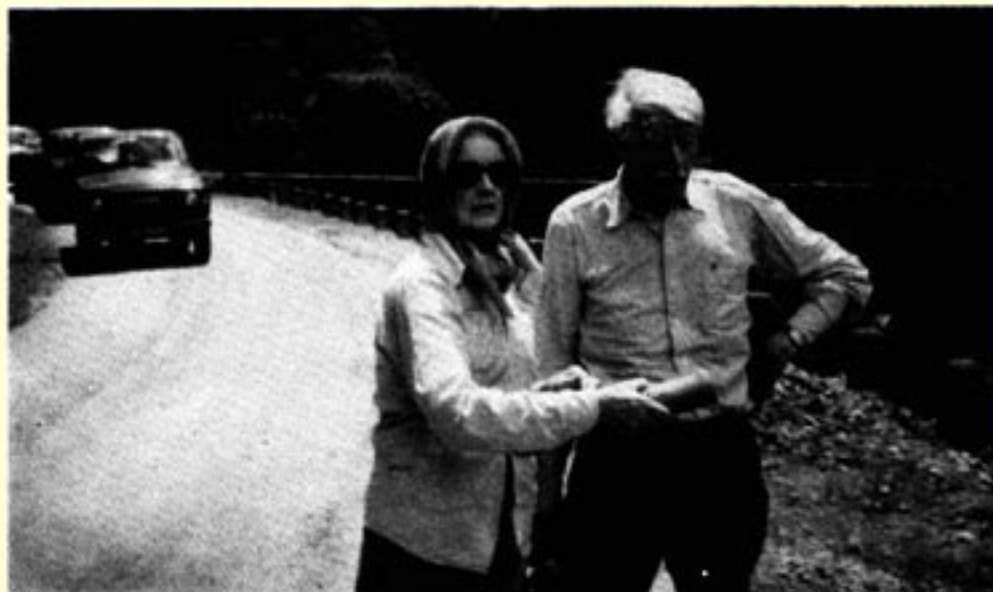
车至险处停下细观察。