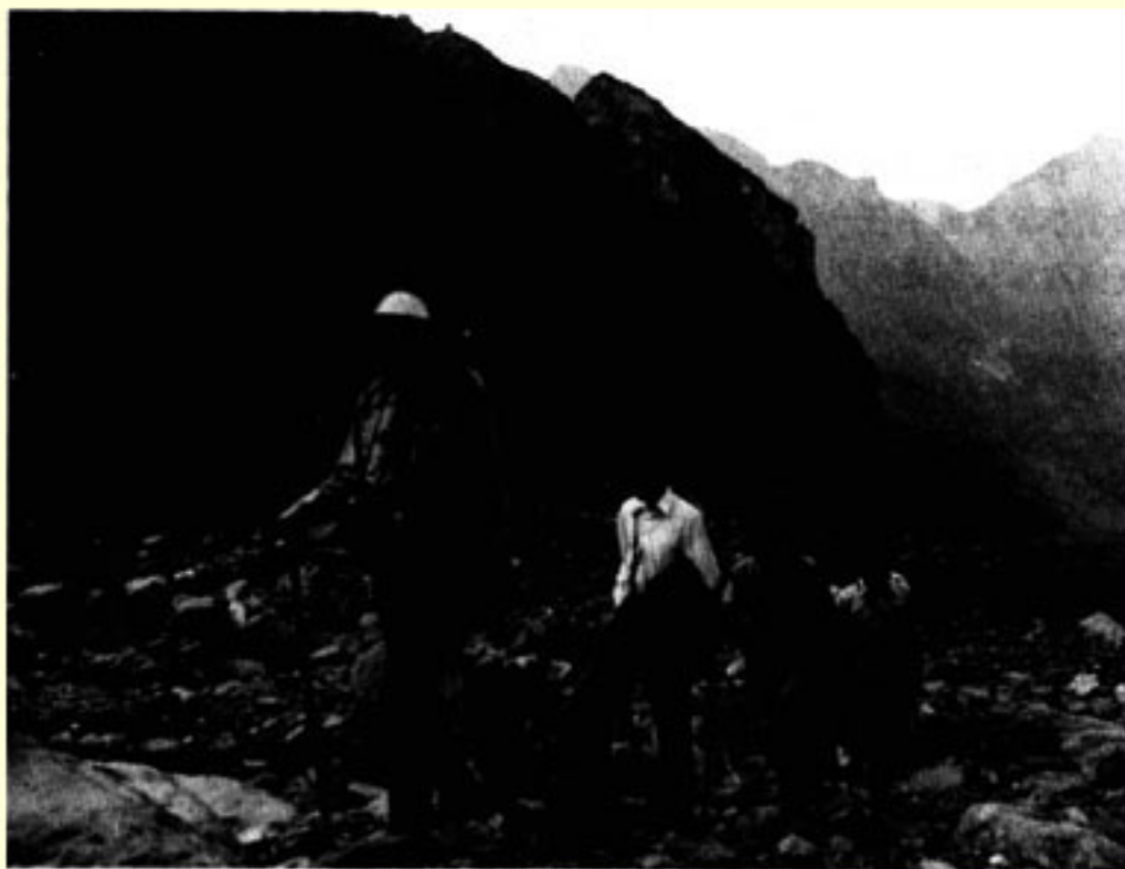
在狮头山下的乱石滩上行走