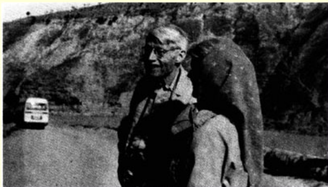
胜利的微笑 - 到达吴起镇。