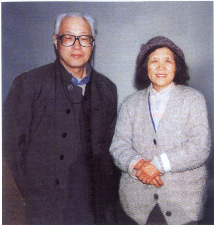
這是趙紫陽在被軟禁7年後的1996年在家中與夫人的合照。當時趙老身體尚佳，但8年後的今天，他的身體狀況已嚴重惡化，肺臟大面積纖維化，需24小時吸氧氣維持生命。