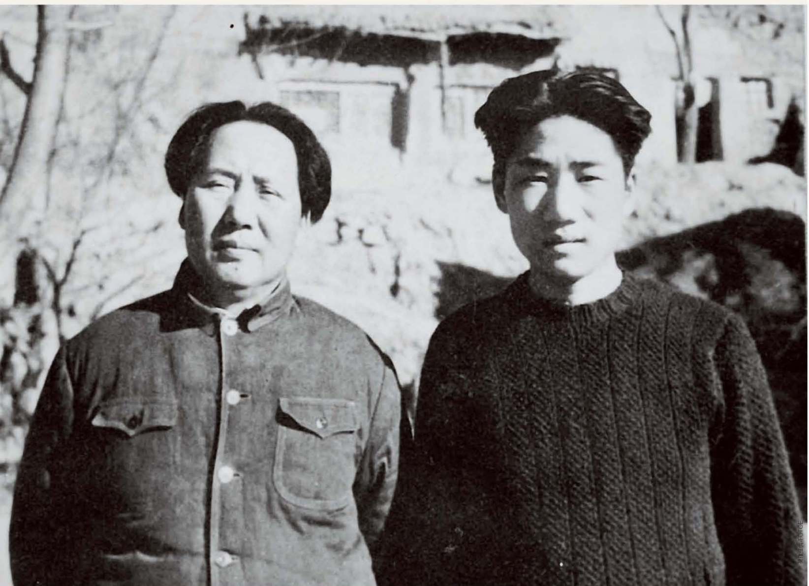
／ 1946年，毛岸英与父亲毛泽东合影