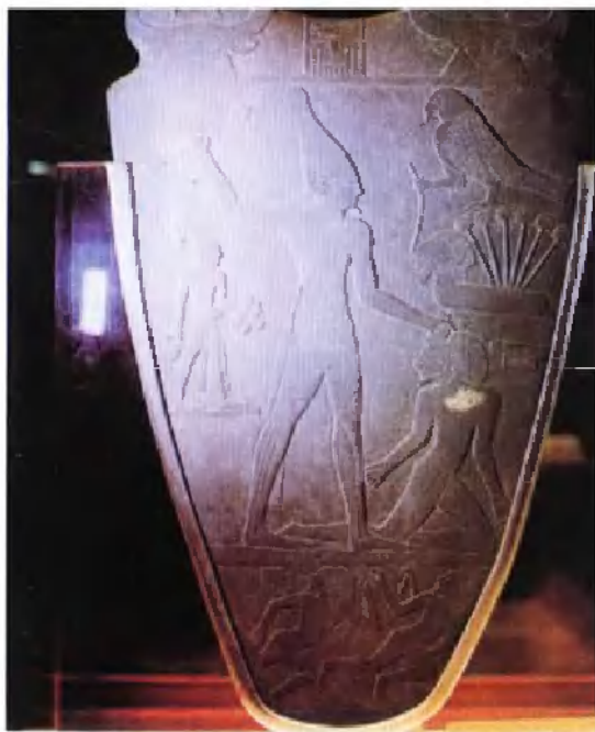
收藏于开罗 博物馆的纳尔迈 调色板