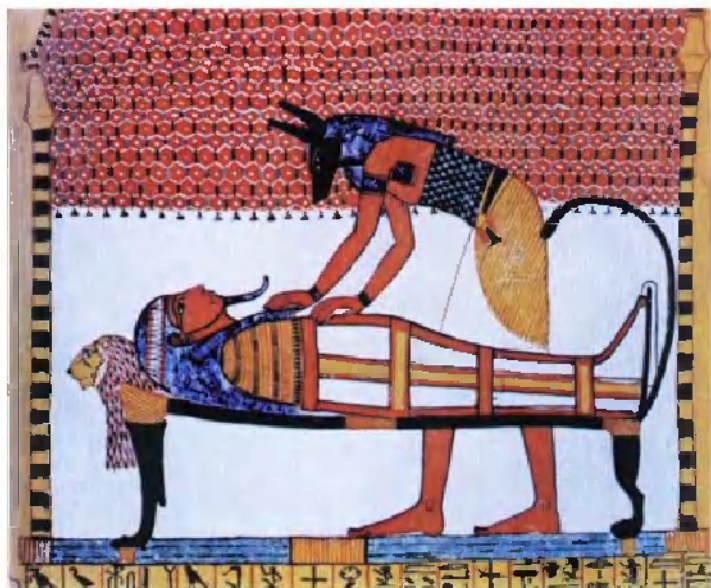
阿努比斯神为法老的木乃伊举行“开口”仪式