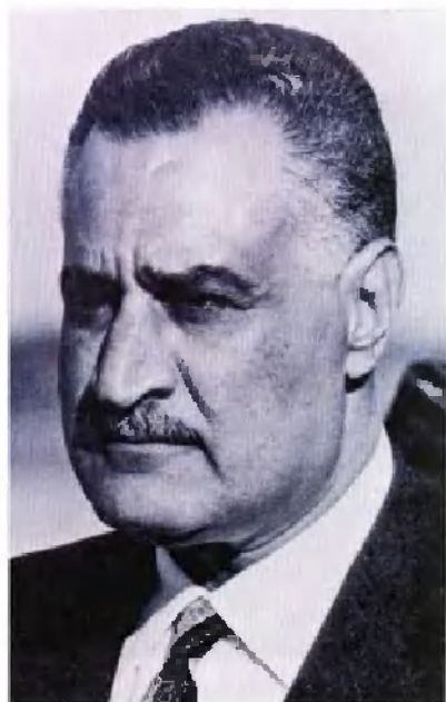
埃及首任总统加麦 尔·阿卜杜勒·纳赛尔