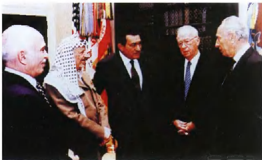
1994年5月，在埃及总统胡斯尼·穆巴拉克（中）主持下，巴以双方开罗签署《加沙—杰里科自治协议》。