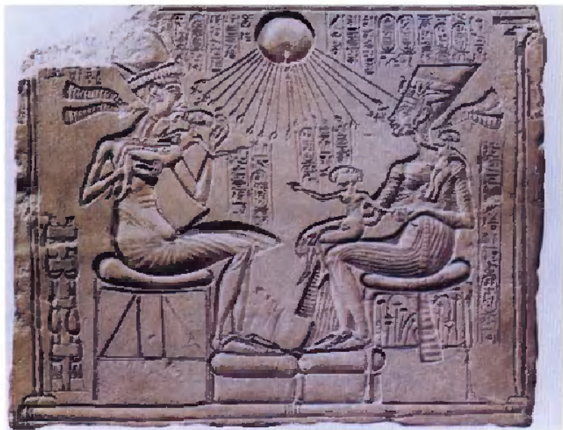
埃赫那吞全家尽情 沐浴着阿吞神的光泽