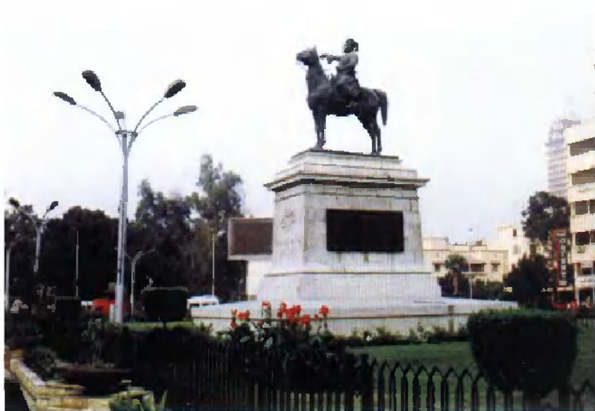
开罗市内的穆罕默德·阿里之子易卜拉欣帕夏雕像