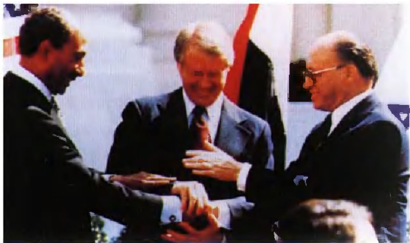
1978年9月，萨达特总统（左）与美国总统卡特（中）、以色列总理贝京共同签署《戴维营协议》。