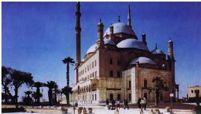
开罗市的标志——穆罕默德·阿里清真寺