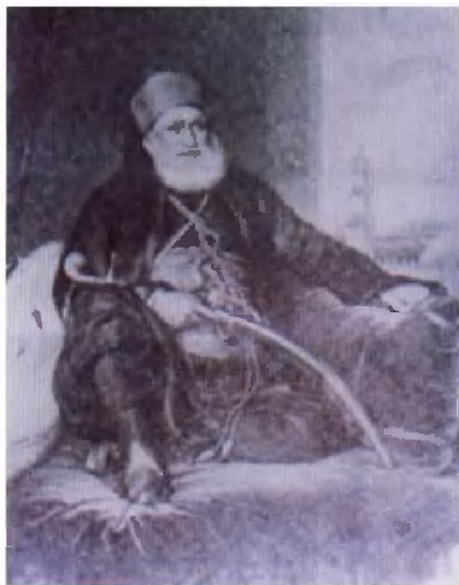
伊斯兰思想家、社会 改革家穆罕默德·阿布杜