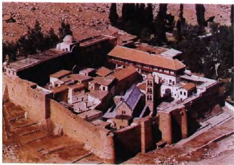
西奈山下的圣·凯瑟琳修道院