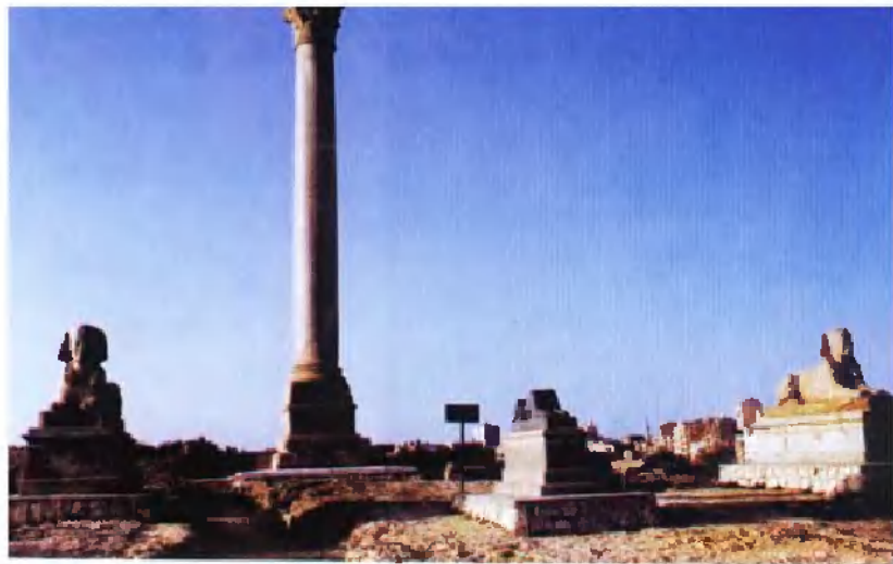
萨瓦里石柱(庞培柱),如今成为亚历山大市的标志。