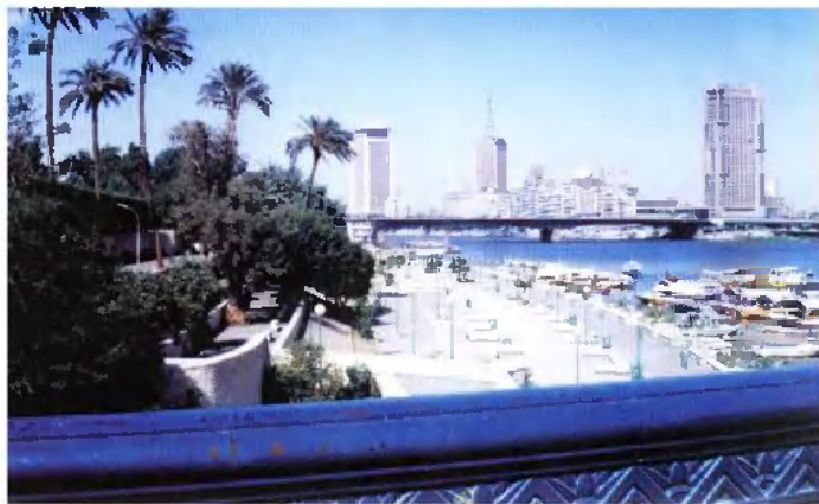
开罗市区尼罗河两岸的迷人景色