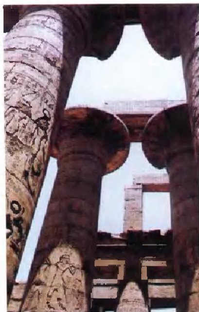
卡纳克神庙的巨型石柱