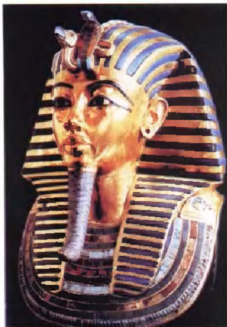
图坦卡蒙的黄金面具