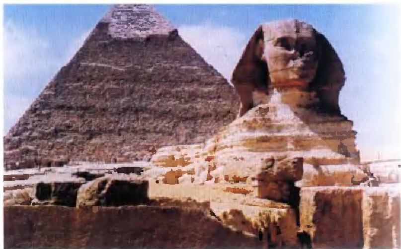
孟卡拉金字塔及其狮身人面像