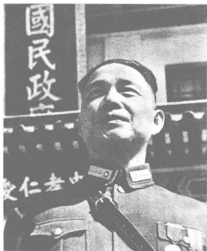
1943年偽國民政府「還都」三周年紀念日慶典結束後，身着陸軍正裝出現在大禮堂前的汪精衛。