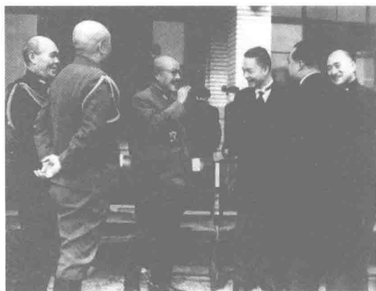
1942年12月，汪精衛(右三)前往東京，參加「大東亞戰爭一周年紀念會」，會見日本內閣總理大臣東條英機(左三)