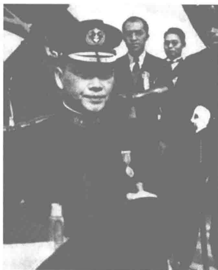
1942年3月30日，汪偽「還都」兩周年紀念儀式上，汪身着偽海軍元帥服在長江上檢閱海軍