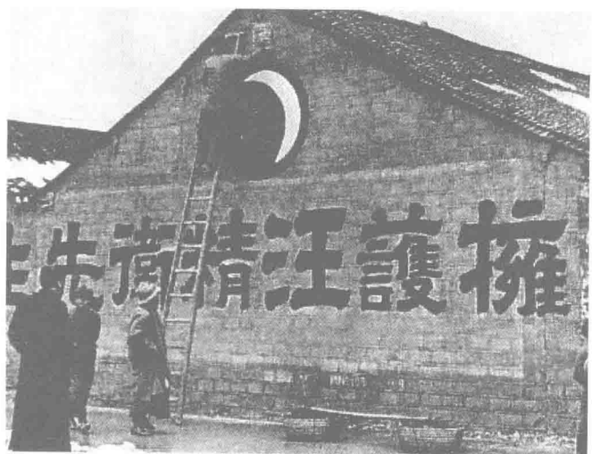
汪偽政權的宣傳標語