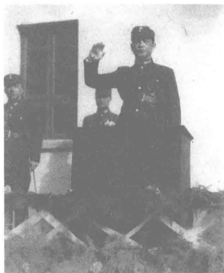
汪精衛在偽中央陸軍軍官學校講話