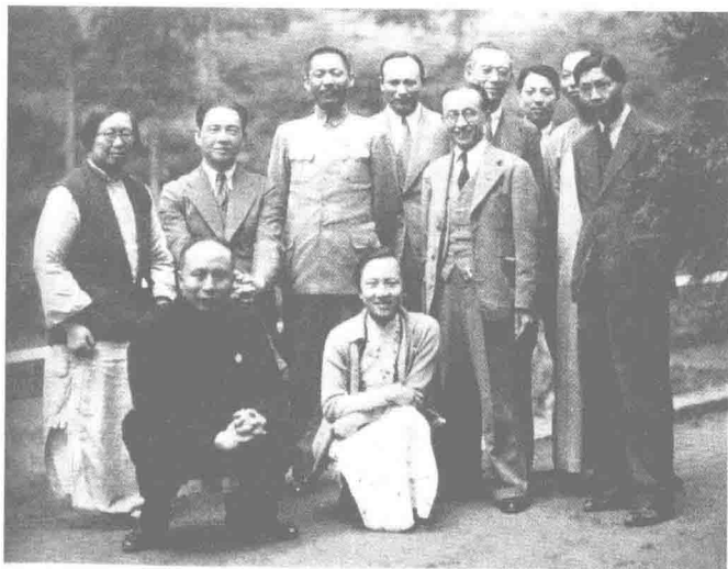
1935年，陳璧君(左一)與汪精衛(左二)在馬來西亞