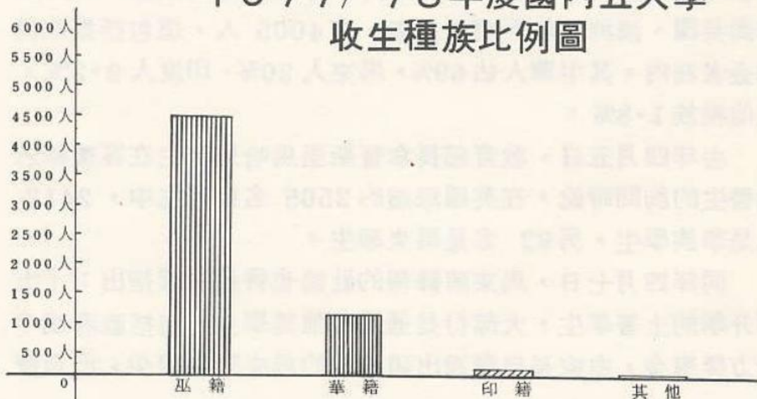
1977/78年度國內五大學 收生種族比例圖

我們極度關注非馬來學生在國內各大學深造的機會日益銳減的事實，自從「大學入學固打」被推行以來，越來越多的非馬來學生被排除在大學門外。根據副首相前任教育部長拿督斯里馬哈迪醫生去年七月十一日在下議院回答芙蓉區國會議員曾敏興醫生時披露：一九七七年度本國五間大學申請入學之學生達25,998人，其中只有5,953人獲准入學，在獲准者中，4,457人係土著學生，華裔學生佔1,187人，印裔學生佔266人，其他籍43人。其收生種族比例差距之大，可從下列圖表看出：