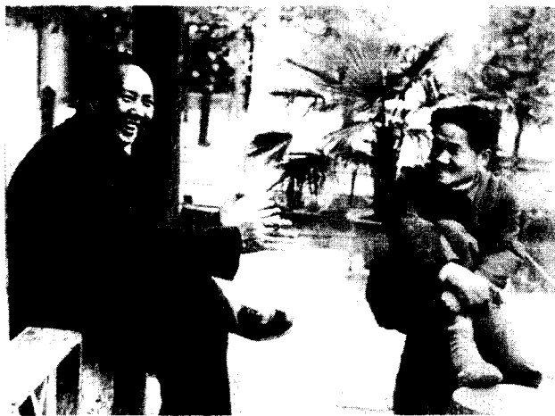
1949年，毛岸英与父亲毛泽东在北平香山

上午10点左右，四架美国飞机钻出云层，掠过了大榆洞。敌机过后，警报没有解除，我们仍待在上山。这中间，毛岸英不顾生命危险，下来处理急件。处理完以后，他可能想去再找点吃的。现在