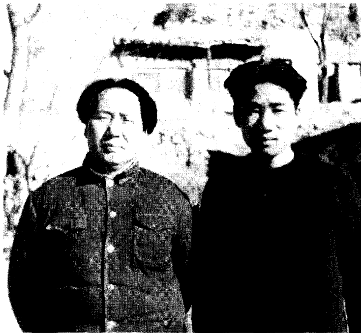
1946年，毛岸英与父亲毛泽东在延安

的身份，可他对自己要求非常严格，从来不以毛主席的儿子自居。该自己管的事情一丝不苟，不该自己管的事情从来不指手画脚。