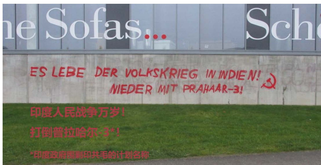
2021年，德国埃森，反对反革命行动和声援印度革命的革命涂鸦。

建立和加强世界性的、有组织的政治犯声援运动是非常有必要的。这项运动要求：必须无条件释放所有国家的政治犯，如菲律宾、土耳其、秘鲁、加利西亚、阿富汗和包括印度在内的所有革命运动国家；所有因社会、政治斗争而被捕并被关在监狱里的人都必须获得政治犯的地位；必须停止对囚犯权利的侵犯以及对他们的暴行和镇压，特别是政治犯和女囚犯；必须改革监狱管理手册；必须根据囚犯的情况改善监狱的条件。我们党希望支持印度人民战争国际委员会的努力能朝这个方向发展。我们党宣布它将在印度进行这方面的努力，并坚信这一运动将逐步发展。