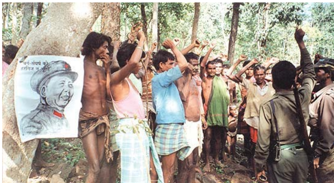
图为南恰蒂斯加尔邦革命战士和革命群众的集会， 有一幅悬挂在显眼位置的毛主席画像。