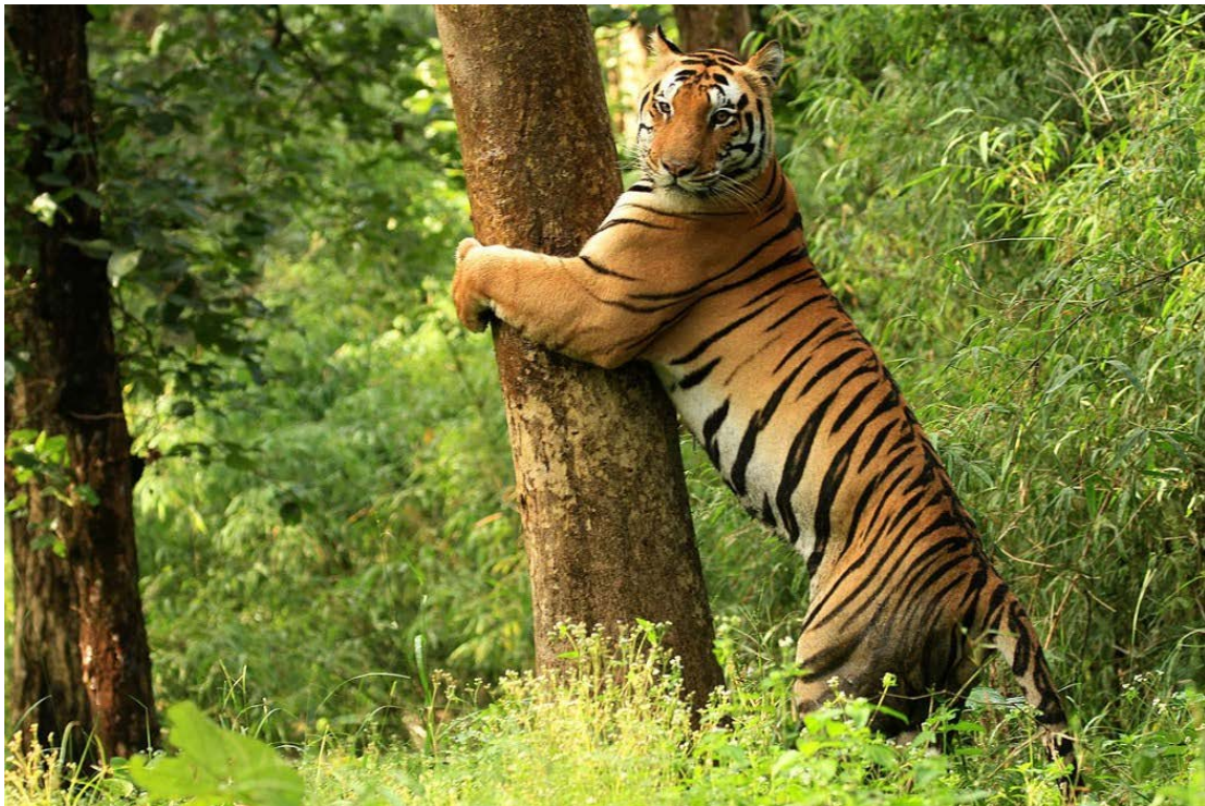
坎哈老虎保护区，自 2022 年以来一直由印度人民解放游击军控制。

答：我们党所领导革命运动的地区都具有丰富的生物多样性。那里有无尽的树木，常青的森林和不断奔腾的河流，草药、森林里的小动物、各种鸟类、哺乳动物、昆虫、小溪、水生生物、两栖动物，数百种鱼类，从森林中又产生出数十群可用的小型森林，接着产生出盘根错节的树根、果实、灌木丛和能源源不断产出果实的果树。种类繁多的稻谷籽被我们用传统的方式小心地保存着，以及各种豆类及油籽。长期以来，我们这样宝贵，宏伟，独特且平衡的自然生物多样性就处在帝国主义和买办资产阶级的巨大威胁下。因为统治阶级和帝国主义支持的反人类政策，这些生物多样性和自然环境正面临着被破坏的风险。我们不能够为了国内外少数大剥削者的利润而让我们的自然就这样堕落。我们必须保持自然平衡，必须保护环境，必须以平衡的方式去利用我们的自然财富和资源，用以改善人类的生活条件。环境保护、自然平衡和改善人类的生活条件是相互依存的。我们必须不断地反对资本主义和帝国主义在资源上的破坏。而新民主主义革命就应该是永远解决这一问题的根本基础。