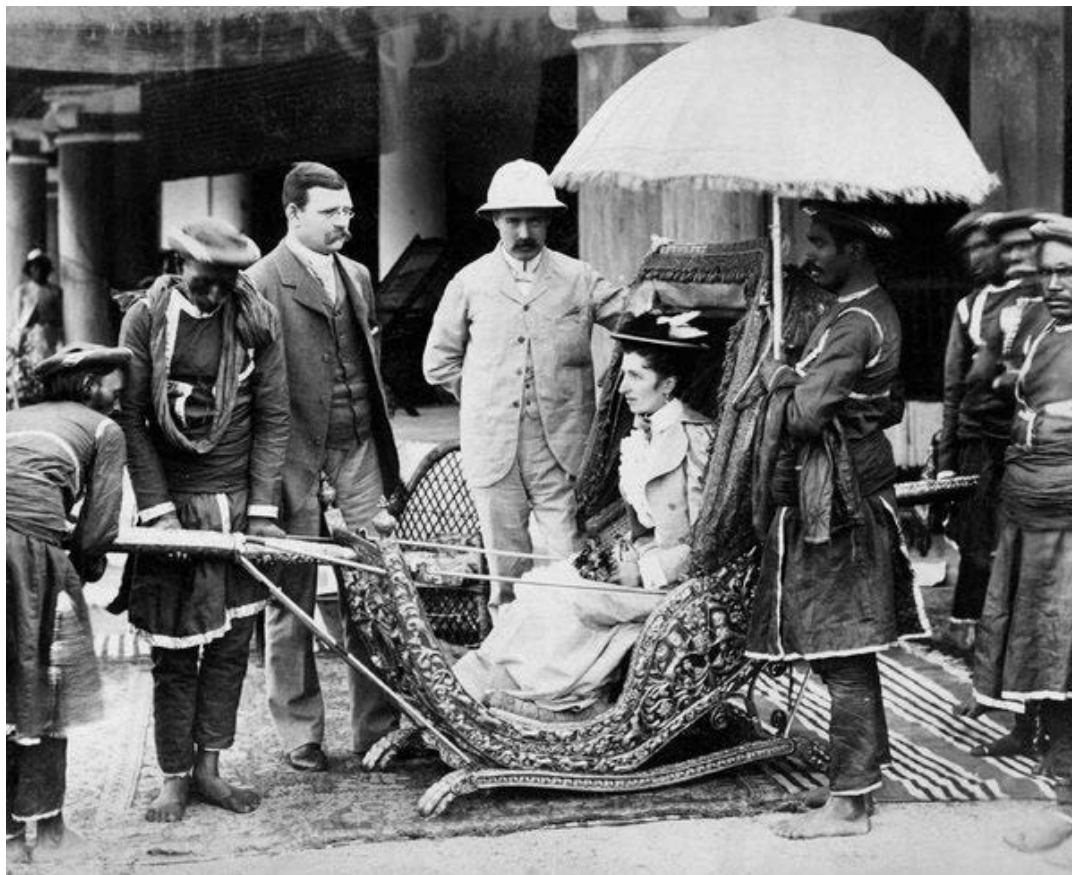
与为大英帝国种族灭绝辩护者宣扬的错误观念相反， 殖民主义没有为印度人民带来整体利益或进步，只有痛苦。

展起来 9 。在殖民地和附庸的层级上，印度经济成为世界资本主义体系不可分割的组成部分。印度买办资产阶级一方面依靠帝国主义生存和发展，另一方面成为殖民剥削和镇压的工具。因此，印度的封建社会变成了殖民地半封建社会。在长达两个世纪的时间里，英国人把印度变成殖民地并持续着他们的剥削。