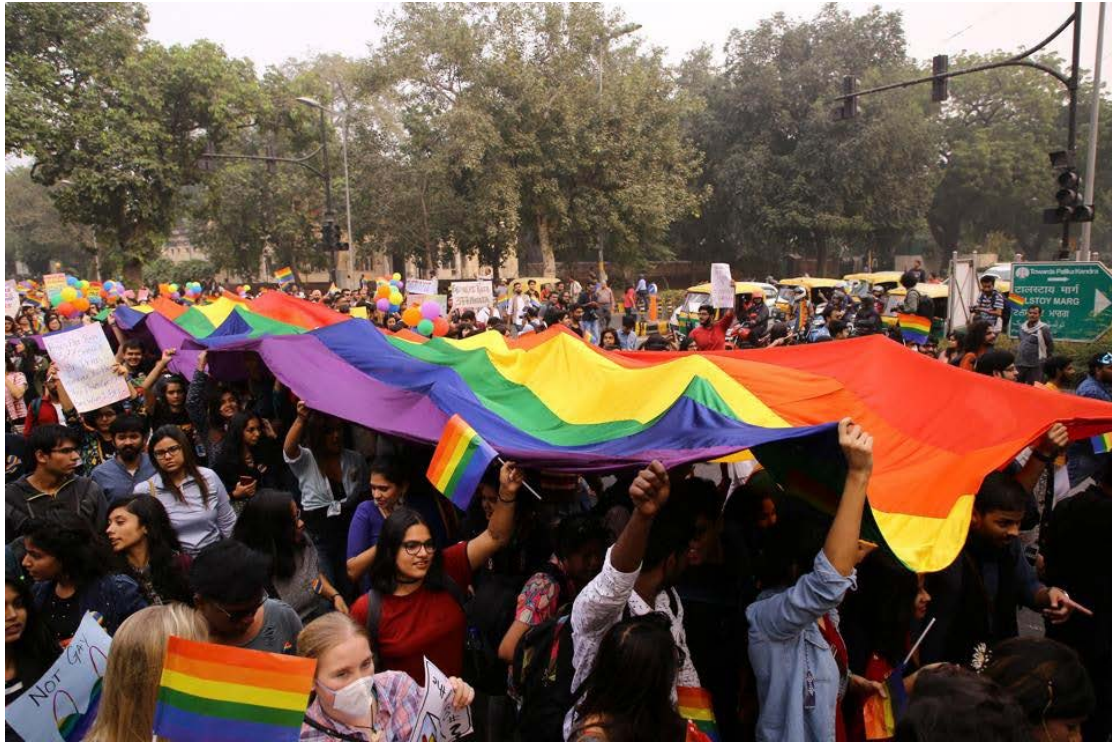
印度 LGBTQ+社区为他们的存在和解放举行示威游行， 并反对可追溯到英国殖民主义时代的反 LGBTQ+法律。

在现阶段，印度正在进行的争取 LGBT 权利的运动脱离了阶级斗争的社会现实，受到了以个人为中心的资产阶级后现代主义意识形态的影响。这场运动必须克服它。这个运动必须成为所有致力于摧毁印度国家的运动的一部分，这个国家代表着半殖民地、半封建的社会经济制度，除了对 LGBT 群体之外，它还对该国所有被压迫的阶层进行法西斯镇压和残酷的剥削。 LGBT 社区还必须与所有被压迫阶级团结起来反对三个敌对阶级，即帝国主义、印度买办官僚资本主义和封建阶级，他们正在制造剥削、压迫、镇压和歧视。