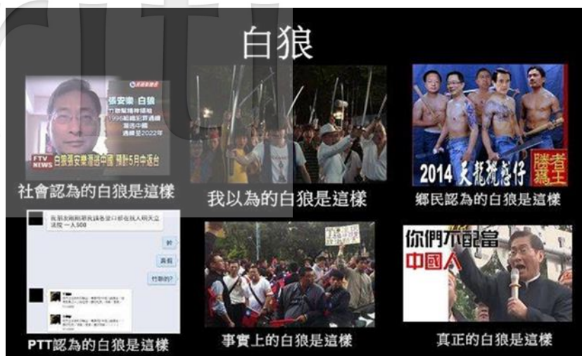
圖 3 網友誠意重回覆留言圖