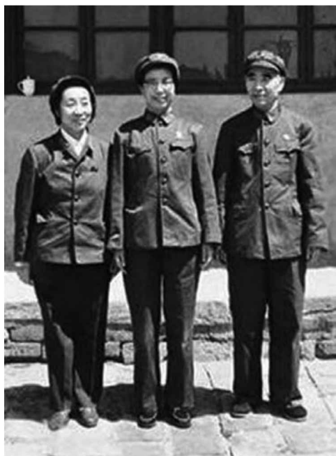
江青與林彪、葉群合影（居中）