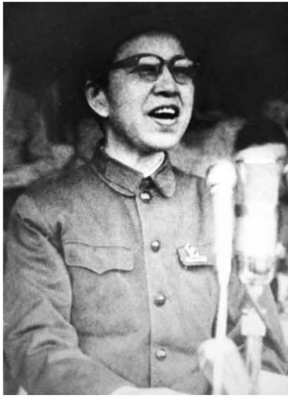
江青發表講話