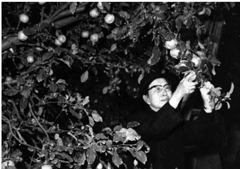
1976年10月，江青在景山公園