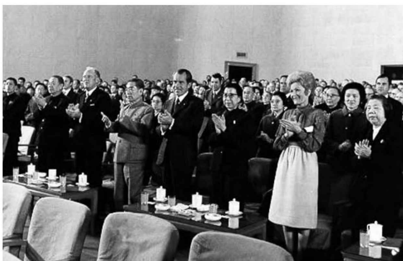
江青陪尼克松觀看革命現代京劇《紅色娘子軍》（右三）