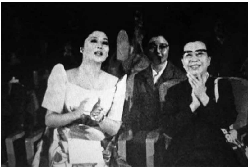
江青舉辦音樂會，招待馬科斯總統夫人伊梅爾達·羅穆亞爾德斯·馬科斯觀賞中央樂團的演出（右一）（《人民畫報》1974年第12期）