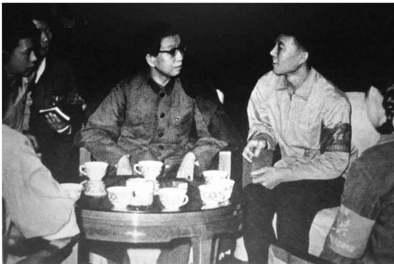
江青與學生在一起（右三）