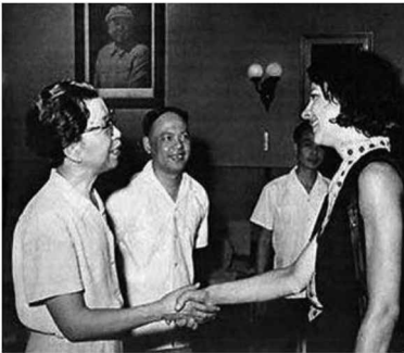
◀談話人：江青、維特克。8月27日晚江青與維特克談話有8個小時，從上海、延安至解放以後。