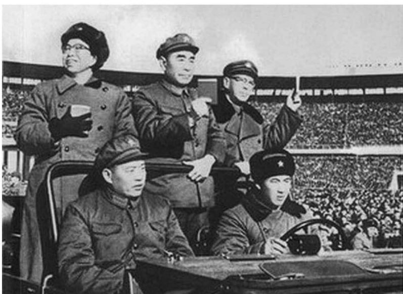
1966年12月28日，江青與周恩來、康生等中央負責人接見了全國各地徒步來京進行革命串聯的十多萬紅衛兵和師生。（後排左一）（新華社記者攝影，《人民畫報》1967年第3期）