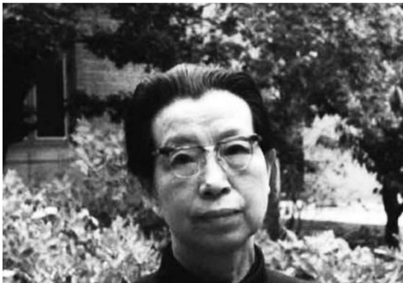
毛澤東逝世後，江青在毛澤東住地游泳池院內