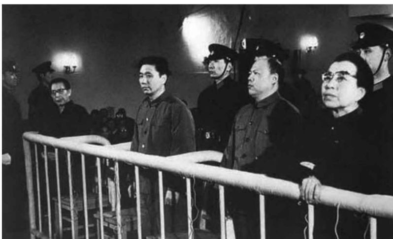
「四人幫」在法庭上（右一）