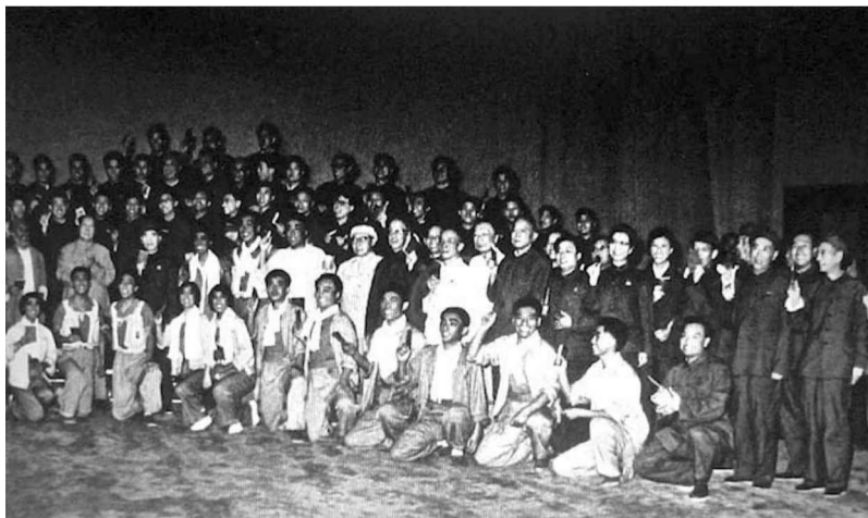
江青與毛澤東、林彪、陳伯達等和《海港》的演員合影（第二排右五）