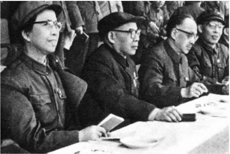
江青、陳伯達、康生、張春橋在大會上（左一）