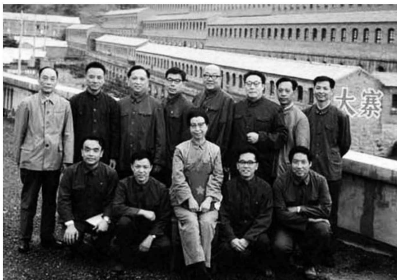
江青在大寨與文藝工作者合影（前排右三）