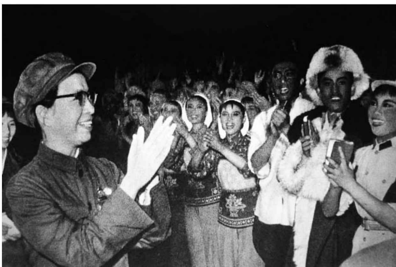
江青會見陸海空三軍文藝戰士（左一）（《人民畫報》1967年第8期）