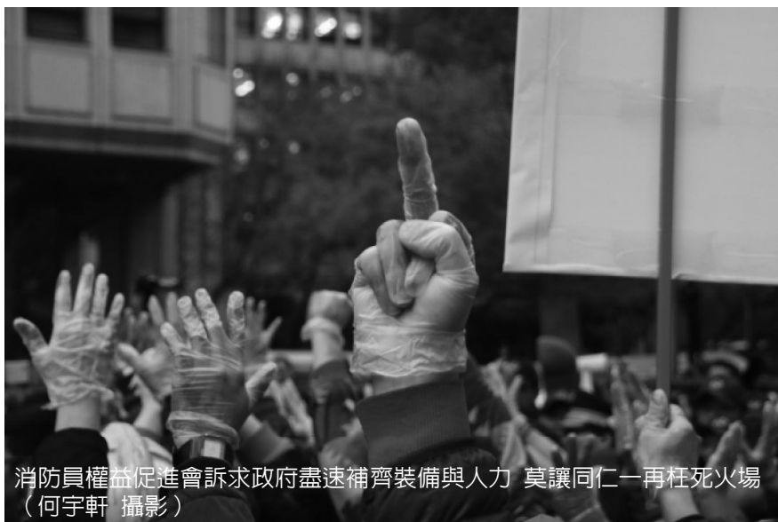
消防員權益促進會訴求政府盡速補齊裝備與人力 莫讓同仁一再枉死火場

如果是在公聽會、說明會、聽證會等場合，建議在發言時清楚說明訴求和論述，同時表達對政治人物的不滿。