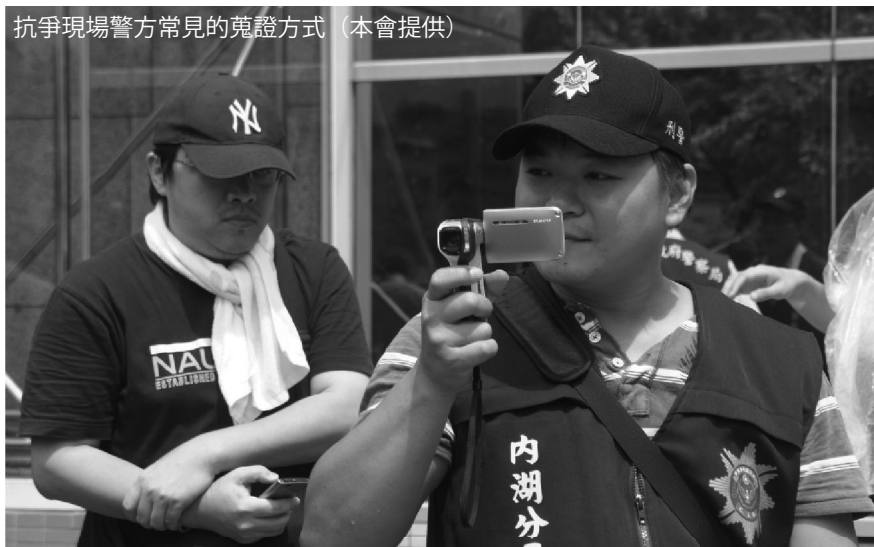
抗爭現場警方常見的蒐證方式

釋字六八九號解釋認為，為維持民主多元社會正常發展，新聞自由是不可或缺的機制，應受《憲法》第十一條所保障；其又認為新聞採訪，