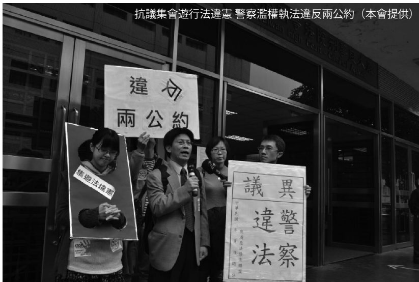
抗議集會遊行法違憲 警察濫權執法違反兩公約

目前法院實務上，透過異議制度成功提起行政訴訟，制衡警察違法作為的案例，仍然很缺乏。而現場被要求簽發異議書時，警察也可能以沒帶、必須回派出所才能簽發（變相讓抗爭者自願離開）或是直接相應不理來搪塞，甚至會在拒絕的同時誘使抗爭者與之口角，再以妨害公務送辦。