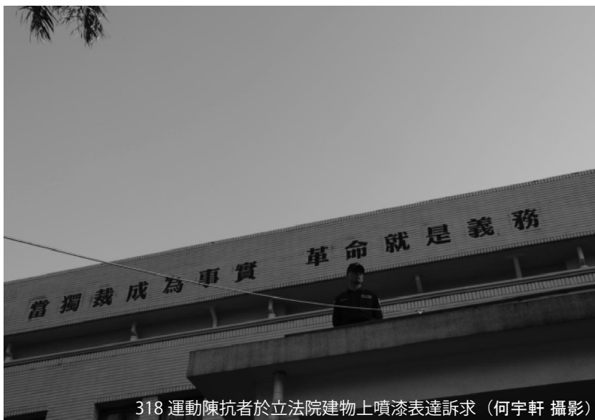
318 運動陳抗者於立法院建物上噴漆表達訴求

若有能力承擔刑責，可以選擇潑建築物外牆；若無，可以選擇潑在地板，或選擇容易清理的水性漆，較不易被認定為毀損罪。若要避免求償或追訴，亦可在事後主動清理。另外，除了《刑法》追訴外，通常會附帶民事訴訟，行動者需考量自身有無能力賠償相關費用。