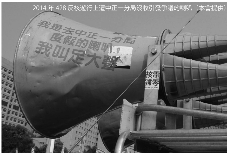
2014年428反核遊行上遭中正一分局沒收引發爭議的喇叭

使用擴音器多是為了方便對群眾傳達訊息以及對社會表達訴求，警方通常不會有太多干涉。雖也曾經發生過警方沒收大聲公的事件，但並不是因為音量問題，而是為了癱瘓指揮中樞。為確保指揮不被中斷，建議應有備用擴音設備、備用電源，或者無擴音設備時的備案。若音響設備被沒收，應立即蒐證，提出異議並要求警方明示扣留依據，以及依《警察職權行使法》第二二條開具扣留物清單。事後尋求法律支援，向相關單位要求返還。