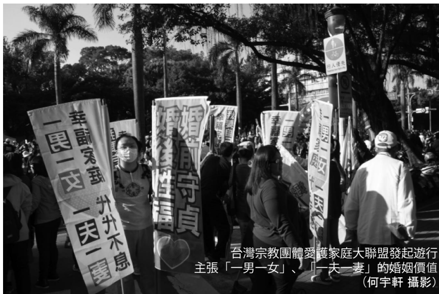
台灣宗教團體愛護家庭大聯盟發起遊行 主張「一男一女」、「一夫一妻」的婚姻價值