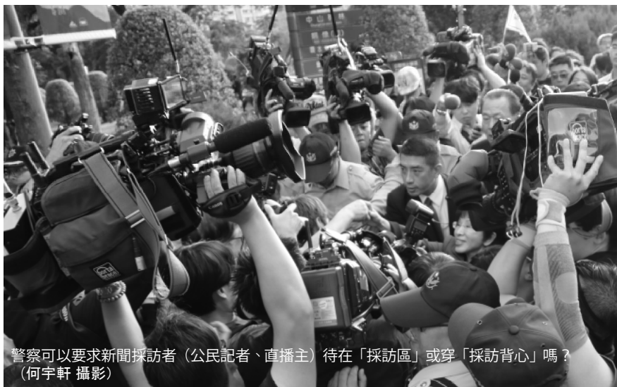
警察可以要求新聞採訪者（公民記者、直播主）待在「採訪區」或穿「採訪背心」嗎？

目前由於新聞採訪者普遍抵制相關措施，因此相關要求均未強制執行，建議持續抵制、無視相關