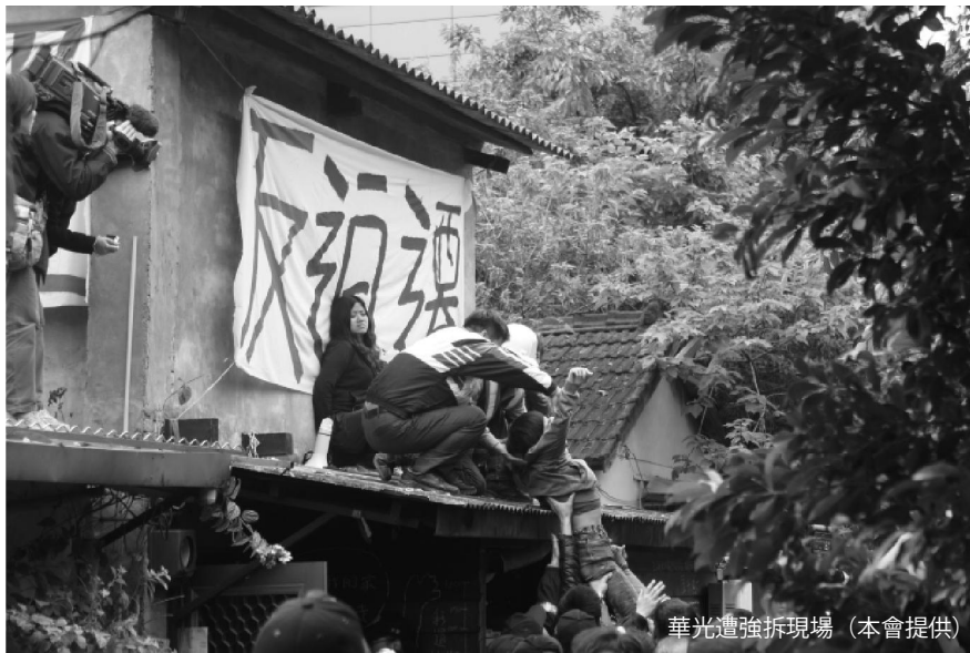
華光遭強拆現場

被拖進去時，除了保護頭部外，建議可以大聲呼救，讓身邊夥伴能夠注意到你的情況，進而要求放人、協助送醫等等，並拖延警方執法及清空現場的時間。還手或叫囂無助於保護自己，很可能會激起警察的情緒而被打得更兇。雖然困難，但要盡量記住警察的編號或是長相，以便日後究責。