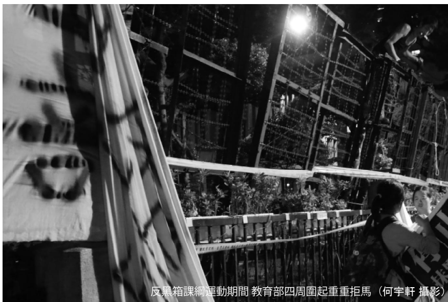
反黑箱課綱運動期間 教育部四周圍起重重拒馬

如果抗爭者不想被警察驅離，可以選擇離開現場，警察通常也不會阻止。他們的目的往往只是為了排除現場的抗爭，未必是要把人留在裡頭。