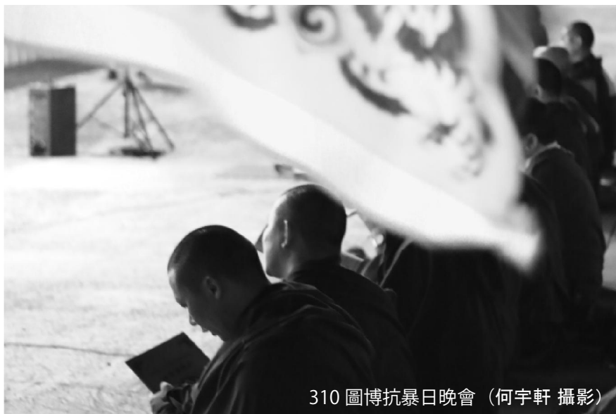
310 圖博抗暴日晚會

外國人在入境時，移民署可能依照《入出國及移民法》第十八條第十三款，以有害公共秩序為由直接遣返或拒絕入境。實際上外國人參與集會遊行時，若在衝突中被警方逮捕或驅離後，即可能啟動驅逐或出入境管制。通常在出境後，案件才被送至移民署審查，