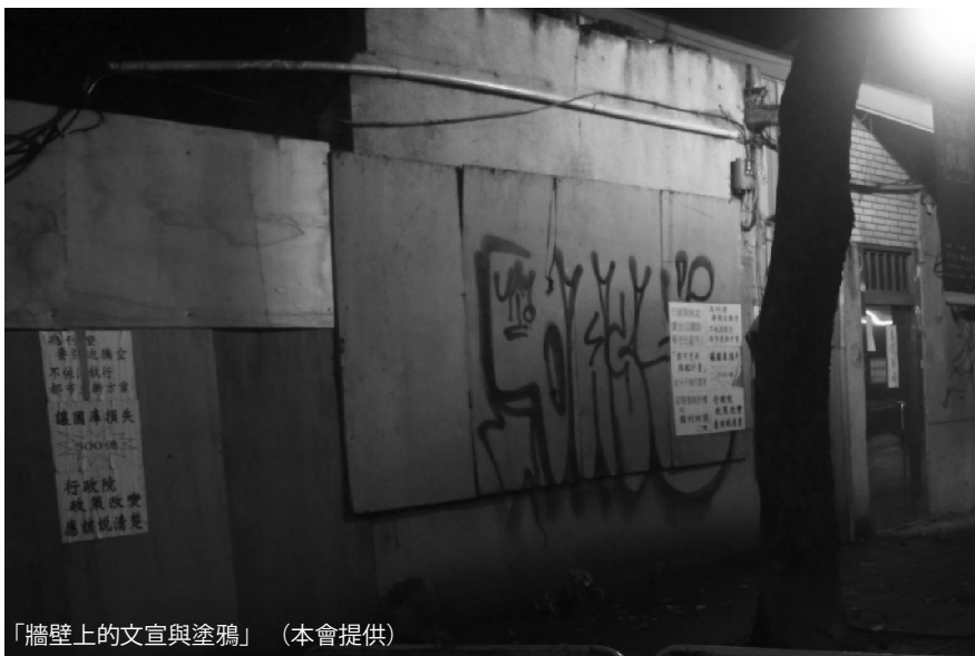
「牆壁上的文宣與塗鴉」

其實在這個問題上，並無單一而固定的答案。對很多運動而言，「打掃場地」這件事情是訴諸秩序與和平的表徵，所以有時為了爭取更多人支持這種行動，會選擇有意識地去清理，透過媒體的傳播，為運動增加和平的形象。然而，這並不絕對。抗爭的本質，本來就包括許多衝撞與不守秩