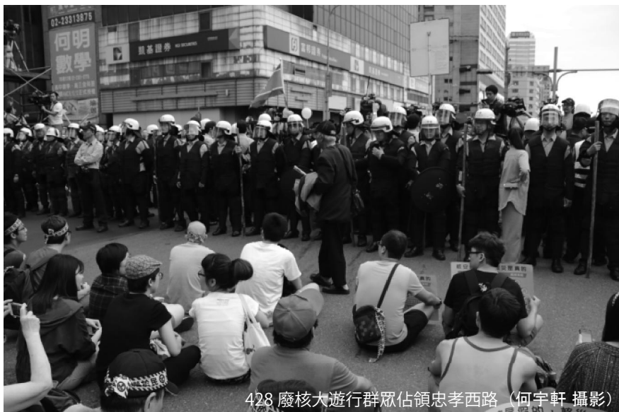
428 廢核大遊行群眾佔領忠孝西路

對於現場參與者，建議盡可能按照主辦單位的規劃，或是與主辦單位保持充分溝通，必要時透過網路社群（臉書、LINE）、媒體將自己的訴求傳送出去，讓更多人關注和了解問題。若希望號召群眾前往現場聲援，應先告知相關法律風險並注意人身安全，維持足夠人力協調新到場群眾。建議事先、事中、事後都與律師保持良好聯繫，以因應可能的司法風險。