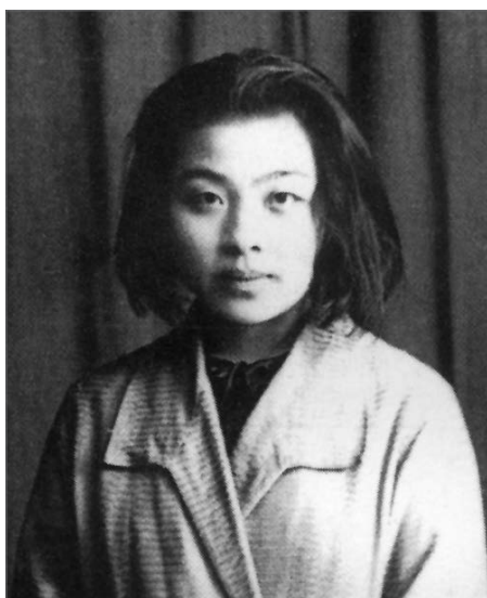
丁玲成名早，名作家意識很濃，身上有一股孤傲之氣。(資料圖片)

丁玲與冰心是上個世紀20、30年代齊名的當紅女作家，她們的作品風格、人生姿態截然不同：一位是通體燃燒的火；另一位是淑女般柔和的冰。這與她們各自的童年經歷不無關係。冰心的家庭是安寧的、溫馨的，父母雙全，對她與弟弟充滿了關愛與柔情。冰心的童年記憶多的是母愛，但丁玲的童年更多的是恨。茅盾評論說，「如果謝冰心女士作品的中心是對於母愛和自然的頌讚。那麼，初期