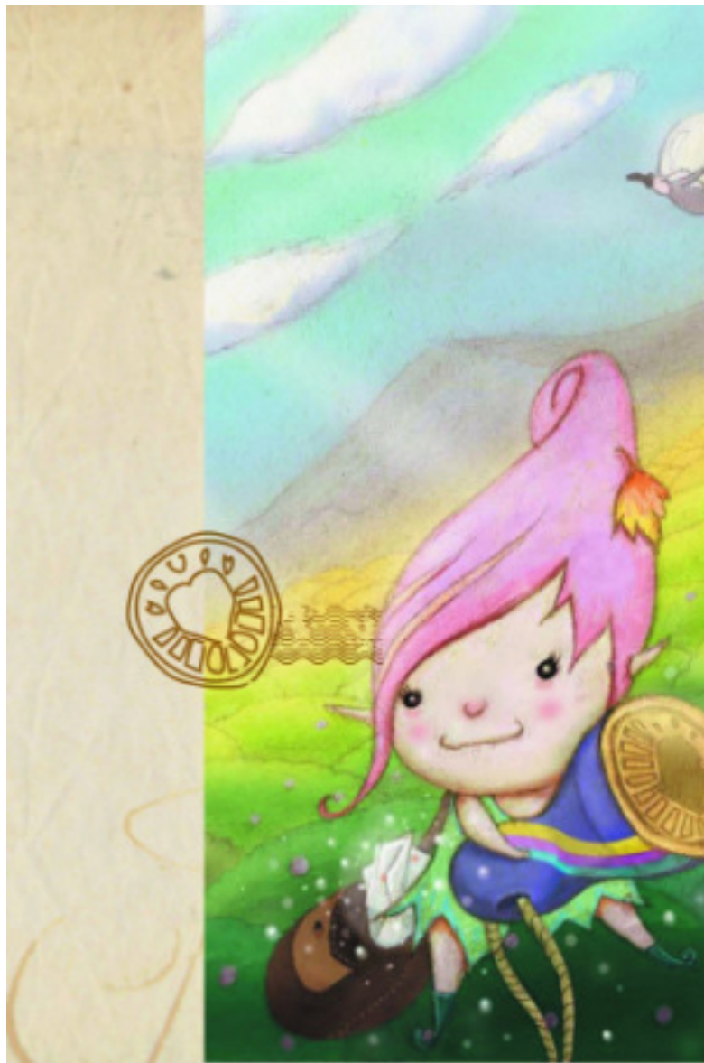
《心花怒放》演出海报