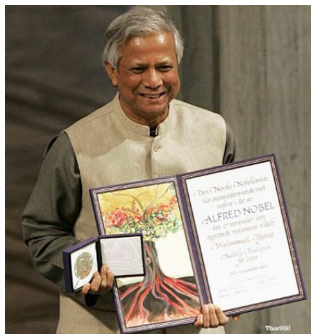
“穷人的银行家”尤努斯获诺贝尔和平奖

“尤努斯展示了一名领导人，把愿景转化为使不单在孟加拉，还包括世界各国的数百万人获益的实际行动。向缺乏财产安全的穷人借贷初看是天方夜谭。但始于三十年前的小额贷款，尤努斯首先而且主要是通过格莱珉银行把小额信贷发展成