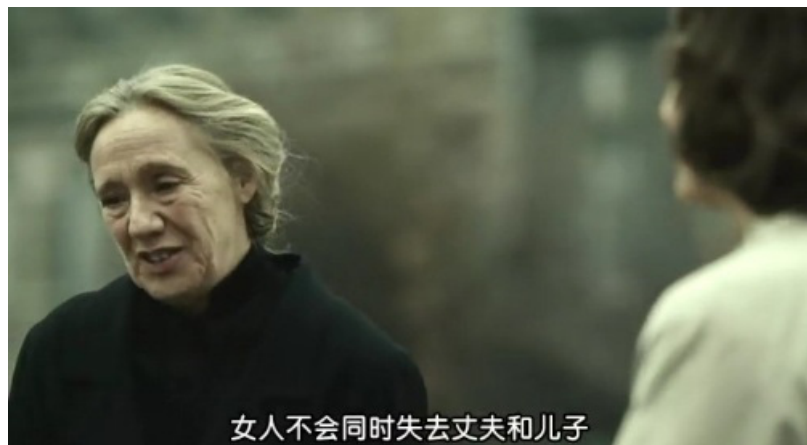
女人不会同时失去丈夫和儿子

1991年12月23日，一份1940年贝利亚的绝密报告被交给前苏联总统戈尔巴乔夫。报告详细说明了被苏联关押的波军被俘军官人数、军阶、职业和政治态度，