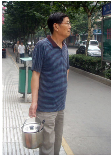
中阿姨：默默支持我的老伴

科医院，一个是第五医院，都住了地震伤员，骨科医院里孩子多，五院主要是成年人。“我跟他们说，我文化水平不高，就是个普普通通的老百姓，做不了别的，只能做点小事情，每天给骨科医院的伤员送两次汤，煲骨头汤帮助恢复，每天晚上再去五院陪他们聊天说话。”