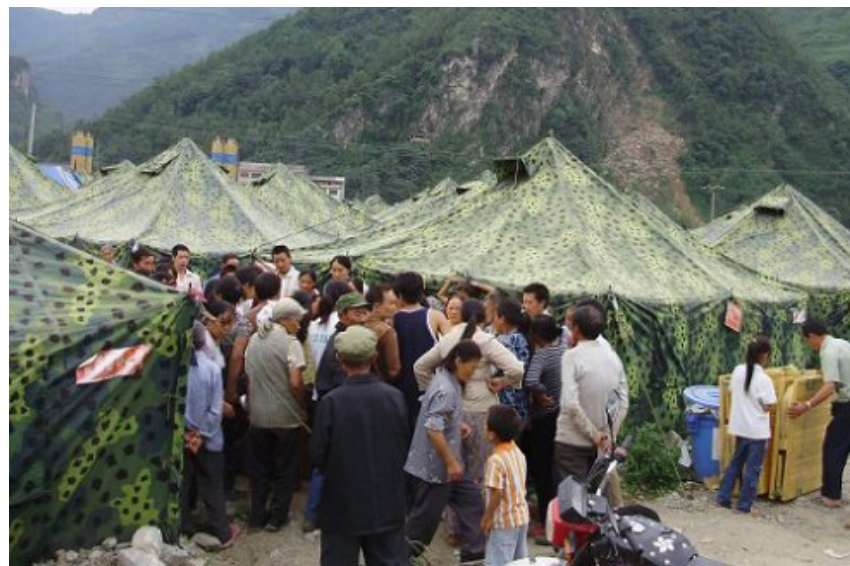
西瓜和朋友们将68张床送到大田村

回来之后，“西瓜”很快募集到一万多块钱，从香港来的一位客人又拿出了一万多，他找到一家旅行社出了车子和路费，“永宁助学”也出了一部分钱，