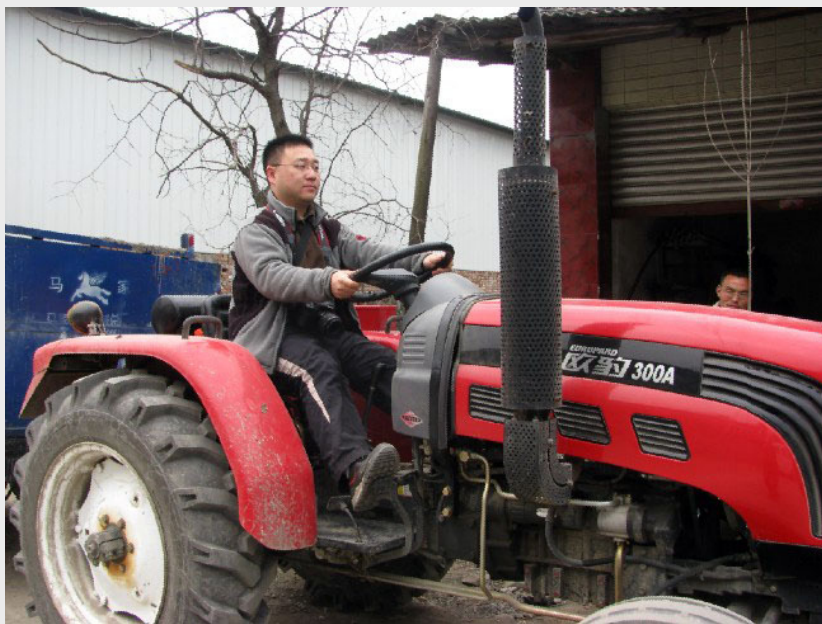
西瓜：缘来公寓的掌柜

不像老一辈公益人士有强烈的责任感和忧患意识，也不一定非要建立组织，他们真诚感性，动员迅速，只要他们看到了现实的需要，很容易激发心底的同情与善意。”