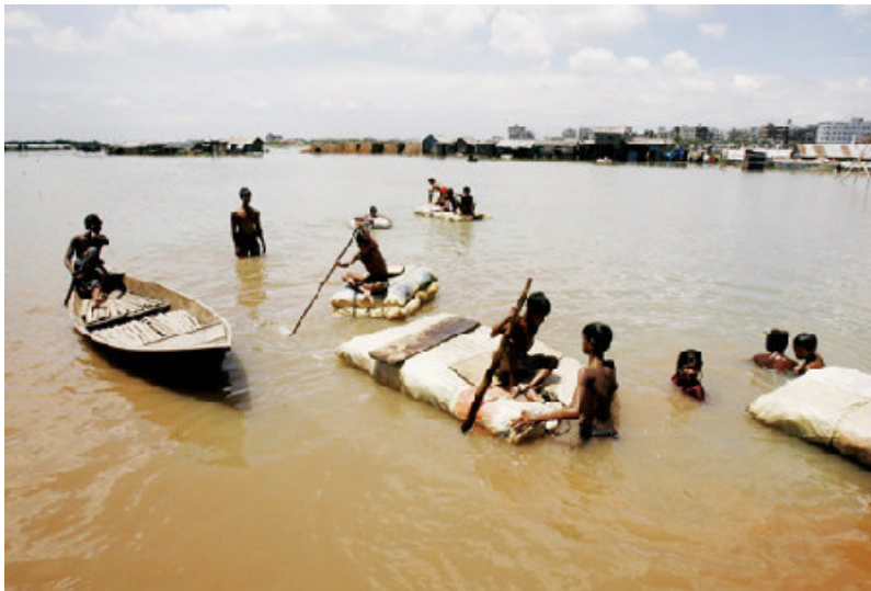
孟加拉是一个水灾多发的国家