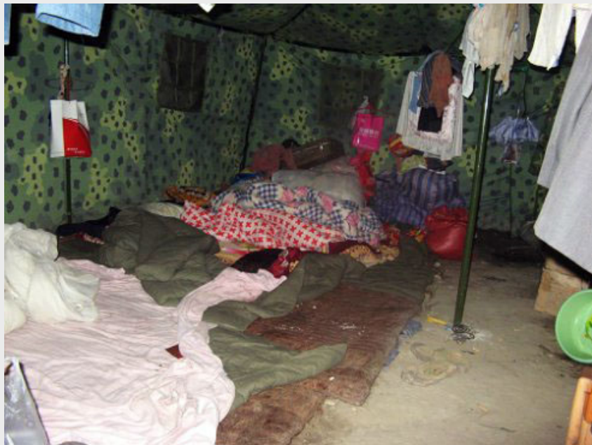
2008年8月，北川雷鼓镇大田村，灾民都睡在这样的地上，一下雨都是泥。

“西瓜”跟这个村子保持了联系，过冬前他又去找旅行社的朋友回去发动募款，就是上次出车送床的那个旅行社，他跟老板是朋友。“西瓜”还有一个朋