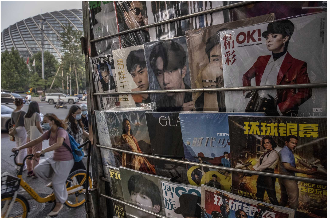
2021年9月10日北京，名人和時尚雜誌於報攤上展出。