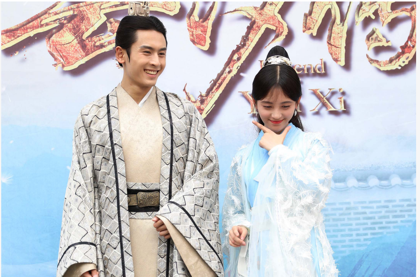
2017年8月23日中國浙江省金華市橫店鎮拍攝電視劇時，演員張哲瀚和女演員鞠婧禩。