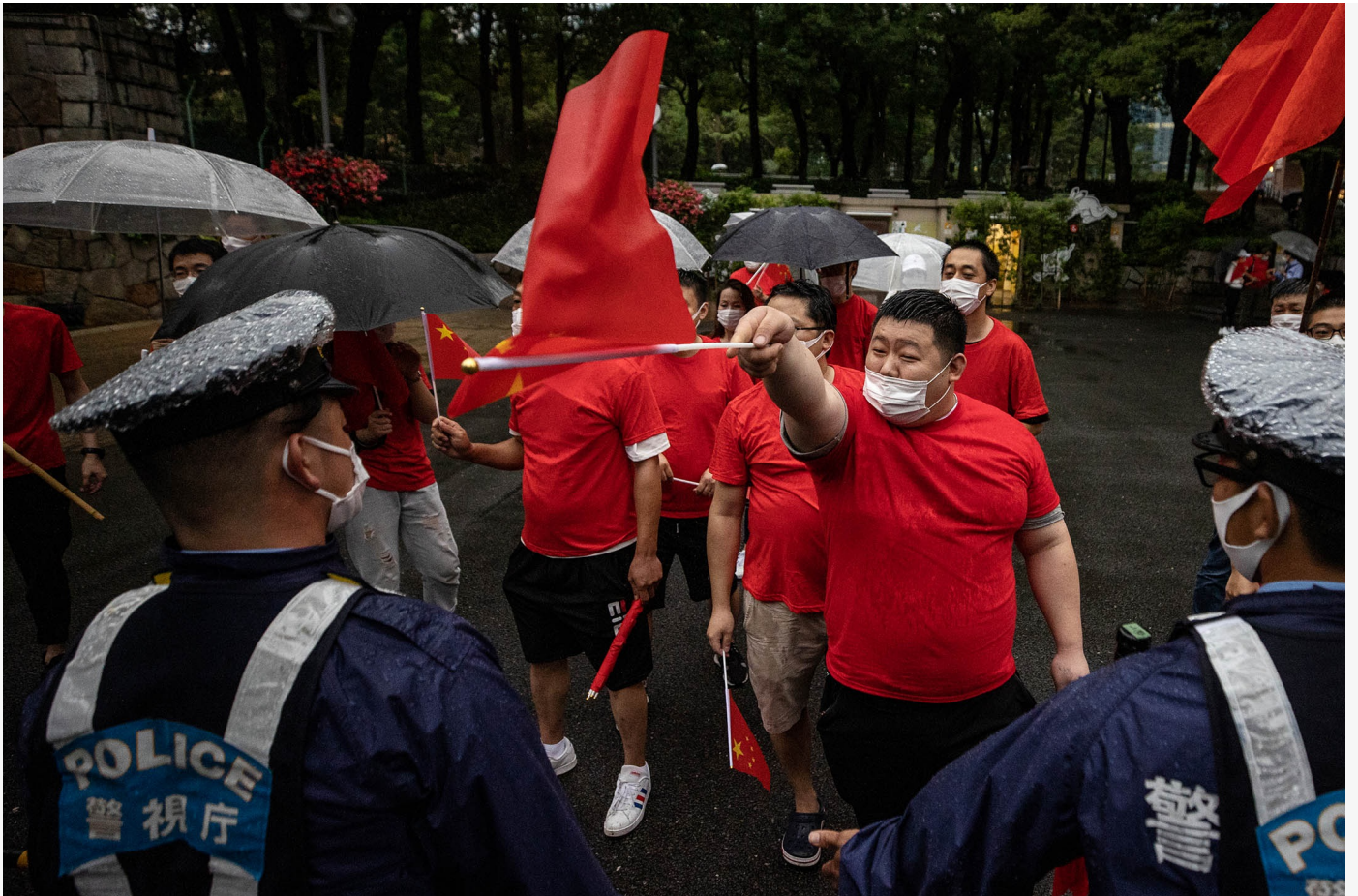
2021年7月1日日本東京，警察站在新宿中央公園的中國共產黨的支持者前。