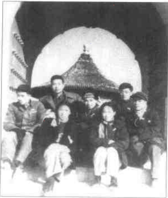
1955年摄于北京天坛回音壁前， 前排右第一人为林昭