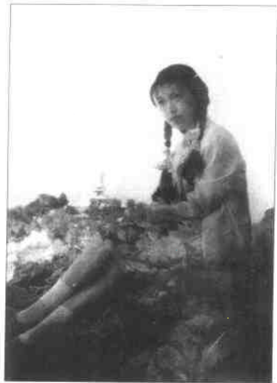
1959年的林昭，摄于北京北 海公园