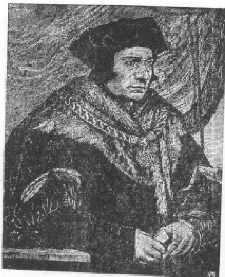
莫尔像 (霍尔拜因作)