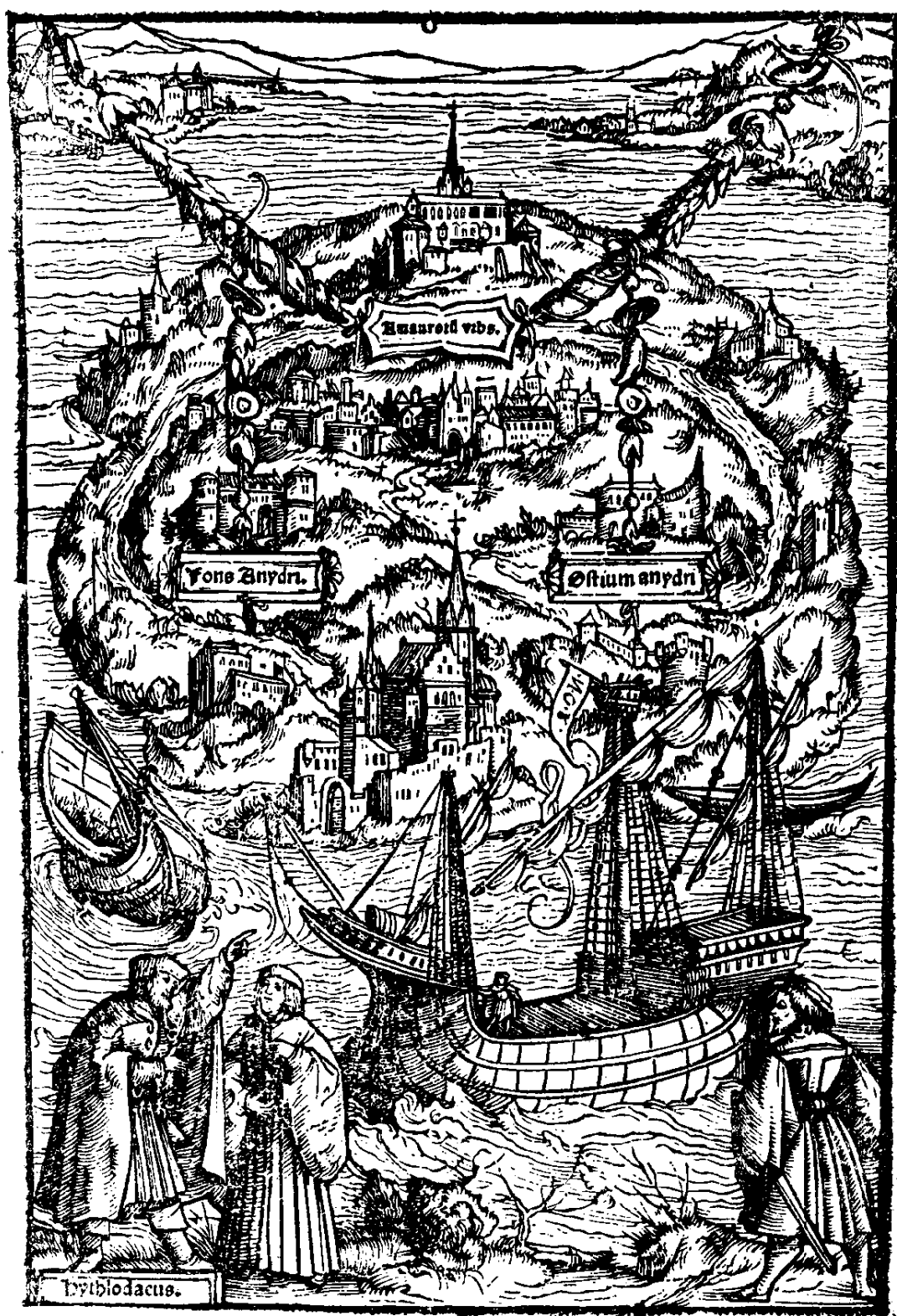
乌托邦岛图 (摘自 1518 年巴塞尔版)