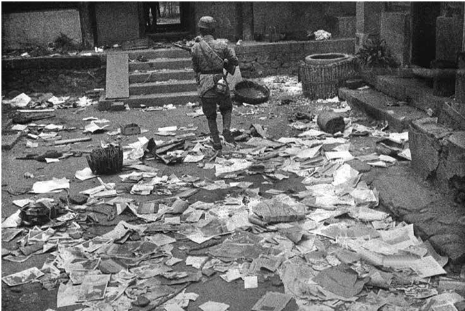
Figure 3 5月21日八路軍進入大龍華警備隊部。羅光達攝影《晉察冀畫報》創刊號

此調查報告不僅明確了將校行李的遺失過程，經緯，並且通過記錄的時刻可以準確地再現戰鬥經過。得知大龍華戰鬥分為兩次，第一次是20日凌晨1時20分開始的夜襲，經六小時戰鬥後，將夜襲者「擊退於南方山地」。真正的苦戰是八路軍第二次對大龍華村的襲擊，開始於同日午後1時20分。奉命留守的約一小隊兵力，經過約7小時的抵抗後，彈盡援絕。河口小隊長下令燒毀重要文件及破壞電臺突圍撤退。大龍華据点陷落时间是晚8時30分前后。