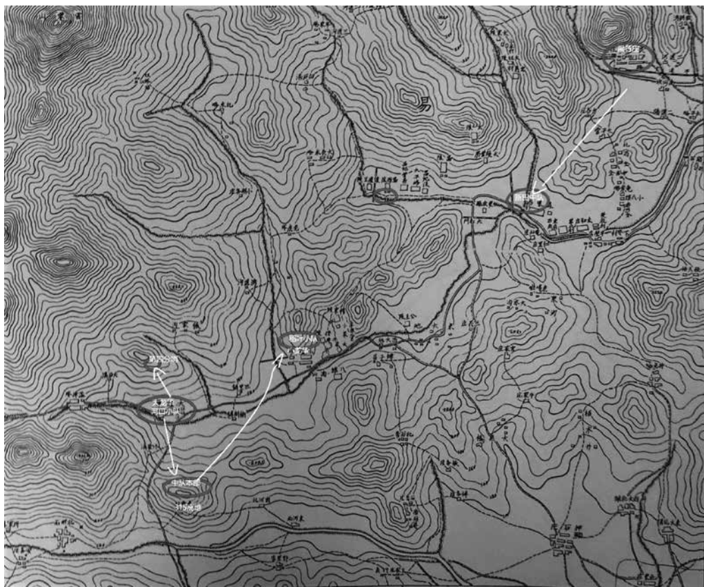
Figure 1 木曾隊在21日午後被分割圍殲的三處。增援的新田隊被阻擋在大紅門

此段記錄了5月20日發生在大龍華村附近一天的戰鬥。可以得知木曾中隊是在20日下午至晚間被分割成3部分各自被圍殲的。結果半數以上潰滅。殲滅戰進行的同時，楊成武部成功地封鎖了梁各莊至大龍華的道路，使救援隊新田中隊（約兩小隊兵力）無法接近。