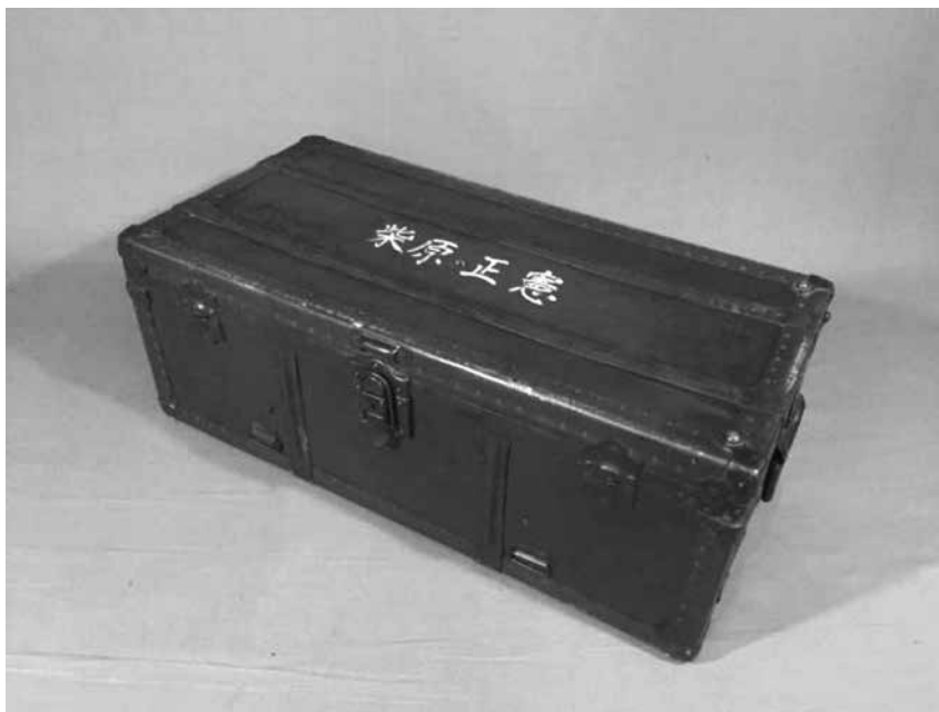
Figure 4 將校金屬行李箱的同樣品，需要用輜重車裝載

日軍為何沒有追究重要文件紛失的責任？考慮此類下發到各中隊管理的文件並不是什麼特別的作戰機密。從楊成武回憶錄的繳獲目錄看「有華北方面軍司令部頒發的《關於剿匪與警備的指針》、《使用特種器材（毒氣）之參考》和對我晉察冀根據地的《一九三九年一、二、三期肅正作戰概要》包括在經濟、文化等方面侵略我國的指導條款，還有情報工作，偽政權的建設與利用以及日軍一一〇師團司令部頒發的《對山區方面匪團封鎖計畫》，等等」 9 。多屬於一般的作戰指導手冊，規則，並不是像密碼暗號，或有關作戰計畫，部隊部署一類的直接機密。這也是此類文件裝箱保管的理由，不是常用文件。