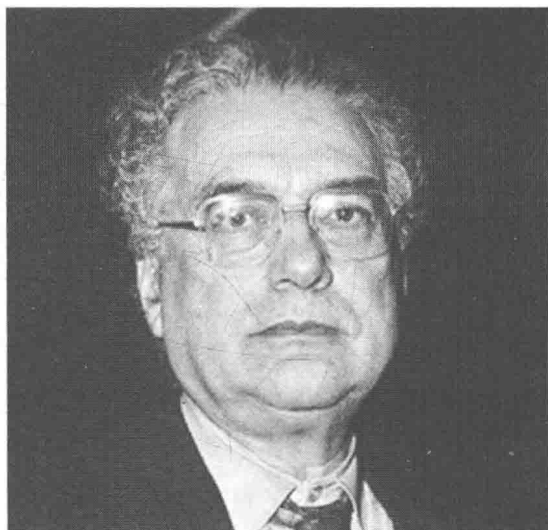
埃内斯特·曼德尔（1923—1995），当代“第四国际”主要领袖，托派思想家，马克思主义理论家。