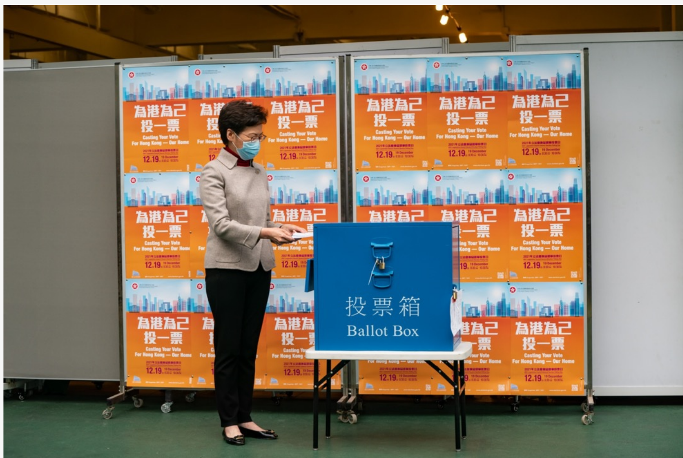
2021年12月19日，香港立法會換屆選舉，特首林鄭月娥早上到所屬選區票站投票。

因此從形勢上，北京想要的忠誠反對派無法生造，要求建制派以選舉工程提高投票率也屬強人所難。