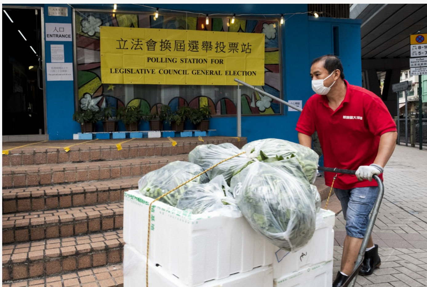
2021年12月19日，香港立法會換屆選舉，九龍中選區一個投票站門外。

參選機會到底會否加深民主派各黨分裂壓力，尚待觀察，不過忠誠反對派當選會促成民主派內部分裂，幾乎也成必然。