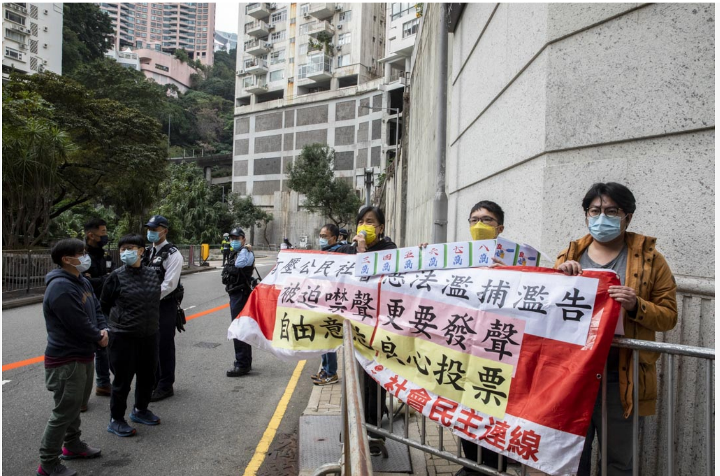
2021年12月19日，社民連將到高主教書院外向到場投票的林鄭抗議打壓公民社會，運用自由意志，投下良心一票。