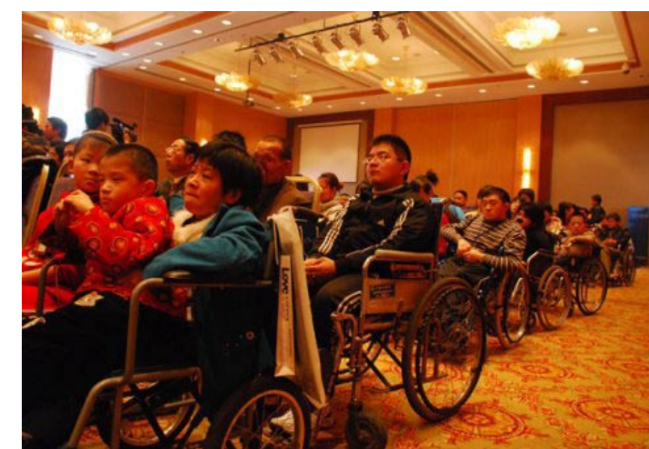
“瓷娃娃”的轮椅一字排开

而是以担心对方受伤为借口。社会上很多横在残障人士面前的障碍，都是以关爱的名义设置的，在就学和就业方面的阻碍尤为严重。