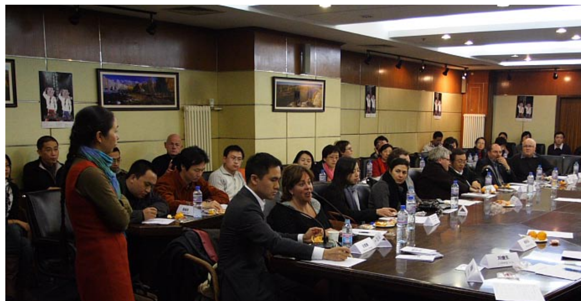
2007年在北京组织的《矮个子大男人》观影会，参会者有加拿大纪录片制作人、加拿大电影局、国内纪录片人和广电局工作人员。