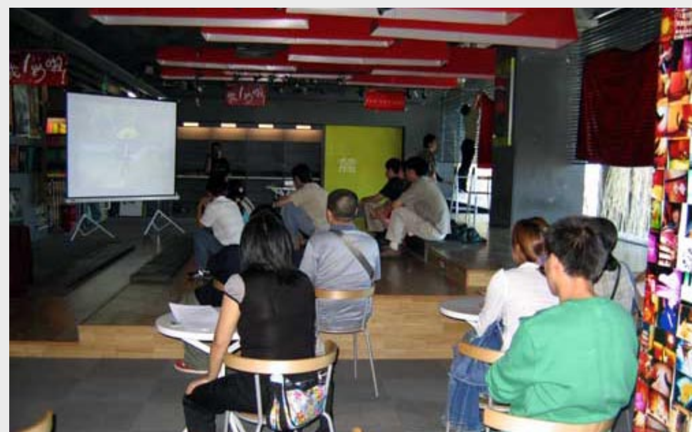
纪录片《姐妹观片会》

绪上短暂的无望，还是真正了无生还的绝望，我坐在那里，除了一遍遍安静的流泪之外，我都不知道自己还可以干什么。