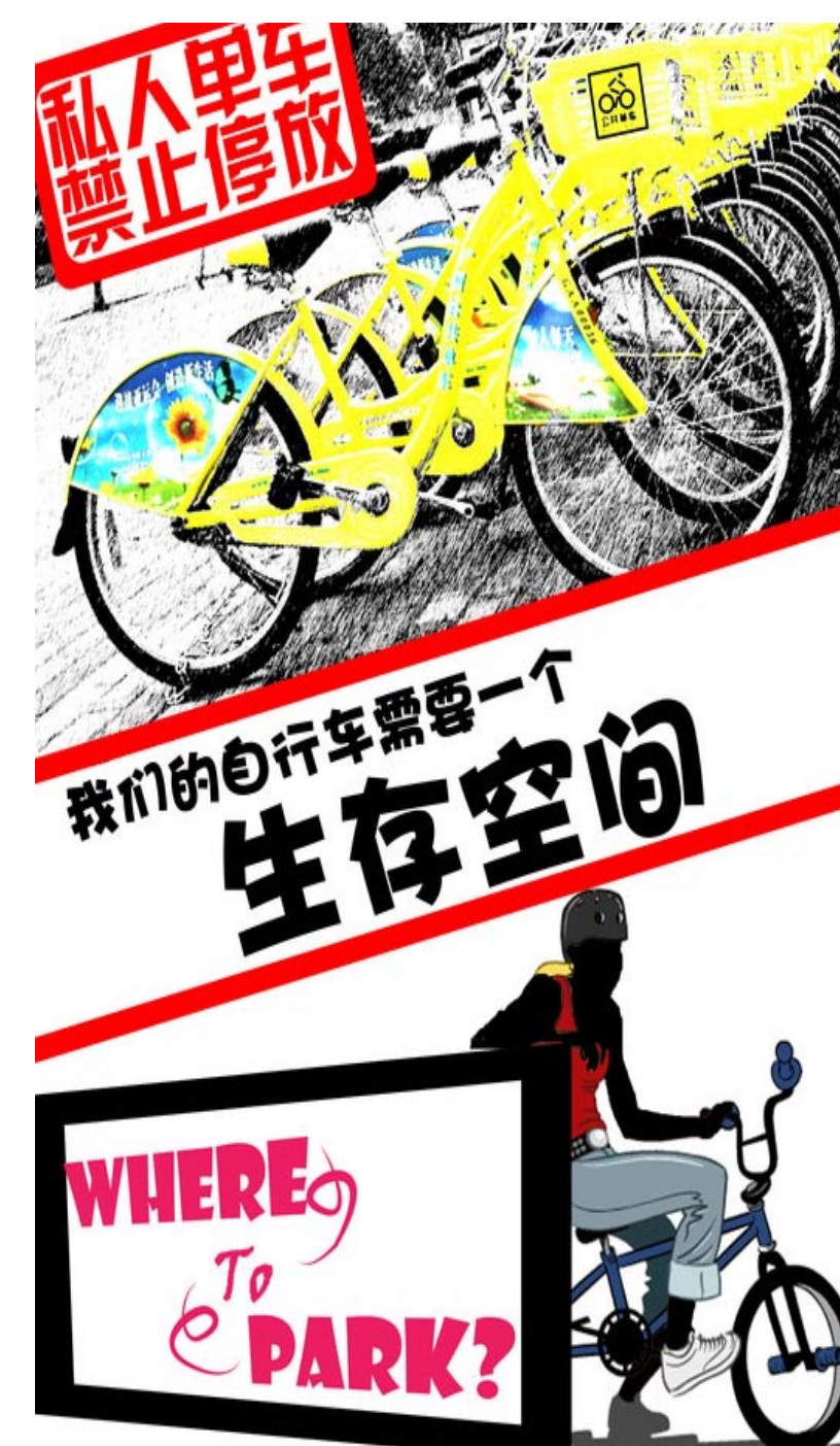
“我要送一辆自行车”

了解更多“拜客·广州”，点击： http://bike.gz.blog.163.com/