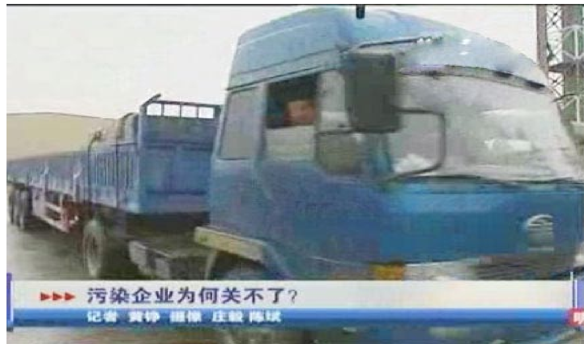
污染企业为何关不了?

我继续在网上查找，这次我的视线不再局限于小区论坛，于是我看到了更多惊人的事实。松江区有三个“金”字头的塑胶企业，分别是金泉山、金山、金腾山，被松江人民称为压在松江人民头上的三座大山。1998年松江区招商引资三家企业以来，陆续遭致周围居民投诉，已于2003年关停一家，另外两家，虽然投诉者众多，厂家也花费不少进行改造，但最终未有实质性改