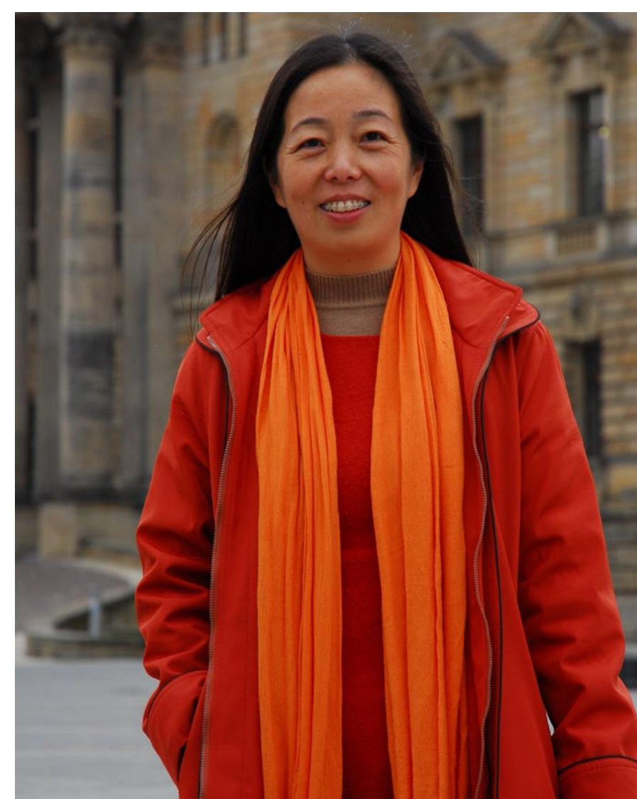
作者2006年在德国参加莱比锡纪录片和动画节。

零频道公司的理想是想在中国做一个真正的纪录片节，那是全世界纪录片人一个非常重要的交流平台，主要是做展映、主题研讨、工作坊和市场交易活动。在国外基本上都是非盈利组织在做的，我们要做的这个国际纪录片论坛实际上也是一个非营利活动，一个是放全世界最好、最新的获奖纪录片，第二是请全世界最顶尖的导演到中国来交流。我希望能长期办下去。以后我们