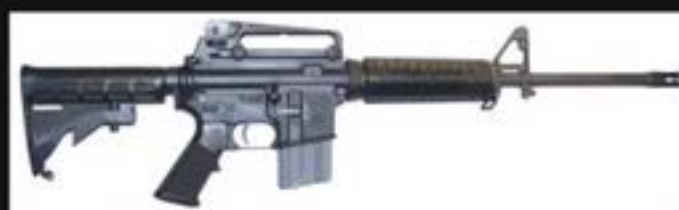
AR-15 自動步槍 AR-15

有效射程達60米， 可發射布袋彈、橡膠子彈及散彈。 遠距離會造成瘀傷， 近距離有機會造成內臟出血或死亡。