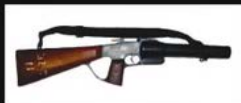
法德魯吋半口徑長槍 37/38mm Federal Riot Gun

有效射程達75米， 可發射催淚彈及橡膠子彈。 通常直接射向示威者下半身， 或射向地下後彈地再擊中示威者， 有機會造成內臟出血或死亡。