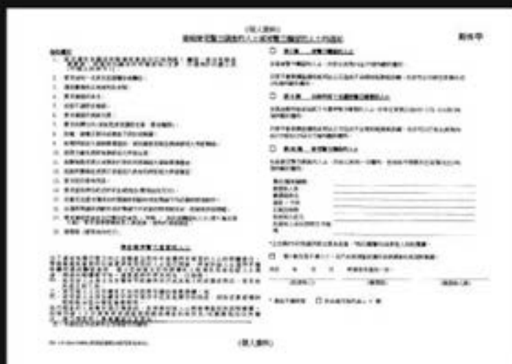
發給接受警方調查的人士 或被警方羈留的人士的通知書