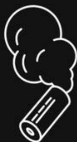
催淚彈 TEAR GAS