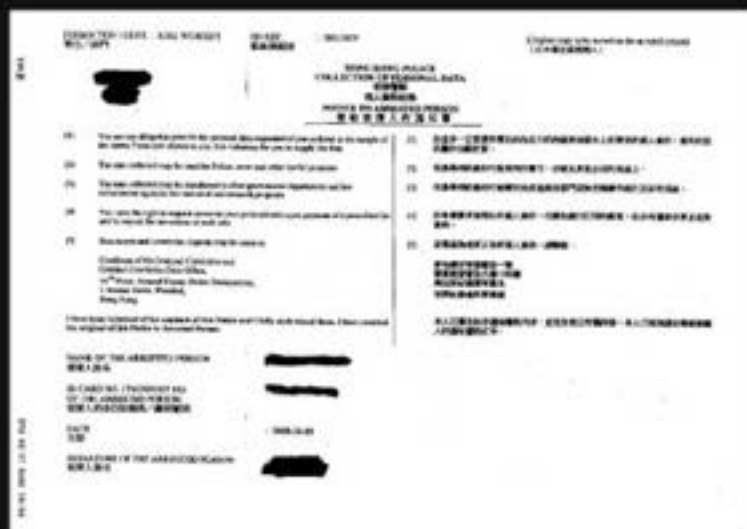
發給被捕人的通知書