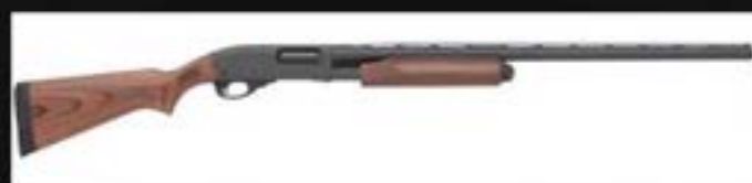
雷鳴登 870 散彈槍 Remington Model 870

有效射程達75米， 可發射催淚彈及橡膠子彈。 通常直接射向示威者下半身， 或射向地下後彈地再擊中示威者， 有機會造成內臟出血或死亡。