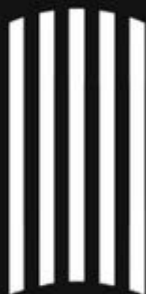
防暴長盾陣 RIOT SHIELD