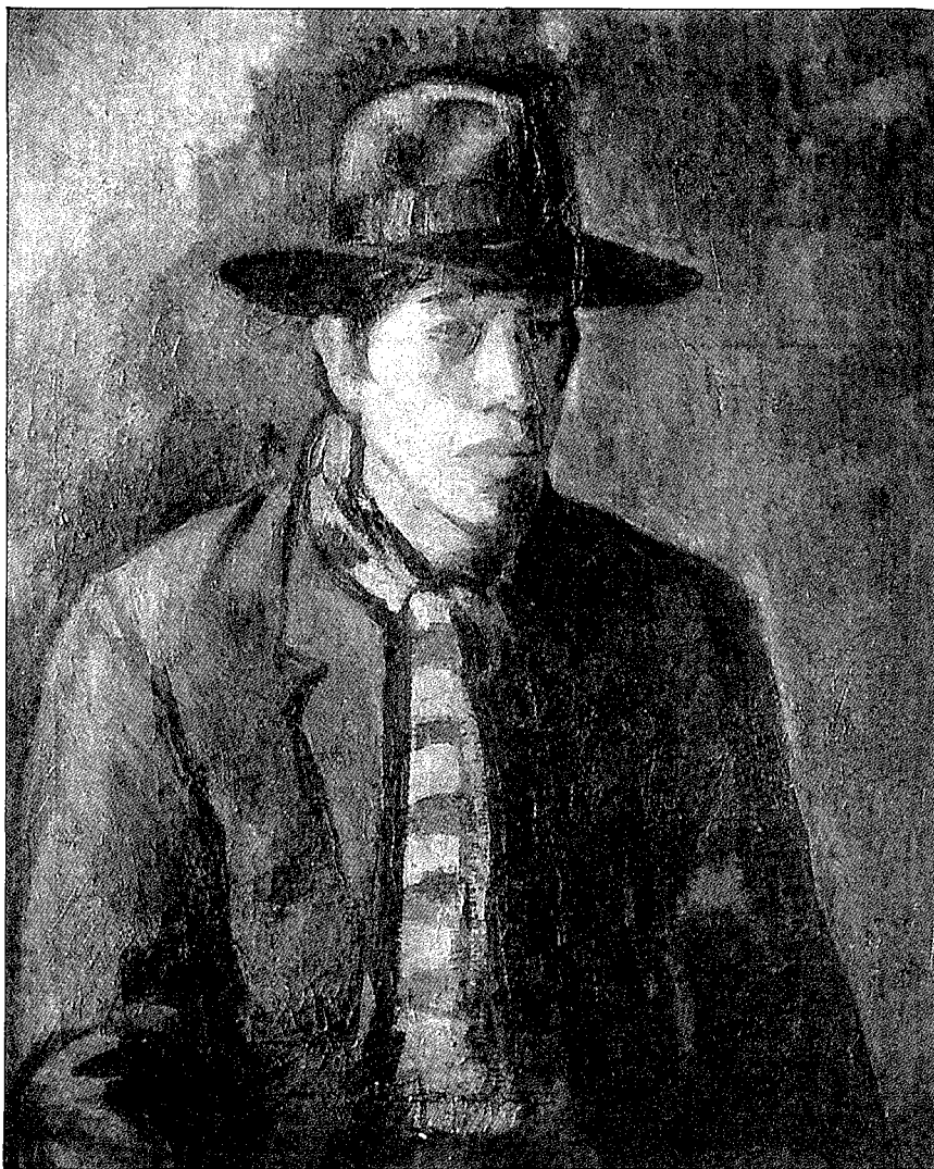
李梅樹獲獎的一幅〈自畫像〉。