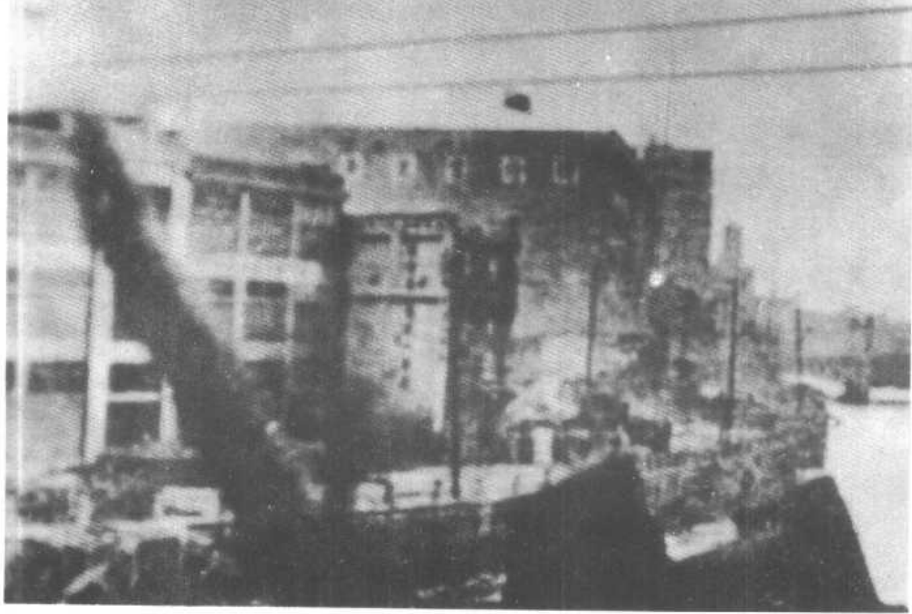
③炮火中的四行仓库。右为苏州河。