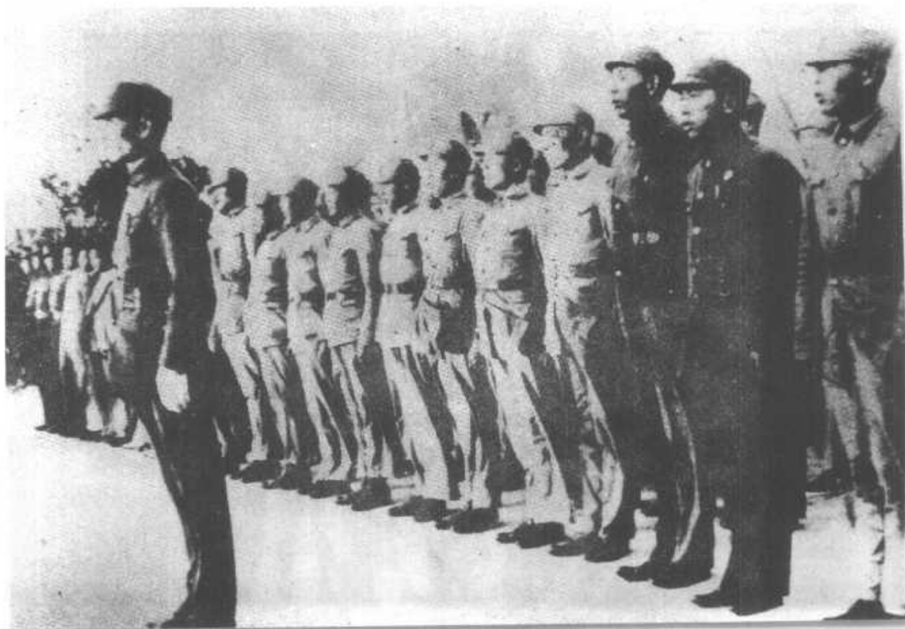
②孤军营精神升旗仪式。