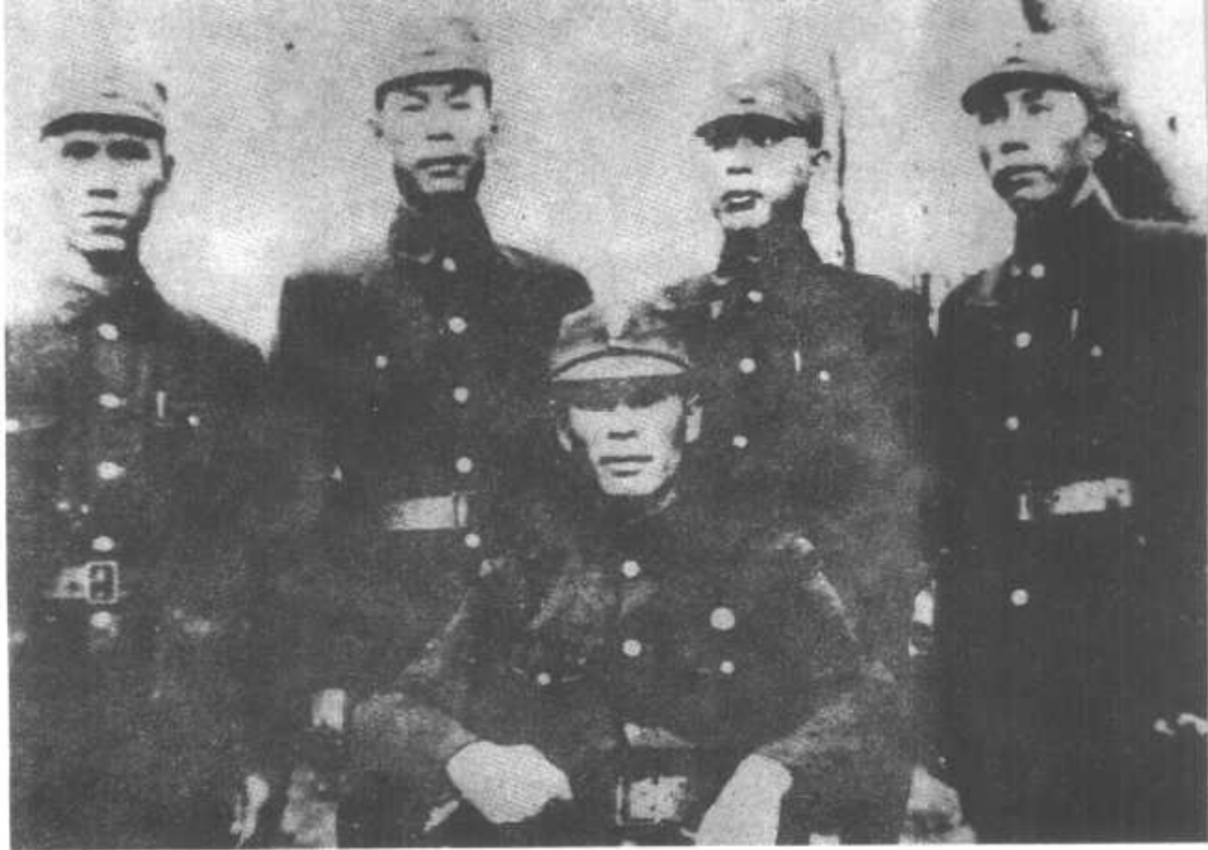
①孤军营主要军官：谢晋元（中）、邓英、雷雄、上官志标、唐棣（后排自左到右）。