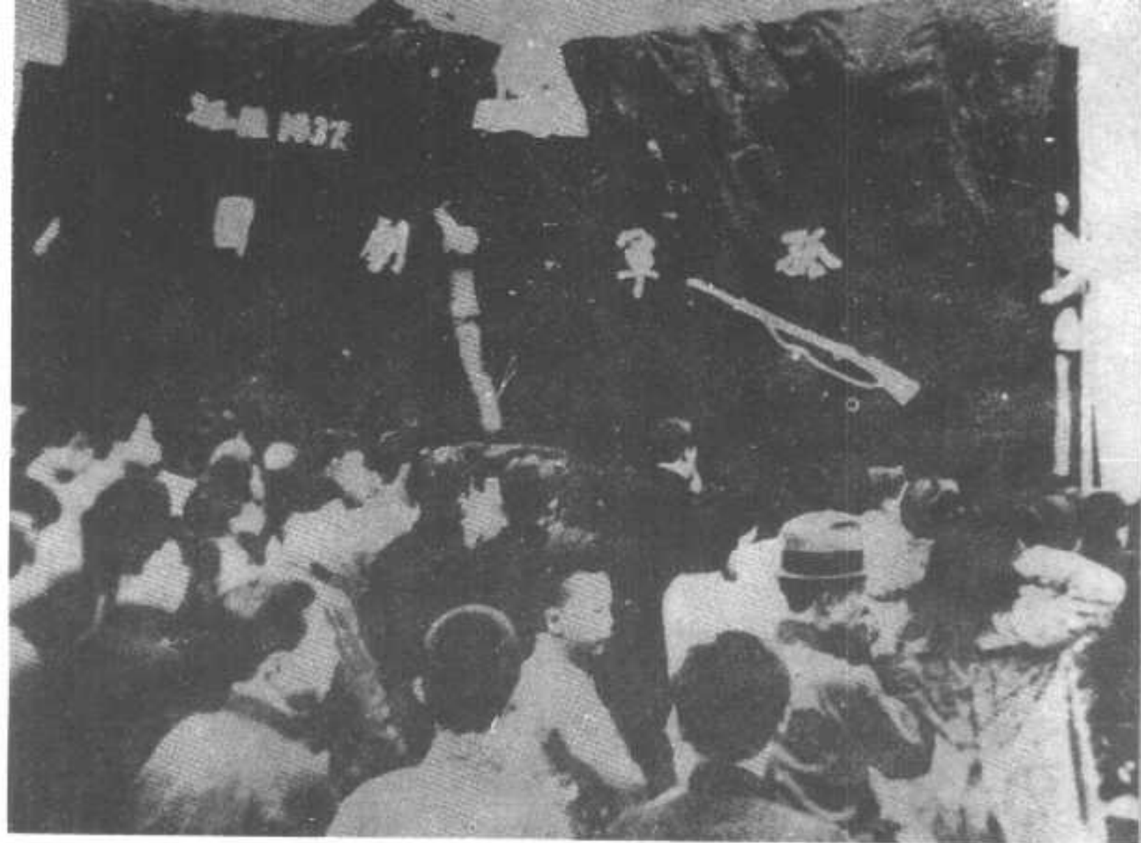
⑤热闹非凡的孤军营舞台。