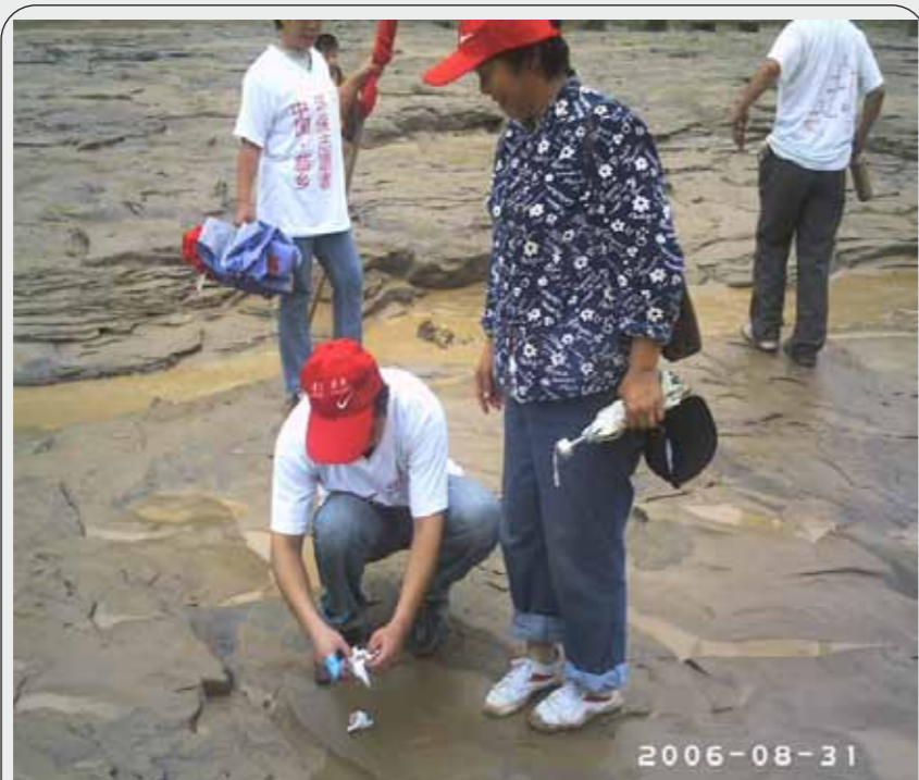
图：2009年7月，志愿者在黄河边检拾垃圾