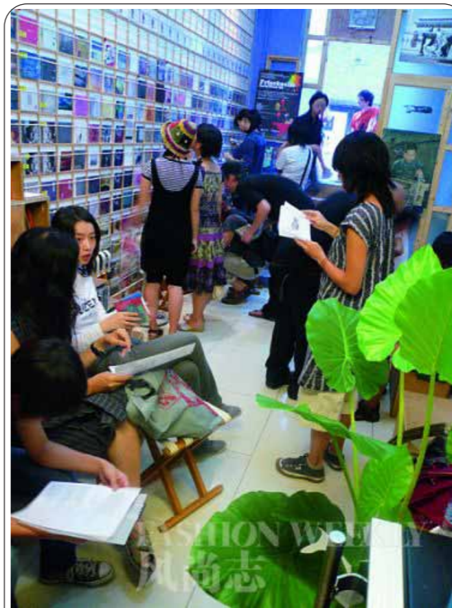
图：白糖罐虽小但很丰富

中国独立音乐其实已经形成一种“有机生态”：由于独立出版，没有卖点和商业利益的回报，或者出版审查通不过，渐渐形成独立的创作表达机制，包括独立的策划，独立的媒体和独立的乐评人，从小批人渐渐变成一个“独立的场景”。关注音乐的人都知道这个场景的存在，关注当代音乐的人也