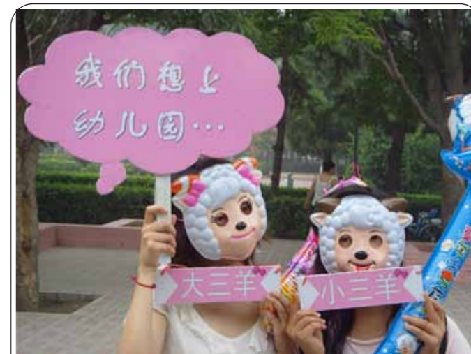
图：能上幼儿园一直是大三羊和小三羊的梦想

2009年7月22日，在北京某幼儿园门口两女生面戴喜羊羊面具，扮成“大三羊”和“小三羊”，另一男生则面戴灰太狼面具，手持木斧头，凶神恶煞，还不许大小三羊上幼儿园。“大小三羊代表乙肝大小三阳，而灰太狼则代表着乙肝歧视”，该