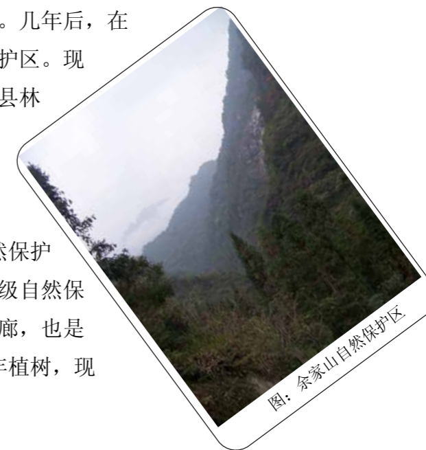
图：余家山自然保护区

对了，说明一下，平武余家山县级自然保护区与唐家河国家级自然保护区和小河沟省级自然保护区相连，是大熊猫栖息地和种群交换走廊，也是平武县城3万多人的饮用水源地。经过几年植树，现在保护区的森林覆盖率达100%。