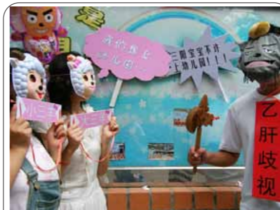
图：幼儿园板报边上，大三羊和小三羊无助的看着灰太狼，而灰太狼则拿着斧头凶神恶煞，不许大小三羊上幼儿园

虽然规定有了，但是改变一个人错误的观点与改变一个不合理的制度同等重要，要真正将这个《办法》落到实处，保证乙肝宝宝平等入园权利，还有很长的路要走。虽然路很长，但是坚信，走的人多了，路也就更平更宽。我们身后的乙肝宝宝们走起来也就更顺了。