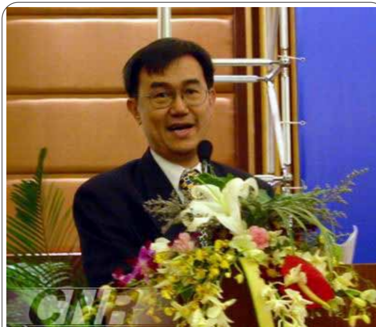
图1: 世界厕所组织创始人沈瑞华在2004年北京世界厕所峰会上致辞

有见及此,在2001年沈瑞华牵头创办了“世界厕所组织”,并成为主席,目前已有来自44个国家的60多个组织会员。自此该组织逐步成为改进“可持续卫生条件”的一般主要力量,并致力实现联合国“千年发展目标”中之“至2015年无法持续获得安全饮用水和基本环境卫生的人口比例减半”。这个目标不容易达至,现只剩下七年时间,亦增加了不少压力及逼切性。