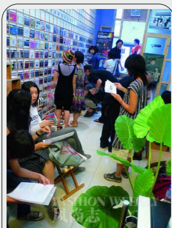
图：白糖罐虽小但很丰富