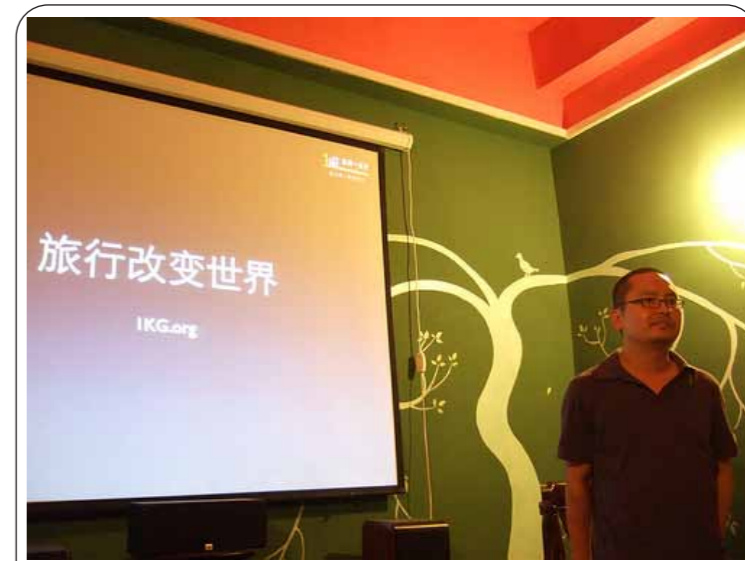
图：“多背一公斤”的梦想