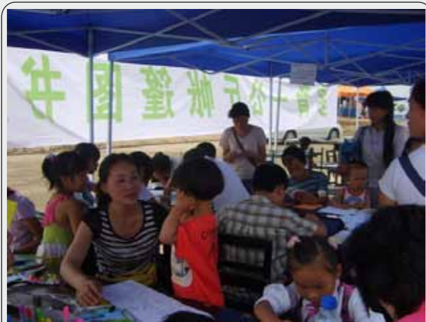
图：2008年汶川地震后多背一公斤在绵竹设立的第一个帐篷图书室，这样的图书室在灾区一共建了五十个