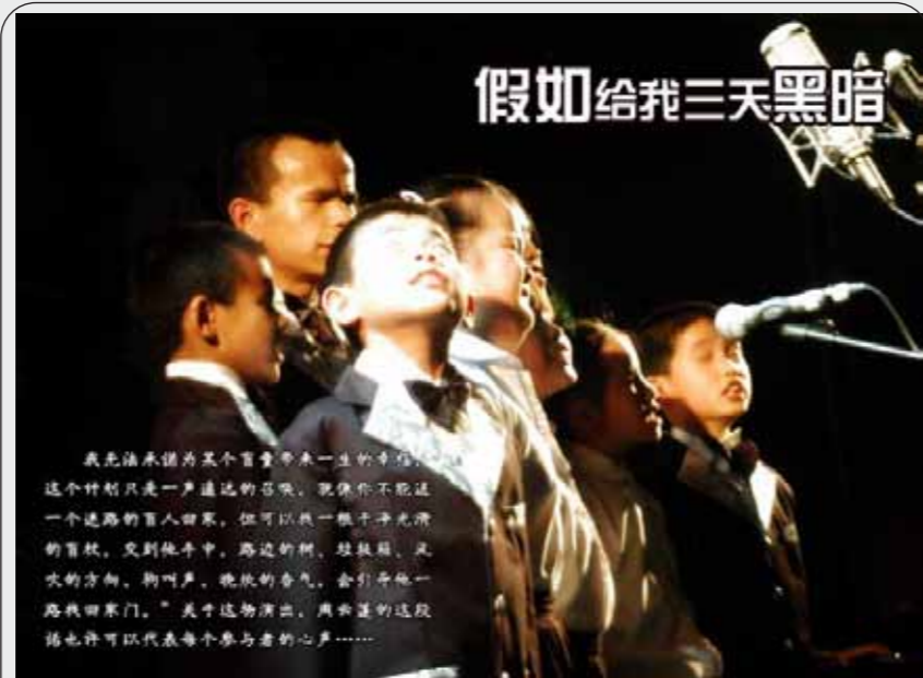
图:2009年4月10日,《红色推土机》首发现场