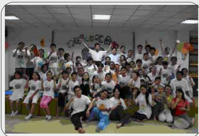
真如缘起工作室博客： http://zhenruiyuanqi.blog.sohu.com/

儿童戏剧营，并不是教导孩子们如何演戏，而是通过游戏、戏偶制作、音乐律动、舞台剧欣赏、表演等戏剧活动在玩”的过程中培养孩子的感官能力、创造力与想像力、人际关系，和语言、自我认识、肢体运动等能力。希望能给孩子们留下一个美好的回忆，给孩子的心灵播种一颗智慧快乐的种子。这个戏剧营已经在广州、河北、北京、浙江等地举办了十次，他们所带来的多元教育价值观及教育手法，引起众多儿童教育工作者的注意和兴趣。