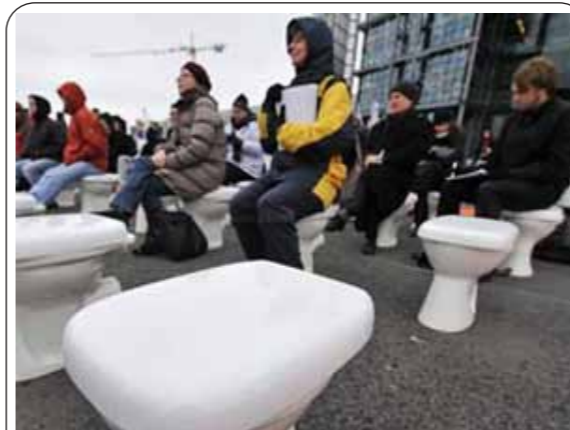
图:世界厕所组织提供的数据显示,目前全球至少有26亿人缺乏必要的清洁卫生设施,无厕所可上

“世界厕所组织”现正着手设计一套准则来评估厕所,最终可以以星级来划分。2008年的北京奥运会,在筹建期间亦参考了