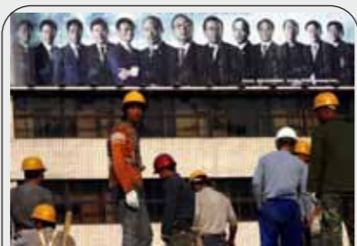
图：北京某建筑工地