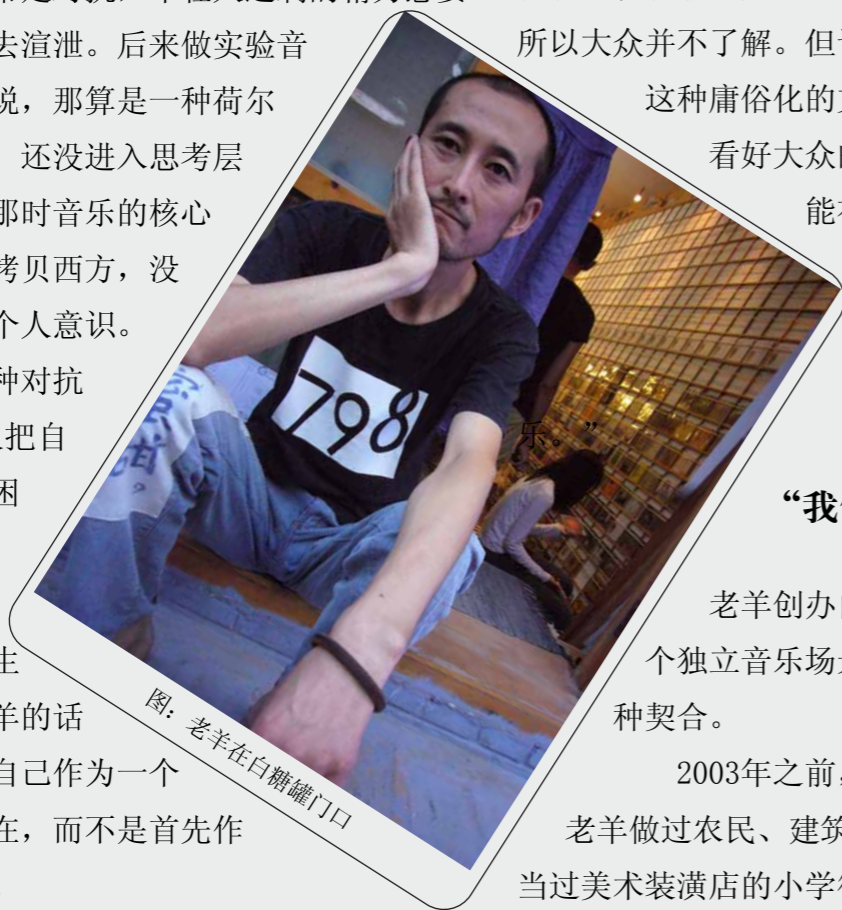
图：老羊在白糖罐门口

但是在这种对抗中，音乐人把自己逼入了困境，也渐渐丢失了自己的生活。用老羊的话说，先把自己作为一个音乐人存在，而不是首先作为一个人。