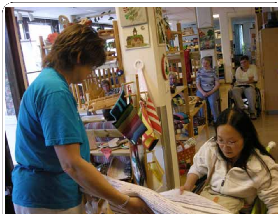
图：这家老人手工艺品商店里的东西让我爱不释手