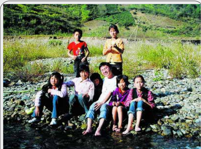
图：作者安猪和乡村小学的孩子们在一起