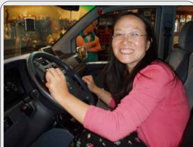
图：原来我也可以开车

这个工厂同时也是个残疾人的驾驶学校，残疾人可以直接用他们改装好的汽车来学习驾驶技术。老板的儿子还把他们的改装汽车的很多图片资料拷贝给了我，那一刻我甚至可以想象得出如果回去放给那些驾驶汽车的残疾朋友，他们该是一种什么样的惊讶和震感的表情呢？是呀，在瑞典他们已经把残疾人开的汽车改装到了不可想像的地步，而我们还在讨论残疾人该不该驾车，我想我的这些残疾朋友内心该充满动力了，此时想起了S的丈