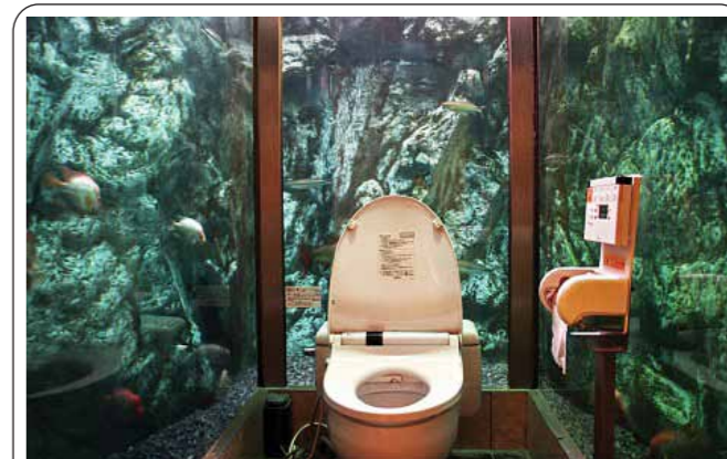
图:日本一家名叫“Mumin Papa”的咖啡厅在水族馆内做了一个水族厕所,如厕时周围都是游来游去有海底生物

2006年,新加坡第一次推选年度“社会企业家”奖,结果众望所归,沈瑞华荣获这个奖项,并应邀出席“世界经济论坛”介绍及推广“世界厕所组织”的经验。