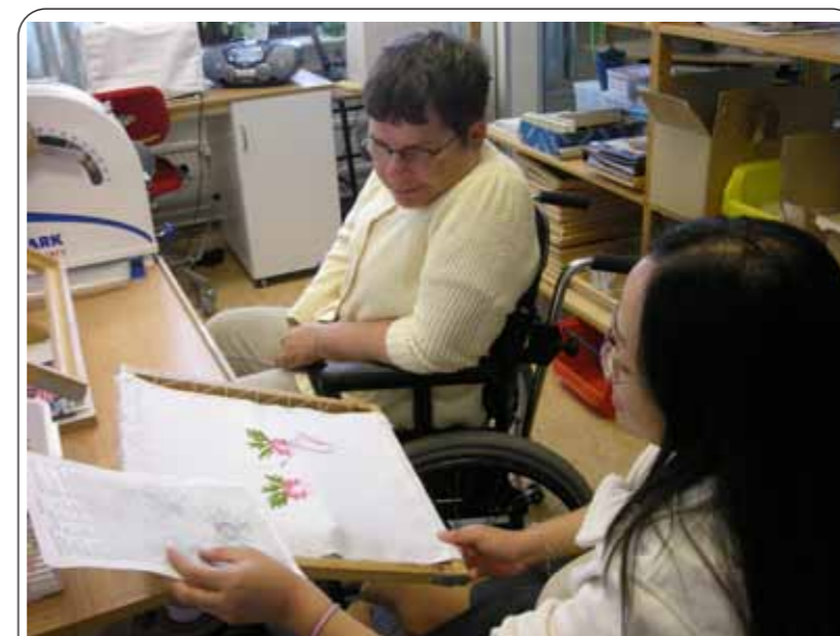
图:她的十字绣很漂亮