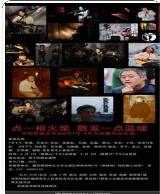
图：音乐人们为汶川地震灾区义演