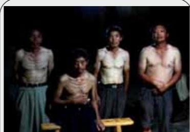
图：贵州某煤矿的澡堂