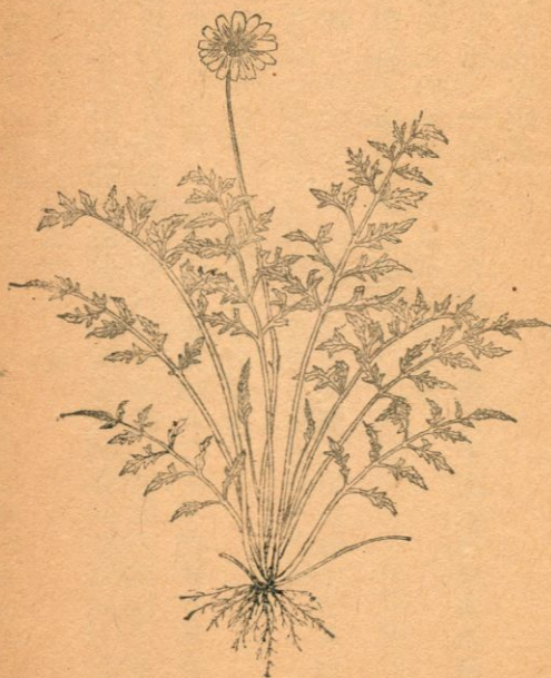
除 蟲 菊