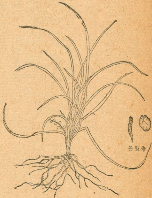
冬 門 冬

(六)修製 用溫開水浸潤，半小時後，取出，抽去他的心(中心柱)，然後入藥，否則服後煩躁。或用瓦