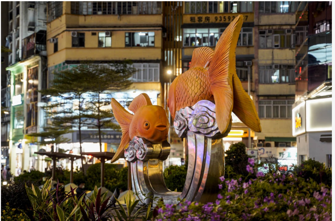
旺角通菜街的金魚雕塑。