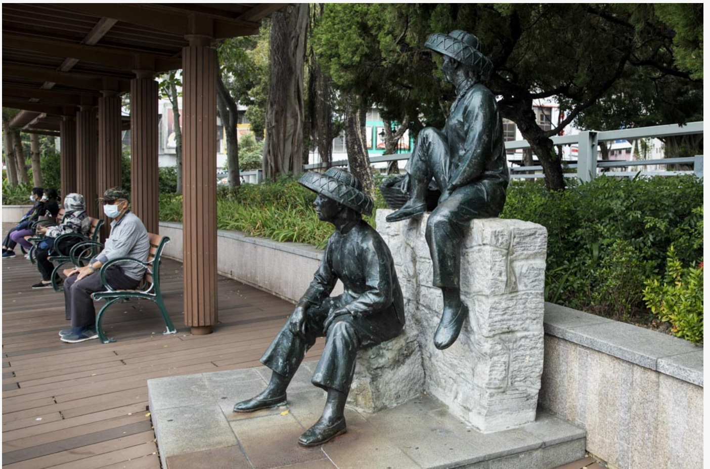
鴨脷洲海濱長廊，加建漁港特色建築。