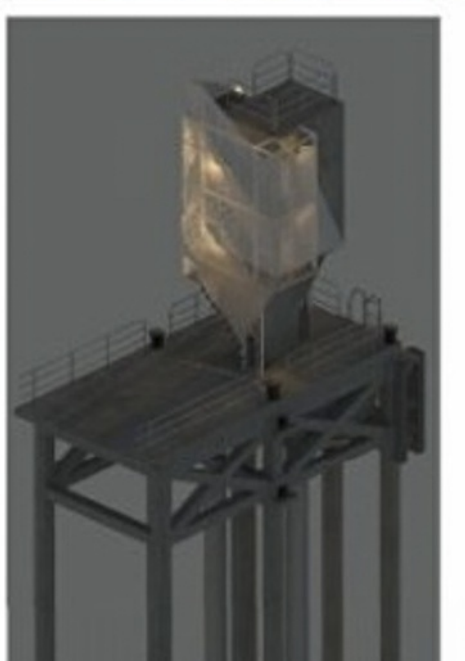
大埔滘潮汐站將重建，得獎作品名為「冰山一閣」，設計參考冰山形態。

「香港政府需要在意識和機制上，明白設計主導的重要，才能看得見美學。」根據香港政府現時分工，無論工程大小，皆由土木工程拓展署統籌，也就是社區地標興建是由工程方面牽頭主導。而香港一向喜歡去比較的對象新加坡，社會角色設計中工務工程是為規劃服務，而非去主導規劃。外國政府規劃新發展區時，多數聘用建築師或城市設計師作為舵手。