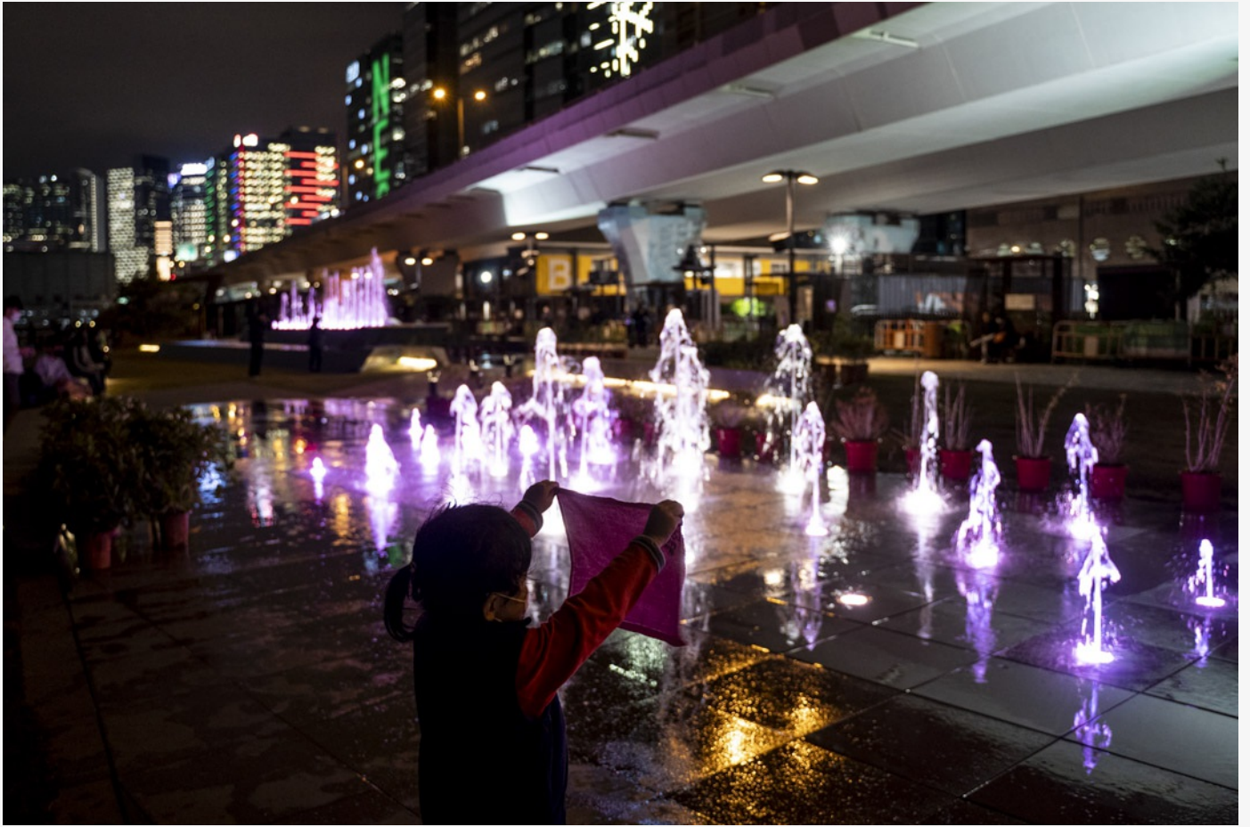
觀塘海濱的音樂噴泉。