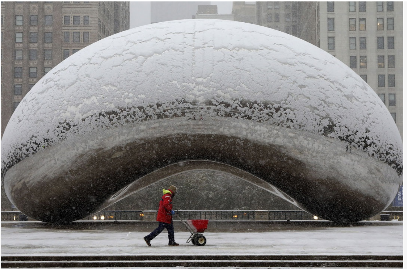
美國芝加哥千禧公園的AT&T廣場的一件塑像名為「雲門」(Cloud Gate)。

一直以來這些「公眾諮詢」都被區議員及民間團體批評為「假諮詢」。這樣的情況下，民間意見難以左右政策，結果，公共空間的設計和運用便多數只是反映政要與權貴的意欲和品味。「假如設計時以市民為本，公共空間就不會淪為一場權力遊戲。」