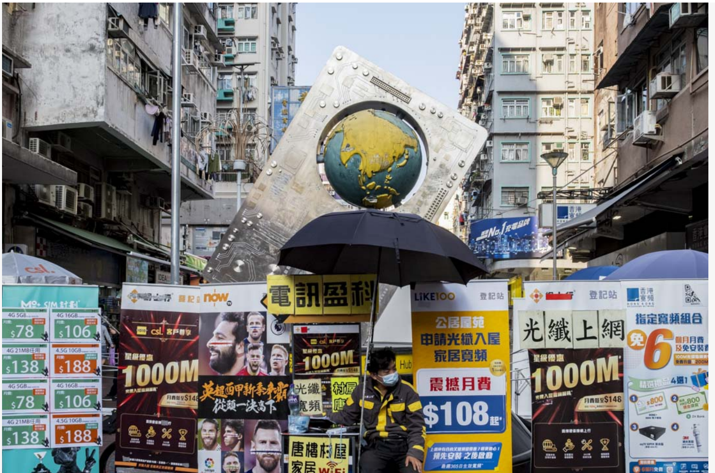
深水埗地鐵站出口附近豎立的一塊電腦主板，名為「香港數碼之源」