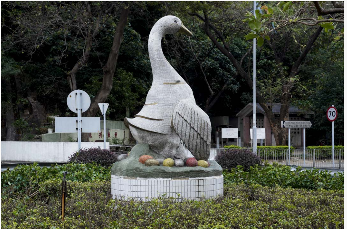
深井巨型燒鵝雕塑。