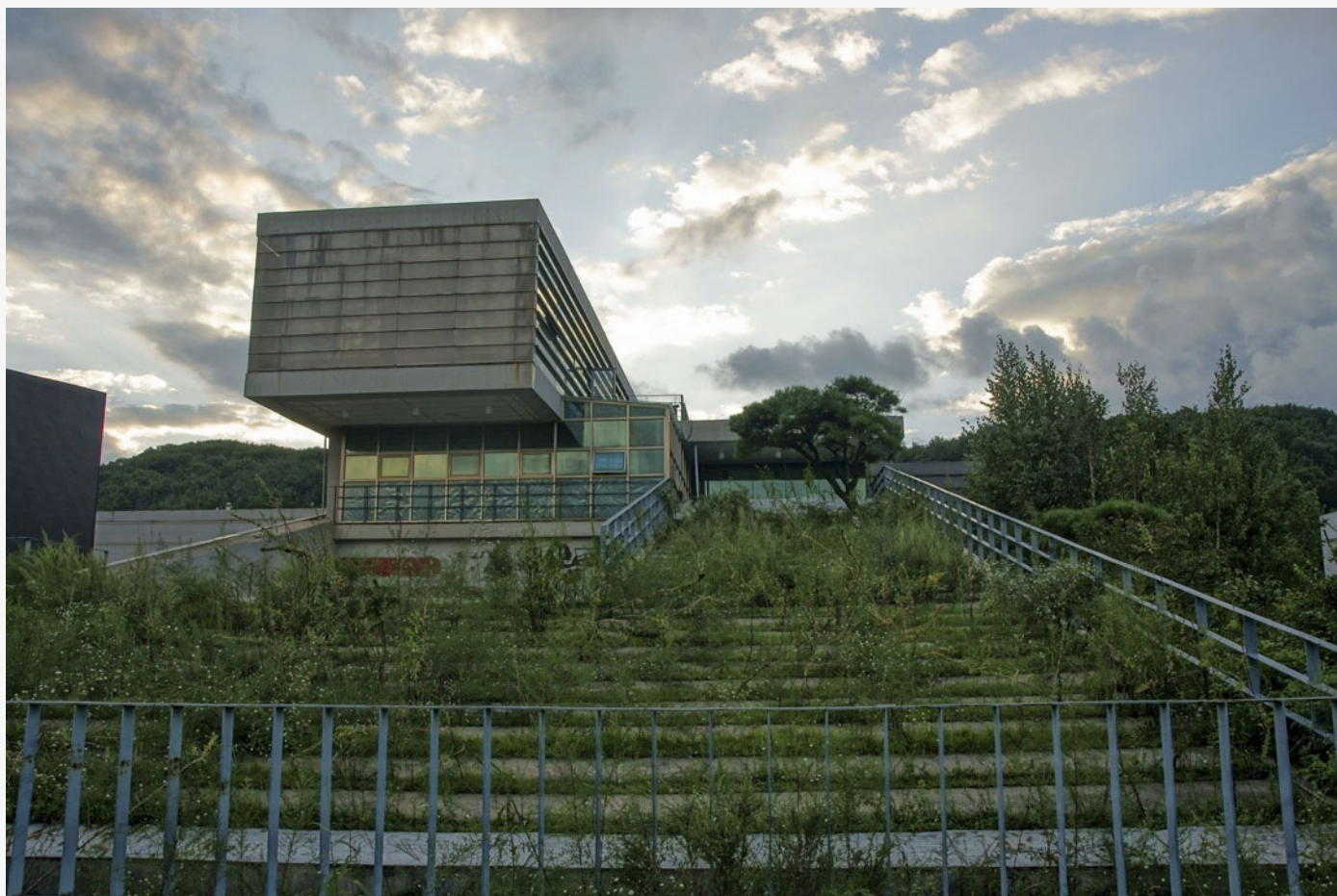
Heyri藝術村是全球十大創意藝術園區之一。

每一件裝置，彷彿都在安慰大家，鄉愁有很多種，但是你不是孤單一人。在異鄉，流散的人們找到新家，也能尋回故鄉。