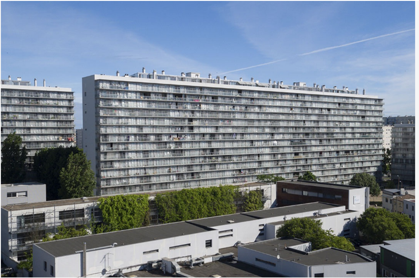
法國波爾多大公園區（Grand Parc, Bordeaux）的公屋群。

「問題是，官員有無反思房屋政策如何提升市民的生活質素？室內設計能否顧及不同人士的需要？市民住得舒適嗎？生活得健康嗎？政策着眼點似乎與『人』本身沒有直接關係。」