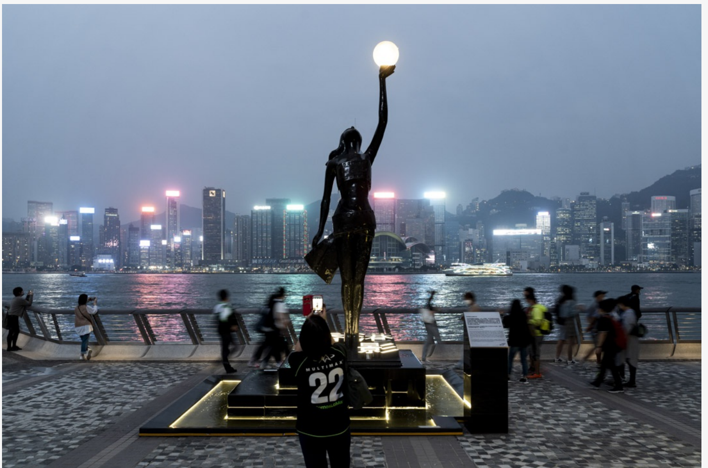
尖沙咀星光大道。